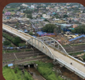
କୁଦିଆରୀ ରେଳ ଓଭର-ବ୍ରିଜ