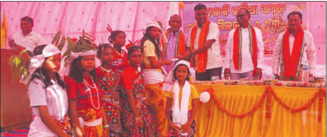
ପୁରାତନ ଛାତ୍ର ସମାବେଶ ବନ୍ଧୁତାକୁ ମଜଭୁତ କରେ

ଉପସ୍ଥିତ ବନ୍ଧୁଙ୍କ ମଧ୍ୟରେ ବନ୍ଧୁତାକୁ ନବୀକରଣ କରିବା ସହ ସୌହାର୍ଦ୍ଦପୂର୍ଣ୍ଣ ବାତାବରଣକୁ ସୁରକ୍ଷା ଦେଇ ବୋଲି ମତବ୍ୟକ୍ତ କରିଥିଲେ। ଏହି ଅବସରରେ ପୁରୁଣା ବନ୍ଧୁମାନେ ନିଜ ପରିବାର ସହ ଏକାଠି ହୋଇ ଉତ୍ସାହ ଏବଂ ଆନନ୍ଦରେ ପରିପୂର୍ଣ୍ଣ ବିଗତ ଦିନର ସ୍ମୃତିଚାରଣ କରିଥିଲେ। ସେମାନଙ୍କର ବିଦ୍ୟାଳୟର କାବନଯାତ୍ରା ବିଷୟରେ ଅଭିଜ୍ଞତା ଏବଂ ପ୍ରେରଣାଦାୟକ ପୁରୁଣା ଦିନର କଥା ମନେ ପକାଇ ବିଦ୍ୟାଳୟ ପରବର୍ତ୍ତୀ ଆଦାନପ୍ରଦାନ କରିଥିଲେ।