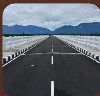
ଆଠମଲ୍ଲିକ-ଧଳପୁର ଦୀର୍ଘତମ ସେତୁ