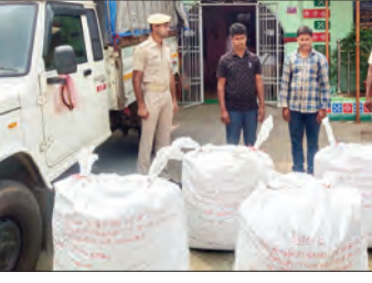
ପୁରୀର ବୌଦ୍ଧ ଜିଲ୍ଲାର ଆଭ୍ୟନ୍ତରୀଣ ଅଞ୍ଚଳରୁ ଗଞ୍ଜେଇ ଚାଲାଣ ସମ୍ପର୍କରେ ବିଶ୍ୱସ୍ତସୂତରୁ ସୂଚନା ପାଇ ବୌଦ୍ଧ ଆନାର ଏକ ଟିମ୍ ଖୋର୍ଦ୍ଧା-ବଲାଙ୍ଗିର ୫୭ ନମ୍ବର ଉକ୍ତ କରାଯାଇ ଦୁଇ ଅଭିଯୁକ୍ତଙ୍କୁ କୋର୍ଟ ଚାଲାଣ କରାଯାଇଥିବା ଆନାଧିକାରୀ ଆସୁଥିବା ଓଡ଼ି ୧୯ ଯୁ ୦୯୦୦ ନମ୍ବର