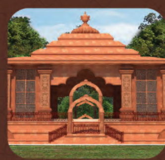
ମହାପୁରୁଷ ଶ୍ରୀ ଶ୍ରୀ ଅତ୍ୟୁତାନନ୍ଦ ଦାସଙ୍କ ଗାବୀ ଓ ପୀଠ