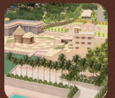
ମା ଉଗ୍ରତାରା ଶକ୍ତିପୀଠ