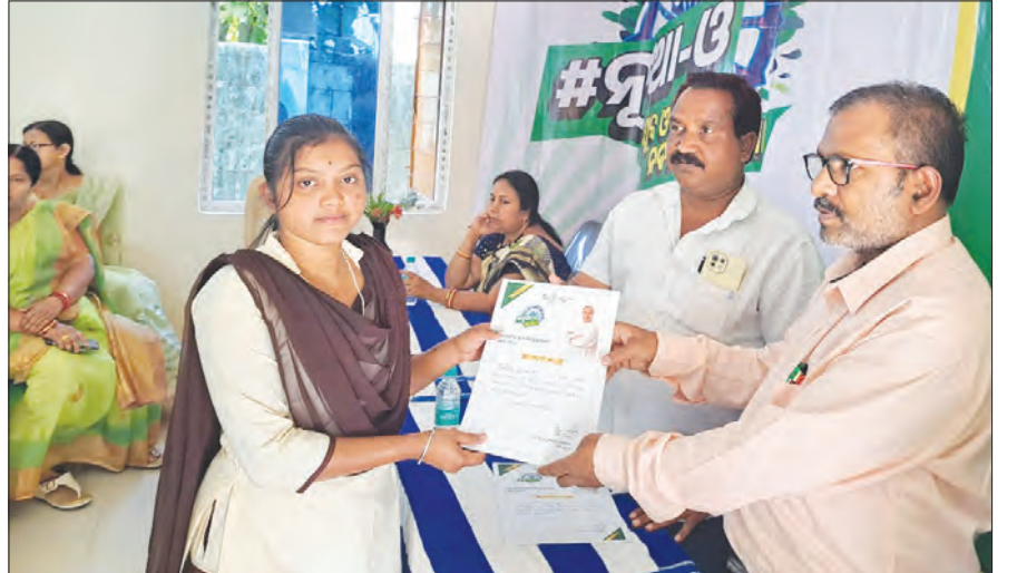
କିର୍ତ୍ତିମା ତିଗ୍ରୀ କଲେଜରେ ଛାତ୍ରବୃତ୍ତି ଅନୁଦାନପତ୍ର ବଣ୍ଟନ