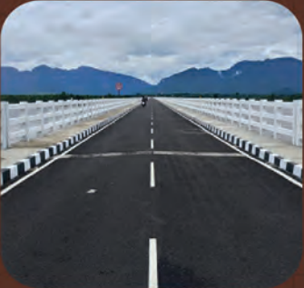
ଆଠମଲ୍ଲିକ-ଧଳପୁର ଦୀର୍ଘତମ ସେତୁ