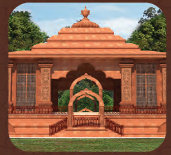
ମହାପୁରୁଷ ଶ୍ରୀ ଶ୍ରୀ ଅତ୍ୟୁତାନନ୍ଦ ଦାସଙ୍କ ଗାଦୀ ଓ ପୀଠ