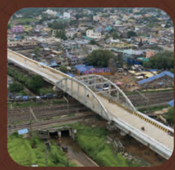
କୁଦିଆରୀ ରେଳ ଓଭର-ବ୍ରିଜ