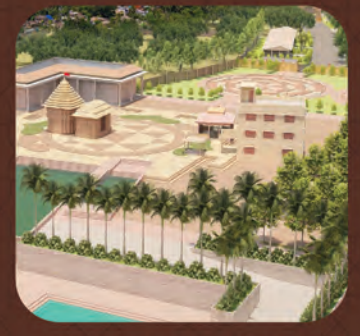
ମା ଉଗ୍ରତାରା ଶକ୍ତିପୀଠ