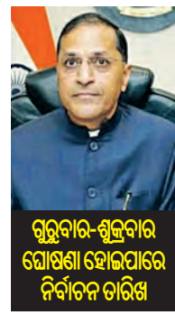
ରୁରା-ଶୁଭକାର ଘୋଷଣା ହୋଇପାରେ ନିର୍ବାଚନ ଚାରିଖ

■ ନୂଆଦିଲ୍ଲୀ, ୯।୩।(ଏଜେନ୍ସି): ଏକ ଅପ୍ରତ୍ୟାଶିତ ଘଟଣାକ୍ରମେ ଲୋକସଭା ନିର୍ବାଚନ ପାଇଁ ଚାରିଖ ଦୋଷଣା ପୂର୍ବରୁ ନିର୍ବାଚନ କମିସନ (ଇସି) ଅରୁଣ ଗୋୟଲ ନିଜ ପଦରୁ ଇସ୍ତଫା ଦେଇଛନ୍ତି । ରାଷ୍ଟ୍ରପତି ଦ୍ରୌପଦୀ ମୂର୍ମୁ ମଧ୍ୟ ତାଙ୍କ ଇସ୍ତଫାକୁ ଗ୍ରହଣ କରିଛନ୍ତି । ୬ ଟା ୧୫ ଟା ୧୦