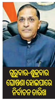
ରୁରା-ଶୁଭକାର ଘୋଷଣା ହୋଇପାରେ ନିର୍ବାଚନ ଚାରିଖ

■ ନୂଆଦିଲ୍ଲୀ, ୯।୩।(ଏଜେନ୍ସି): ଏକ ଅପ୍ରତ୍ୟାଶିତ ଘଟଣାକ୍ରମେ ଲୋକସଭା ନିର୍ବାଚନ ପାଇଁ ଚାରିଖ ଦୋଷଣା ପୂର୍ବରୁ ନିର୍ବାଚନ କମିସନ (ଇସି) ଅରୁଣ ଗୋୟଲ ନିଜ ପଦରୁ ଇସ୍ତଫା ଦେଇଛନ୍ତି । ରାଷ୍ଟ୍ରପତି ଦ୍ରୌପଦୀ ମୂର୍ମୁ ମଧ୍ୟ ତାଙ୍କ ଇସ୍ତଫାକୁ ଗ୍ରହଣ କରିଛନ୍ତି । ୬ ଟା ୧୫ ଟା ୧୦