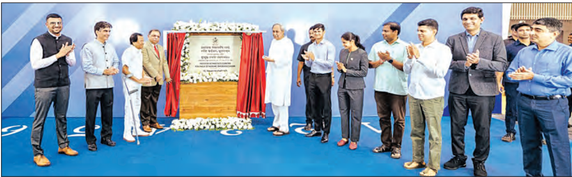
ପ୍ରତିକୂଳ ପାଗରେ ବି ବର୍ଷସାରା ଅଭ୍ୟାସ କରିପାରିବେ କ୍ରୀଡ଼ାବିତ୍: ମୁଖ୍ୟମନ୍ତ୍ରୀ

ମାଧ୍ୟମରେ ସାରା ବିଶ୍ୱର ଦୃଷ୍ଟି ଆକର୍ଷଣ କରିଥିଲା ଓଡ଼ିଶା। ଏବେ ଏହି ତାଲିକାରେ ଇଣ୍ଡୋର ଆଥଲେଟିକ୍ସ ସେଣ୍ଟର ଯୋଡ଼ି ହୋଇଯାଇଛି। ଏହାକୁ ଶନିବାର ମୁଖ୍ୟମନ୍ତ୍ରୀ କଳିଙ୍ଗ ଷ୍ଟାଡ଼ିୟମ ପରିସରରେ ନବନିର୍ମିତ ଇନ୍ଡୋର ଜଳକ୍ରୀଡ଼ା କେନ୍ଦ୍ର (ଆକ୍ୱାଟିକ ସେଣ୍ଟର)କୁ ଉଦ୍ଘାଟିତ କରିବା ସହ ଇନ୍ଡୋର ଡାଇଟ୍ ସେଣ୍ଟର ପାଇଁ ଭିତ୍ତିପ୍ରସ୍ତର ସ୍ଥାପନ କରିଥିଲେ। ଏହି ଇନ୍ଡୋର ଆଥଲେଟିକ୍ସ ସେଣ୍ଟର ଉଦ୍ଘାଟିତ ହେବା ସହ ସମଗ୍ର ରାଜ୍ୟ ତଥା ଦେଶର କ୍ରୀଡ଼ାବିତ୍ଙ୍କ ମନରେ ନୂଆ ଆଶା ସୃଷ୍ଟି ହୋଇଛି। ଉଦ୍ଘାଟନା କ୍ରୀଡ଼ାବିତ୍ଙ୍କ ଅଭ୍ୟାସରେ ପାଗ ଏବେ ଆଉ ପ୍ରତିବନ୍ଧକ ସାଜିପାରିବ ନାହିଁ।