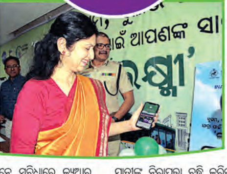
ୟୁପିଆଇ କ୍ୟୁଆର କୋଡ୍ ସ୍କାନ କରିବା ପାଇଁ ଲକ୍ଷ୍ମୀ ବସ୍ରେ ଯାତ୍ରୀଙ୍କୁ ପ୍ରୋତ୍ସାହନ ଦିଆଯାଇଛି ।

'ଲକ୍ଷ୍ମୀ' ବସ୍ରେ ଯାତାୟତ ବେଳେ କ୍ୟାସଲେସ୍ ପେମେଣ୍ଟକୁ ପ୍ରୋତ୍ସାହନ ଦିଆଯାଇଛି । ଯାତ୍ରୀମାନେ ନଗର ଟଙ୍କା ନ ଦେଇ ୟୁପିଆଇ ମାଧ୍ୟମରେ କ୍ୟୁଆର କୋଡ୍ ବ୍ୟବହାର କରି ଉତ୍ତମ ଅର୍ଥ ବେଳ ଏହି ବସ୍ରେ ଯାତ୍ରା କରିବାର ସୁବିଧା ପାଇଛନ୍ତି । ପ୍ରଥମେ 'ମୋ ବସ୍'ରେ ଏହି ସୁବିଧା ଆରମ୍ଭ ହୋଇଥିବା ବେଳେ ଗତ ଡିସେମ୍ବର ମାସରେ ଲକ୍ଷ୍ମୀ ବସ୍ରେ ମଧ୍ୟ ଯାତ୍ରୀଙ୍କୁ ଉତ୍ତମ ସେବା ଯୋଗାଇଦେବା ଉଦ୍ଦେଶ୍ୟରେ ଗାଣିକ୍ୟ ଓ ପରିବହନ ବିଭାଗ ଏବଂ ଓଡ଼ିଶା ରାଜ୍ୟ ସଡ଼କ ପରିବହନ ନିଗମ ପକ୍ଷରୁ 'ୟୁପିଆଇ କ୍ୟୁଆର କୋଡ୍' ବ୍ୟବହାର କରାଯାଇଛି । ଏହାସହ ଯାତ୍ରୀମାନେ ସୁବିଧାରେ କ୍ୟୁଆର କୋଡ୍ ସ୍କାନ କରି ଟଙ୍କା ଦେଇ ଯାତ୍ରା ସରକାର ଆଶା ରଖିଛନ୍ତି ।