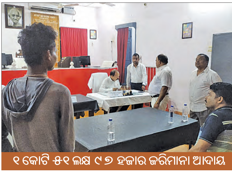
୧ କୋଟି ୫୧ ଲକ୍ଷ ୯୭ ହଜାର ଜରିମାନା ଆଦାୟ

କେନ୍ଦ୍ରାପାଳ, ୧୯୩ (ସମ୍ପାଦନା) : କେନ୍ଦ୍ରାପାଳ ଜିଲ୍ଲାରେ ଥିବା ବିଭିନ୍ନ ଅଦାଳତରେ ପ୍ରଥମ ରାଷ୍ଟ୍ରୀୟ ଲୋକଅଦାଳତ ଅନୁଷ୍ଠିତ ହୋଇଯାଇଛି । ଏହି ଲୋକଅଦାଳତ ଗୁଡ଼ିକରେ ମୋଟ ୧ ହଜାର ୫୩୭ଟି ମାମଲାର ଫଇସଲା କରାଯାଇ ମୋଟ ୧ କୋଟି ୫୧ ଲକ୍ଷ ୯୭ ହଜାର ୪୧୪ ଟଙ୍କା ଆଦାୟ କରାଯାଇଛି । ଜିଲ୍ଲା ଓ ଦୌରାଭକ୍ତ ତଥା ଜିଲ୍ଲା ଆଇନସେବା ପ୍ରାଧିକରଣ ଅଧିକାରୀଙ୍କ ପ୍ରସ୍ତାବ ମହାଶ୍ବେତ ଚକ୍ରାଧିକାରୀଙ୍କୁ ଅଧିକାରୀଙ୍କୁ କୋର୍ଟ ପରିସରରେ ଏହି ଲୋକ ଅଦାଳତ ଅନୁଷ୍ଠିତ ହୋଇଯାଇଛି । ମୋଟର ଦୁର୍ଘଟଣା ଜନିତ ୨୪୮ଟି, ବିବାହ ଏବଂ ପାରିବାରିକ ମାମଲା ୪୮ଟି, ଦେଖାନା ମାମଲା ୮୦ଟି, ଫୌଜଦାରୀ ମାମଲା ୧୪୫ଟି, ରାଜସ୍ବ ମାମଲା ୧ ହଜାର ୨୮୪ଟିର ସମାଧାନ କରାଯାଇଛି । ସେହିପରି ବ୍ୟାଙ୍କ ମାମଲା ଗୁଡ଼ିକ ଆପୋଷ ବୁଝାମଣା ମଧ୍ୟରେ ସମାଧାନ କରାଯାଇଛି । ମୋଟର ଦୁର୍ଘଟଣା ବାବଦକୁ ମୋଟ ୧ କୋଟି ୧୨ ଲକ୍ଷ ୬୦ ହଜାର ଟଙ୍କା ପ୍ରଦାନ କରାଯାଇଥିବା ବେଳେ ଅନ୍ୟାନ୍ୟ ମାମଲା ଗୁଡ଼ିକରେ କ୍ଷମାପତ୍ର ଓ ବ୍ୟାଙ୍କ ରାଶି ମାମଲା ଫଇସଲା ବାବଦକୁ ୩୯ ଲକ୍ଷ ୩୭ ହଜାର ୪୧୪ ଟଙ୍କା ବିଭିନ୍ନ ଅଦାଳତ ମାନଙ୍କରେ ଆଦାୟ କରାଯାଇଛି ।