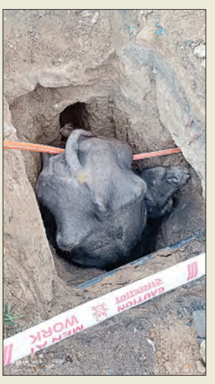
ଫଳରେ ଭାଟିପଡ଼ା ଗ୍ରାମବାସୀ ତାଙ୍କୁ ଉଦ୍ଧାର କରିଛନ୍ତି।

ବାଲିଶଙ୍କରା, ୨୯/୧୨ (ସମ୍ପାଦକ): ବାଲିଶଙ୍କରା ବ୍ଲକର ବିଭିନ୍ନ ଅଞ୍ଚଳରେ ସମସ୍ତଙ୍କୁ ଗାତରେ ପଡ଼ିଯାଇଥିବା ମଇଁଷିକୁ ଉଦ୍ଧାର କରିଛନ୍ତି ଗ୍ରାମବାସୀ। ଏହି ଘଟଣାରେ ଗାତରେ ପଡ଼ିଯାଇଥିବା ମଇଁଷିକୁ ଉଦ୍ଧାର କରିଛନ୍ତି ଗ୍ରାମବାସୀ। ଏହି ଘଟଣାରେ ଗାତରେ ପଡ଼ିଯାଇଥିବା ମଇଁଷିକୁ ଉଦ୍ଧାର କରିଛନ୍ତି ଗ୍ରାମବାସୀ।