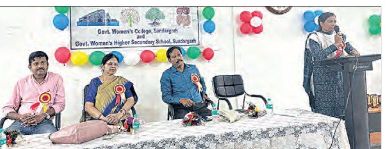
ମହାବିଦ୍ୟାଳୟର ବିଭିନ୍ନ ବିଜ୍ଞାନ ବିଭାଗର ପ୍ରମୁଖ ନିଜ ବିଷୟରେ ବିଜ୍ଞାନ ଦିବସ ପାଳିତ ହୋଇଥିଲା। ଏହି ଅବସରରେ ଆୟୋଜିତ ହୋଇଥିବା କାର୍ଯ୍ୟକ୍ରମରେ ବିଜ୍ଞାନ ଦିବସ ପାଳିତ ହୋଇଥିଲା।

ସୁଦରଗଡ଼, ୨୯/୧୨(ସମ୍ପାଦକ): ସୁଦରଗଡ଼ ସରକାରୀ ମହାବିଦ୍ୟାଳୟରେ ଜାତୀୟ ବିଜ୍ଞାନ ଦିବସ ପାଳିତ ହୋଇଥିଲା। ଏହି ଅବସରରେ ଆୟୋଜିତ ହୋଇଥିବା କାର୍ଯ୍ୟକ୍ରମରେ ବିଜ୍ଞାନ ଦିବସ ପାଳିତ ହୋଇଥିଲା। ଏହି ଅବସରରେ ଆୟୋଜିତ ହୋଇଥିବା କାର୍ଯ୍ୟକ୍ରମରେ ବିଜ୍ଞାନ ଦିବସ ପାଳିତ ହୋଇଥିଲା।