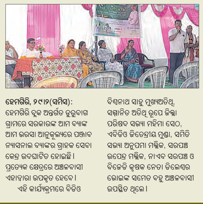
ହେମଗିରି, ୨୯/୧୨(ସମ୍ପାଦକ): ପଞ୍ଜାବ ନ୍ୟାସନାଲ ବ୍ୟାଙ୍କର ଗ୍ରାହକ ସେବାକେନ୍ଦ୍ର ଉଦ୍ଘାଟିତ ହୋଇଛି। ଏହି କାର୍ଯ୍ୟକ୍ରମରେ ପଞ୍ଜାବ ନ୍ୟାସନାଲ ବ୍ୟାଙ୍କର ଗ୍ରାହକ ସେବାକେନ୍ଦ୍ର ଉଦ୍ଘାଟିତ ହୋଇଛି।