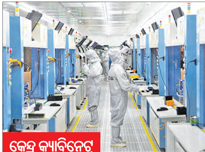
କେନ୍ଦ୍ର କ୍ୟାବିନେଟ୍ ଦେଲା ମଞ୍ଜୁରୀ ସୃଷ୍ଟି ହେବ ୮୦ ହଜାରରୁ ଅଧିକ ନିଯୁକ୍ତି

ଦୁଆବିଲ୍ଲା, ୨୯ ମାର୍ଚ୍ଚ (ଏକେନ୍ସି) - ପ୍ରଧାନମନ୍ତ୍ରୀ ନରେନ୍ଦ୍ର ମୋଦୀଙ୍କ ଅଧିକାରୀଙ୍କ ଦ୍ୱାରା ପ୍ରତିଷ୍ଠା ହେବ ତିନି ସେମିକଣ୍ଡକୁ ପ୍ଲାଣ୍ଟ। ଡିଡିପି ଅଭିବୃଦ୍ଧି ହାର ୮.୫ ପ୍ରତିଶତ ରହିଥିଲା। ବିନିମୟ ଟଙ୍କା ଏବଂ ଖର୍ଚ୍ଚ କ୍ଷେତ୍ରରେ ଉତ୍ତମ ପ୍ରଦର୍ଶନ ଅଭିବୃଦ୍ଧିକୁ ବଳ ଦେଇଛି।