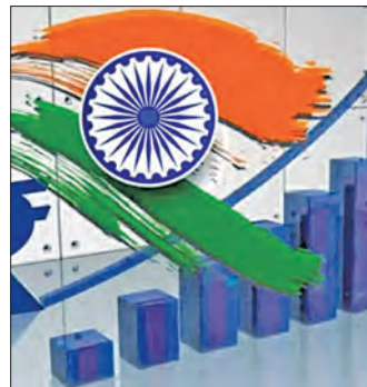
ଡିଡିପି ଅଭିବୃଦ୍ଧିରେ ଡିଡିପି ଅଭିବୃଦ୍ଧି ୮.୪% ବିନିମୟ, ଖର୍ଚ୍ଚ କ୍ଷେତ୍ରରେ ଉତ୍ତମ ପ୍ରଦର୍ଶନ

ଦୁଆବିଲ୍ଲା, ୨୯ ମାର୍ଚ୍ଚ (ଏକେନ୍ସି) - ଦୌଡୁଛି ଭାରତୀୟ ଅର୍ଥନୀତି। ଚଳିତ ଅର୍ଥନୀତିକ ବର୍ଷରେ ଅନୁମୋଦିତ ଡିଡିପି ଅଭିବୃଦ୍ଧି ହାର ୮.୪% ପ୍ରତିଶତ ରହିଥିଲା। ବିନିମୟ ଟଙ୍କା ଏବଂ ଖର୍ଚ୍ଚ କ୍ଷେତ୍ରରେ ଉତ୍ତମ ପ୍ରଦର୍ଶନ ଅଭିବୃଦ୍ଧିକୁ ବଳ ଦେଇଛି। ପ୍ରକାଶିତ ତଥ୍ୟ ଅନୁଯାୟୀ, ଅନୁମୋଦିତ ଡିଡିପି ଅଭିବୃଦ୍ଧି ହାର ୨୦୨୨-୨୩ର ଡିଡିପି ଅଭିବୃଦ୍ଧି ହାର ୮.୪% ପ୍ରତିଶତ ରହିଥିଲା। ବିନିମୟ ଟଙ୍କା ଏବଂ ଖର୍ଚ୍ଚ କ୍ଷେତ୍ରରେ ଉତ୍ତମ ପ୍ରଦର୍ଶନ ଅଭିବୃଦ୍ଧିକୁ ବଳ ଦେଇଛି।