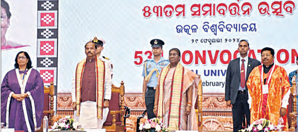
୩ ଜଣଙ୍କୁ ସମ୍ମାନସୂଚକ ଡି.ଲିଟ୍, ୧୬୬ଜଣଙ୍କୁ ପିଏଚ୍ଡି ଡିଗ୍ରୀ, ୯୫୫ ଶ୍ରେଣୀପଦକ

■ ଭୁବନେଶ୍ୱର, ୨୯/୩ (ସମ୍ପାଦ): ଉତ୍କଳ ବିଶ୍ୱବିଦ୍ୟାଳୟର ୫୩ତମ ସମାବର୍ତ୍ତନ ଉତ୍ସବ ଓଡ଼ିଶା ରୁହେଁ, ସମଗ୍ର ଭାରତବର୍ଷରେ ଶିକ୍ଷା କ୍ଷେତ୍ରରେ ନିଜର ସ୍ୱତନ୍ତ୍ର ପରିଚୟ ସୃଷ୍ଟି କରିପାରିଛି ଏହି ବିଶ୍ୱବିଦ୍ୟାଳୟ। କ୍ୟାମ୍ପସ୍, ପରିବେଶ ଓ ଶିକ୍ଷାଦାନ ପରମ୍ପରା ଦୃଷ୍ଟିରୁ ଏହା ଦେଶର ଏକ ଅଗ୍ରଣୀ ବିଶ୍ୱବିଦ୍ୟାଳୟ ବୋଲି ଉତ୍କଳ ବିଶ୍ୱବିଦ୍ୟାଳୟ ଦାୟାନ୍ତ ଭବନରେ