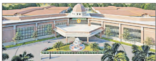
ସୋନପୁରରେ ପ୍ରତିଷ୍ଠା ହେବ ଅର୍ଥନୀତିକ ଉତ୍ପାଦନ କ୍ଷେତ୍ରରେ ଉତ୍ତମ ପ୍ରଦର୍ଶନ

ଭୁବନେଶ୍ୱର, ୨୯ ମାର୍ଚ୍ଚ (ଏକେନ୍ସି) - ଅରୁଣ୍ଡତା ଗ୍ରାମର ବଡ଼ ପ୍ରତିଷ୍ଠା ଚଳିତ ଅର୍ଥନୀତିକ ବର୍ଷରେ ସଫଳ ହେବ ବୋଲି ଆଶା କରାଯାଇଛି। ଡିଡିପି ଅଭିବୃଦ୍ଧି ହାର ୮.୫ ପ୍ରତିଶତ ରହିଥିଲା। ବିନିମୟ ଟଙ୍କା ଏବଂ ଖର୍ଚ୍ଚ କ୍ଷେତ୍ରରେ ଉତ୍ତମ ପ୍ରଦର୍ଶନ ଅଭିବୃଦ୍ଧିକୁ ବଳ ଦେଇଛି।