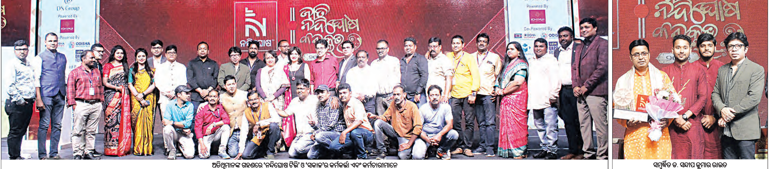
ଅତିଥିମାନଙ୍କ ଉତ୍ସବରେ 'ନବିନିଆସ ଟିଭି' ଓ 'ସକାଳ'ର କର୍ମଚାରୀ ଏବଂ କର୍ମଚାରୀମାନେ