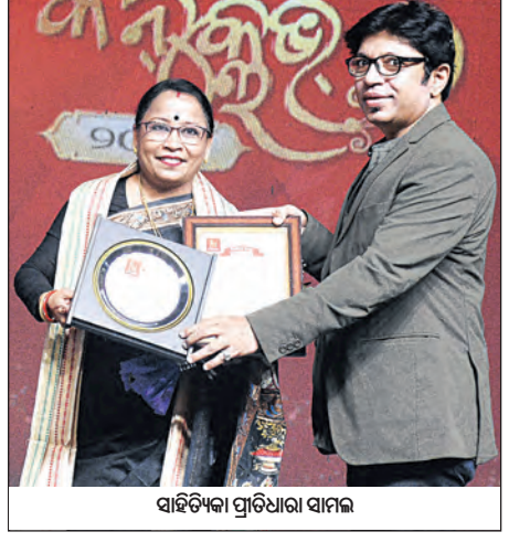
ସାହିତ୍ୟିକା ପ୍ରାରିଧାତା ସାମଲ