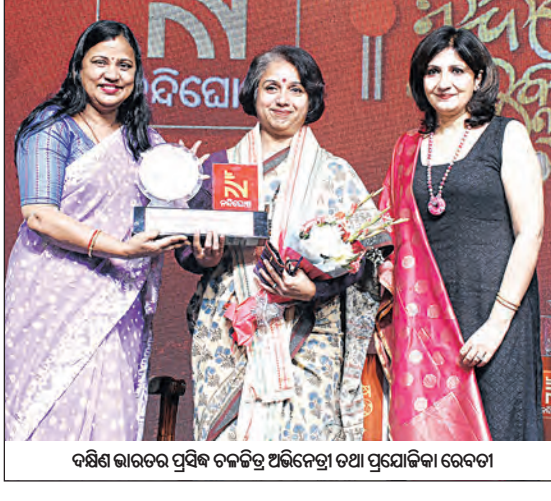
ଦକ୍ଷିଣ ଭାରତର ପ୍ରସିଦ୍ଧ ଚଳଚ୍ଚିତ୍ର ଅଭିନେତ୍ରୀ ତଥା ପ୍ରଯୋଜିକା ରେବତୀ