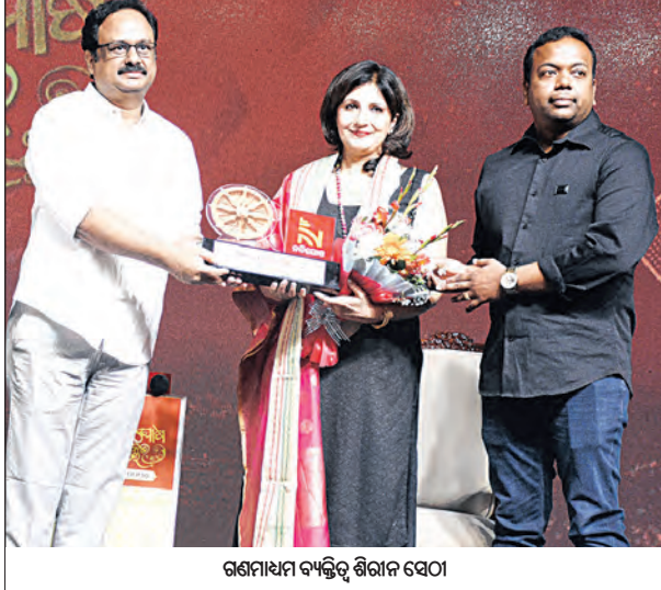
ଗଣମାଧ୍ୟମ ବ୍ୟକ୍ତିଗଣ ଶିରାନ ସେଠା