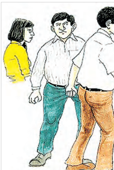
ଅଧ୍ୟକ୍ଷଙ୍କୁ ନ ଜଣାଇବାକୁ ଧମକ ଦେଉଥିଲେ। ସେହିପରି ଭୁବନେଶ୍ୱରସ୍ଥିତ ଏକ ନେତୃତ୍ୱ ଚାକ୍ରୀର ମହାବିଦ୍ୟାଳୟରୁ ଦୁଇଜଣ ପିଲି ଛାତ୍ରୀ ରାଷ୍ଟ୍ରଟିର ଶିକାର ହୋଇ ଆତ୍ମହତ୍ୟା ଉଦ୍ୟମ କରୁଥିବା ପ୍ରାଧ୍ୟାପକଙ୍କ ମାତୃଧ୍ୟୁକ ନିର୍ଦାତନ ସହିତ ପାରିବାରୁ ସେମାନେ ଏପରି ପଦକ୍ଷେପ ନେଇଥିବା ଏକ ଚିଠିରେ ଉଲ୍ଲେଖ କରିଥିଲେ। ରାଜଧାନୀରେ ରାଷ୍ଟ୍ରଟିକୁ ନେଇ ଜଣେ ଯୁକ୍ତିତମ ଛାତ୍ରୀ ଓ ଅନ୍ୟ ଜଣେ ଏମ୍ପିଏ ଛାତ୍ରୀ ଆତ୍ମହତ୍ୟା କରିବା ଘଟଣା ଚର୍ଚ୍ଚାରେ ରହିଥିବା ବେଳେ ଦୁଇ ତାନ୍ତ୍ରୀ ପିଲି ଛାତ୍ରୀ ଏଭଳି ପଦକ୍ଷେପ ନେବା ଅତ୍ୟନ୍ତ ପରିଚାଳନା ବିଷୟ ଗତ ଅକ୍ଟୋବର ୮ ତାରିଖରେ ରାଜଧାନୀରେ ଏକ ପ୍ରତିଷ୍ଠିତ ଶିକ୍ଷାନୁଷ୍ଠାନରେ ରାଷ୍ଟ୍ରଟି ହେଉଥିବା ଅଭିଯୋଗ ଆସିଥିଲା। ଛାତ୍ରୀଦ୍ୱୟରେ ବରିଷ୍ଠ ଛାତ୍ରମାନେ କନିଷ୍ଠ ଛାତ୍ରମାନଙ୍କୁ ନିଷ୍ପଳ ମାଡ଼ମାରି ଲହୁଲହୁଣ୍ଡା କରିଦେଇଥିଲେ। ତୃତୀୟ ବର୍ଷର କିଛି ଛାତ୍ର ରାତି ୧୧ଟା ସମୟରେ ତିନିଜଣ କନିଷ୍ଠ ଛାତ୍ରକୁ ଡାକି ଦୁଇଘଣ୍ଟା ଧରି ରାଷ୍ଟ୍ରଟି କରିବା ପରେ କନିଷ୍ଠ ଛାତ୍ରମାନେ ମୁକ୍ତୁଲିଥିଲେ। ଏହାପରେ ପୁନର୍ବାର ସେହି ତିନିଜଣ ଛାତ୍ରକୁ ଡାକି ଲୁହା ରଡ଼ରେ

ଅଭିଯୋଗ ସାମ୍ନାକୁ ଆସିଥିଲା। ରାଷ୍ଟ୍ରଟିର ଶିକାର ଛାତ୍ରୀ ଜଣକ ଏ ନେଇ ଆଶ୍ଚର୍ଯ୍ୟାକ୍ତ ହୋଇ ଯୋଗେ ଜଣାଇଥିଲେ। ଅପରପକ୍ଷରେ ଘଟଣାକୁ ଚପାଇ ଦେବାକୁ ପ୍ରଶିକ୍ଷଣ କେନ୍ଦ୍ରର କର୍ତ୍ତୃପକ୍ଷ ସମ୍ପୂର୍ଣ୍ଣ ଛାତ୍ରୀଙ୍କୁ ବୁଝାଇବା ପାଇଁ ବାଧ୍ୟ କରୁଥିବା ବେଳେ ଛାତ୍ରୀ ଜଣକ କିନ୍ତୁ କାର୍ଯ୍ୟାନୁଷ୍ଠାନ ଦାବିରେ ନିଜ ଜିଦରେ ଅଟକ ଥିଲେ। ପାଠ୍ୟକ୍ରମ ଅଭିଯୋଗ ଅନୁସାରେ ତାଲିମ କେନ୍ଦ୍ରରେ ନାମ ଲେଖାଇବା ପରଠାରୁ ପ୍ରାୟ ୩ ମାସ ହେଲା ବରିଷ୍ଠ ଛାତ୍ରୀମାନଙ୍କ ଦ୍ୱାରା ରାଷ୍ଟ୍ରଟିର ଶିକାର ହୋଇ ଆସୁଥିଲେ। କେତେକ ବରିଷ୍ଠ ଛାତ୍ରୀ ବିଭିନ୍ନ ସମୟରେ ବୈଠକ କରି ତାଙ୍କୁ ଶାରୀରିକ ଓ ମାନସିକ ନିର୍ଦାତନ ଦେବା ସହ ଅଶ୍ୱାସ୍ୟ ଭାଷାରେ ଗାଳିଗୁଳାଳ କରୁଥିବା ସେ ଅଭିଯୋଗ କରୁଥିଲେ। ନିର୍ଦାତନା ବିଷୟରେ ଅଭିଭାବକ କିମ୍ବା ତାଲିମ କେନ୍ଦ୍ର