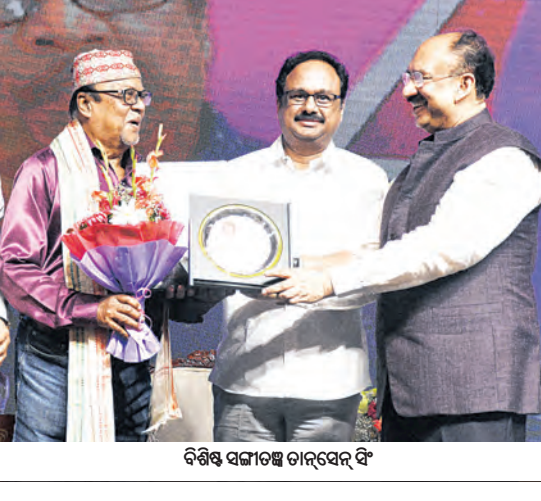
ବିଶିଷ୍ଟ ସଙ୍ଗୀତଜ୍ଞ ଚାନ୍ଦସେନ୍ ସିଂ