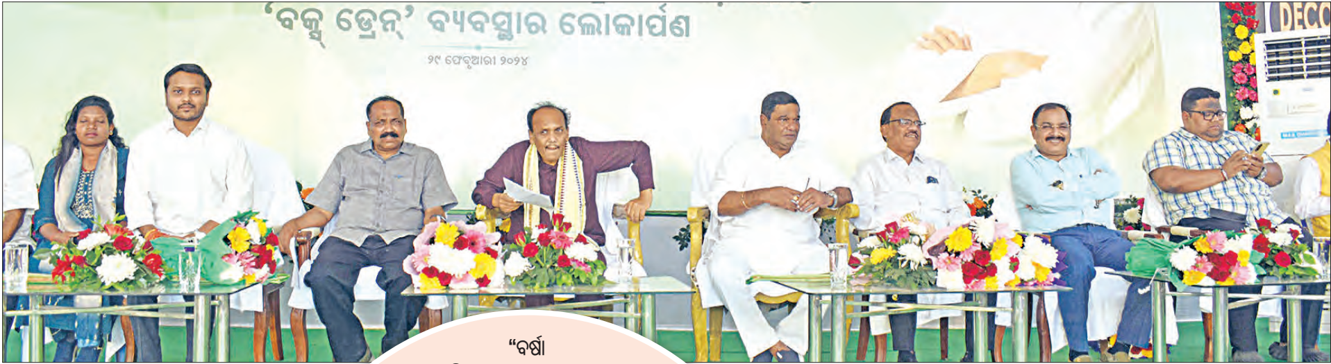
'ବକ୍ସ ଡ୍ରେନ୍' ବ୍ୟବସ୍ଥାର ଲୋକାର୍ପଣ ୨୯ ଫେବୃଆରୀ ୨୦୨୪