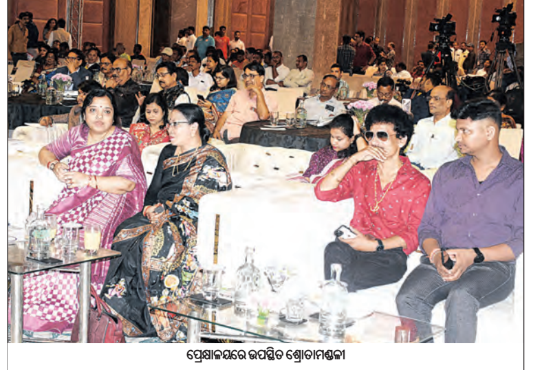
ପ୍ରୋକ୍ସରରେ ଉପସ୍ଥିତ ଶ୍ରେଣୀମଣ୍ଡଳୀ