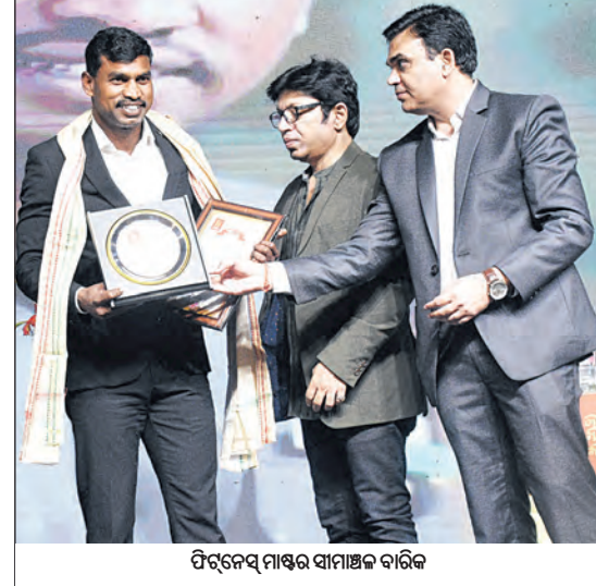
ପିନ୍ଧେସ୍ ମାଷ୍ଟର ସାମାଜିକ ବାରିକ