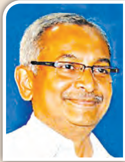
ପ୍ରତାରକଙ୍କୁ ଶରତ ପ୍ରହାର

ପ୍ର ଶାସକରୁ ରାଜନୀତିରେ ପ୍ରବେଶ କରିଥିବା ମାଷ୍ଟରକ୍ୟାଣ୍ଟିନ ହାତ ମଠ ପ୍ରତାରକ ବିଜୟଙ୍କ ସମୟ ପ୍ରକୃତରେ କୁଆଡ଼େ ଠିକ୍ ଚାଲିନାହିଁ। ଯିଏ ହାତ ମଠକୁ ଆସୁଛି, ସିଏ ପଟ୍ଟନାୟକଙ୍କୁ ମନ୍ଦିର ଘଣ୍ଟା ପରି ଢ଼ଢ଼ କରି ପିଟି ଦେଇ ଯାଉଛି। ମାତ୍ର କୌତୂହଳର କଥା ହେଉଛି, ମନ୍ଦିର ଘଣ୍ଟାକୁ ପିଟିଲେ ଯେପରି ଶବ୍ଦ ବାହାରେ; ବିଜୟଙ୍କୁ ପିଟିଲେ କୌଣସି ଶବ୍ଦ ବାହାରୁ ନାହିଁ। ବାବୁଗିରି କରୁକରୁ ବିଜୟ ବେଦାନ୍ତ ଆଡ଼େ ମାଡ଼ିଗଲେ, ସେଠି କିଛି କାଳ ଗୁମାସ୍ତାଗିରି କରିବା ପରେ ନେତା ହେବା ନିଶାରେ ଏକ କୃଷକ ସଙ୍ଗଠନର ପୃଷ୍ଠପୋଷକ ସାଜିଲେ; ତା ପରେ ହାତ ଦଳରେ ପ୍ରବେଶ କରି ଏବେ ରାଜ୍ୟ ପ୍ରତାରକ। ନିକଟରେ ଅନୁଷ୍ଠିତ ଦଳର ଏକ ଗୁରୁତ୍ୱପୂର୍ଣ୍ଣ ବୈଠକରେ ଯାଜପୁର ଜିଲ୍ଲାର ପୁରୁଖା ନେତା ତଥା ପୂର୍ବତନ ମନ୍ତ୍ରୀ