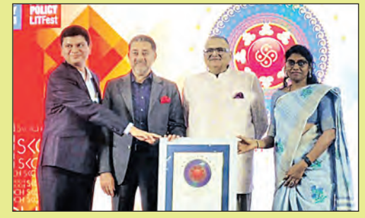
ପୂର୍ବରୁ ୨୦୧୯ ମସିହାରେ ବିଷୟକେଖାଇକୁ ନ୍ୟାସନାଲ୍ ସ୍କର୍-ଗୋଲଡ୍ ଆଝର୍ଡ ମିଳିଥିଲା।

ସର୍ବସାଧାରଣଙ୍କୁ ବିନା ମୂଲ୍ୟରେ ଗୁଣାମୂଳ ସ୍ୱାସ୍ଥ୍ୟ ସେବା ପ୍ରଦାନ କରୁଥିବା ରାଜ୍ୟ ସରକାରଙ୍କର ବିଷୟକେଖାଇ ଯୋଜନାକୁ ପୁଣି ଥରେ ମିଳିଛି ଜାତୀୟ ସ୍ୱାକୃତି। ଗତ ସପ୍ତାହରେ ନୂଆଦିଲ୍ଲୀରେ ଅନୁଷ୍ଠିତ ସ୍ୱତନ୍ତ୍ର କାର୍ଯ୍ୟକ୍ରମରେ ବିଷୟକେଖାଇକୁ ନ୍ୟାସନାଲ୍ ସ୍କର୍ ଆଝର୍ଡ-ଗୋଲଡ୍ ପୁରସ୍କାରରେ ସମ୍ମାନିତ କରାଯାଇଛି। ସ୍ୱାସ୍ଥ୍ୟ ସେବା କ୍ଷେତ୍ରରେ ନବସୃଜନ, ସାର୍ବଜନୀନତା, ଉଲ୍ଲେଖନୀୟ ସଫଳତା ଓ ସ୍ୱଚ୍ଛତା ମାନକ ଆଧାରରେ ଏହି ସମ୍ମାନ ମିଳିଛି। ଏହା