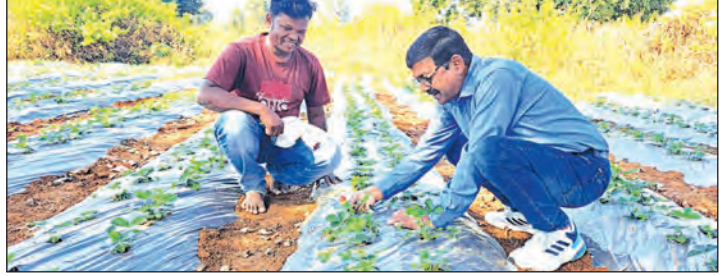
ରାଜ୍ୟ ଓ ରାଜ୍ୟ ବାହାରେ ଚାଷକାରୀଙ୍କୁ ଦୁଆପତ୍ତାରେ ସୁବେରା