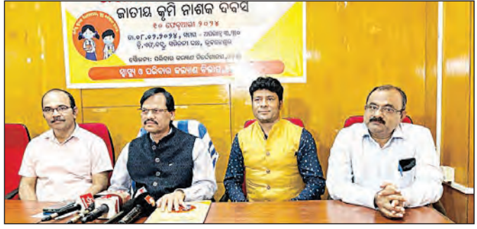
ହିତାଧିକାରୀମାନେ ଫେବୃଆରୀ ୧୧ରେ ଏକ ମତ୍-ଅପ୍ ରାଉଣ୍ଡରେ ଔଷଧ ଖାଇବେ। ଏହାବ୍ୟତୀତ ରୁଚି-ଲକ୍ଷ୍ୟମାନଙ୍କର ସହାୟତା ପାଇଁ ୧୦୦ ମାସ ବୟସର ପିଲାମାନେ ଭିଟାମିନ-ଏ ପାଇବେ। ସମାନ ସମୟ ଅବଧିରେ ସ୍ୱଚ୍ଛ ଗ୍ରାମ ସ୍ୱାସ୍ଥ୍ୟ ପରିମଳ ଏବଂ ପୃଷ୍ଠିକର