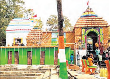
ପ୍ରଚାରିତ ହେଉଥିବା ବେଳେ ପ୍ରାକୃତିକ ସବୁଜିମା ଭରା ପାହାଡ଼ର ନୈସର୍ଗିକ ଶୋଭା ସହିତ ଭଗବାନ

ଓଡ଼ିଶାର ଅନ୍ୟତମ ଶୈବପୀଠ ଭାବେ ଖ୍ୟାତି ଅର୍ଜନ କରିଥିବା ନୟାଗଡ଼ ଜିଲ୍ଲା ଓଡ଼ିଶା ବ୍ଲକ ଅନ୍ତର୍ଗତ କାମୁପାଟଣା ମୌଳିକ ଶୁକ୍ଳିଆ ପାହାଡ଼ ପାଦଦେଶରେ ଅବସ୍ଥିତ ବାବା ଦୁର୍ଗୁଣମୟ ମହାଦେବ ଓ ମା' ପାର୍ବତୀଙ୍କ ମନ୍ଦିର ରୂପାନ୍ତରଣ ହେବ ବୋଲି ଜଣାପଡ଼ିଛି।