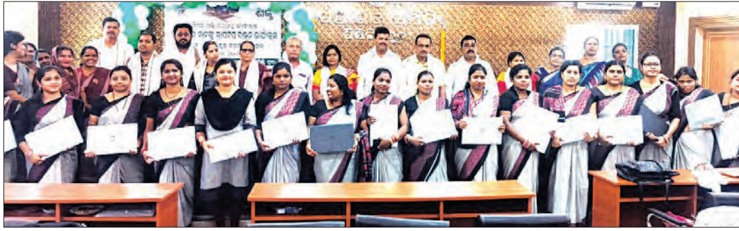
ବ୍ୟାଙ୍କ ମିତ୍ରଙ୍କୁ ମାଧ୍ୟମରେ ଆଜି ପ୍ରତ୍ୟେକ ମହିଳା ବ୍ୟାଙ୍କରୁ ସହକରେ ରଖି ପାଇ ନିଜ ପରିବାର ଆର୍ଥିକ ସ୍ଥିତି ସୁଧାର କରିପାରିଛନ୍ତି