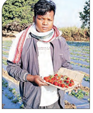
ସୁଆପତ୍ର, ୮୨ (ସମ୍ପାଦକ):

ଭୁବନେଶ୍ୱର, ୮୨ (ସମ୍ପାଦକ): ଚିଟ୍‌ପଣ୍ଡ ସଂସ୍ଥା ଗୋଲଡେନ୍ ଲ୍ୟାଣ୍ଡ ଡେଭଲପମେଣ୍ଟ ଲିମିଟେଡ୍‌ର ୯୦୦ କୋଟି ଠକେଇ ମାମଲାରେ ପ୍ରବର୍ତ୍ତନ ନିର୍ଦ୍ଦେଶକ (ଇଡି) ପକ୍ଷରୁ ଖୋଜାଡ଼ା ଆରମ୍ଭ ହୋଇଛି। ଶୁକ୍ରବାର ଓଡ଼ିଶା ସମେତ ଦିଲ୍ଲୀ ଓ ଚଣ୍ଡିଗଡ଼ରେ ୨୦ଟି ସ୍ଥାନରେ ଭିଜିଲାନୁ ଚଢ଼ଉ କରାଯାଇଛି। ଓଡ଼ିଶାର ଭୁବନେଶ୍ୱର, ବ୍ରହ୍ମପୁର, ଦିଗପହଣ୍ଡିର ୧୦ଟି ସ୍ଥାନରେ ଏକାସାଥୀରେ ପ୍ରବର୍ତ୍ତନ ନିର୍ଦ୍ଦେଶକଙ୍କର ଅଧିକାରୀମାନେ ଚଢ଼ଉ କରିଛନ୍ତି। ଏହି ସଂସ୍ଥା ନିର୍ଦ୍ଦେଶକଙ୍କଠାରୁ ୯୦୦ କୋଟି ଟଙ୍କା ଆଦାୟ କରିଥିଲା। ମୋଟ ୬୦୦ କୋଟିର ଯୋଗ୍ୟ ନେଇ ବିଭିନ୍ନ ଚକ୍ରସିଲ କରୁଥିଲା। ଏଥିରେ ସମ୍ପୂର୍ଣ୍ଣ ରହିଥିବା ସଂସ୍ଥାର କିଛି ଅଧିକାରୀ ଓ କର୍ମଚାରୀଙ୍କୁ ଗିରଫ କରାଯାଇଥିଲା। ପରେ ସଂସ୍ଥାର କିଛି ସ୍ଥାନର ଓ ଅସ୍ଥାବର ସମ୍ପତ୍ତି ବି ଜବତ ହୋଇଥିଲା। ଦିଲ୍ଲୀର ଏହି କମ୍ପାନୀ ବିରୋଧରେ ନିକଟରେ ବିଭିନ୍ନ ଚାକିରି ବିବାଦ ଚଳୁଥିଲା। କୋର୍ଟରେ ଚାକିରି ବିବାଦ ହେବା ପରେ ସଂସ୍ଥା ବିରୋଧରେ ଭିଜିଲାନୁ ଆଜି ପ୍ରଥମ ଚଢ଼ଉ କରାଯାଇଛି। ଏହି ସଂସ୍ଥାର ଲିକ୍‌ରେ ଓଡ଼ିଶାରେ ବି ଚଢ଼ଉ କରାଯାଇଛି। ଭୁବନେଶ୍ୱର ରଙ୍ଗବଜାରଠାରେ ମଧ୍ୟ ସଂସ୍ଥାର ଏକ କାର୍ଯ୍ୟାଳୟରେ ଚଢ଼ଉ କରାଯାଇଛି। ବେଙ୍ଗାଲୁରୁକୁ ଆସିଥିବା ଭିଜିଲାନୁ ୬ ଜଣିଆ ଟିମ୍ ତନାପନା କରିଥିଲେ। ଓଡ଼ିଶାର ବିଭିନ୍ନ ସ୍ଥାନରେ ବହୁ ଗୁରୁତ୍ୱପୂର୍ଣ୍ଣ କାରକପତ୍ର ଜବତ କରିଛି ଭିଜିଲାନୁ। ଏହି ଚଢ଼ଉ ଜାରି ରହିଥିବା ବେଳେ କେନ୍ଦ୍ରୀୟ ସୁରକ୍ଷା ବଳ ସୁରକ୍ଷା ଯୋଗାଣ କରିଛି।