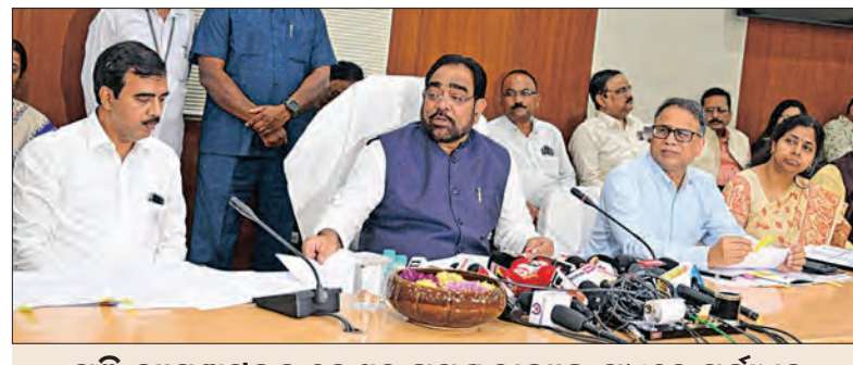
ପୁଞ୍ଜି ବ୍ୟୟ ଅଟକଳ ଦେଶର ପ୍ରମୁଖ ରାଜ୍ୟ ମଧ୍ୟରେ ସର୍ବାଧିକ ଜାତୀୟ ହାରଠାରୁ ରାଜ୍ୟର ଅଭିବୃଦ୍ଧି ହାର ଅଧିକ ଖୋଲା ବଜାରରୁ ଉଠିବ ୧୨,୩୦୦ କୋଟି ରଶ