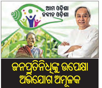
ଜନପ୍ରତିନିଧିଙ୍କୁ ଉପେକ୍ଷା ଅଭିଯୋଗ ଅମୂଳକ