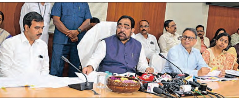
ପୁଞ୍ଜି ବ୍ୟୟ ଅଟକଳ ଦେଶର ପ୍ରମୁଖ ରାଜ୍ୟ ମଧ୍ୟରେ ସର୍ବାଧିକ ଜାତୀୟ ହାରଠାରୁ ରାଜ୍ୟର ଅଭିବୃଦ୍ଧି ହାର ଅଧିକ ଖୋଲା ବଜାରରୁ ଉଠିବ ୧୨,୩୦୦ କୋଟି ରଣ