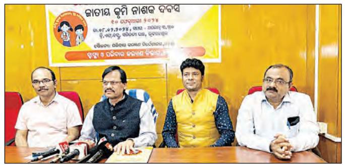
ହିତାଧିକାରୀମାନେ ଫେବୃଆରୀ ୧୨ରେ ଏକ ମତ୍-ଅପ୍ ରାଉଣ୍ଡରେ ଔଷଧ ଖାଇବେ। ଏହାବ୍ୟତୀତ ରୁଚି-ଇମ୍ୟୁନାଇଜେସନ୍ ସାଙ୍ଗରେ ୧୯ ରୁ ୨୦ ମାସ ବୟସର ପିଲାମାନେ ଭିଟାମିନ-ଏ ପାଇବେ। ସମାନ ସମୟ ଅବଧିରେ ଶ୍ଵେତ ଗ୍ରାମ ସ୍ଵାସ୍ଥ୍ୟ ପରିମଳ ଏବଂ ପୂଷିକର