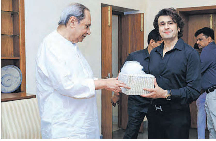
ନବୀନ ନିବାସରେ ଗୁରୁବାର ମୁଖ୍ୟମନ୍ତ୍ରୀଙ୍କୁ ଭେଟୁଛନ୍ତି ବଲିଭଦ୍ କଣ୍ଠଶିଳ୍ପୀ ତଥା ସଂଗୀତ ନିର୍ଦ୍ଦେଶକ ସୋନୁ ନିଗମ । ପାଖରେ ଅଛନ୍ତି '୫-ଟି' ଅଧ୍ୟକ୍ଷ କାର୍ତ୍ତିକ ପାଣିଆର୍