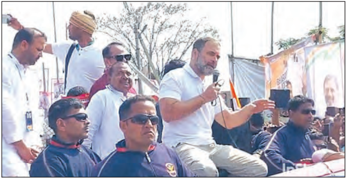
■ ପ୍ରଧାନମନ୍ତ୍ରୀ ମୋଦୀ ଓ ବିପିଏ ବର୍ଗର ନୁହେଁ ■ ଦରଦାମ୍ ବୃଦ୍ଧିରେ ସାଧାରଣ ଲୋକ ଅତିଷ୍ଠ

ନୂଆଦିଲ୍ଲୀ/ଝାରସୁଗୁଡ଼ା, ୮ (ସମ୍ପାଦକ): ଭାରତ ଯୋଡ଼ା ନ୍ୟାୟ ଯାତ୍ରାରେ ଓଡ଼ିଶା ଆସିଥିବା କଂଗ୍ରେସର ବରିଷ୍ଠ ନେତା ରାହୁଲ ଗାନ୍ଧୀ ଆଜି ଝାରସୁଗୁଡ଼ା ମାଟିରୁ କେନ୍ଦ୍ର ସରକାରକୁ ଟାଣିବେ କହିଛନ୍ତି। କେନ୍ଦ୍ର ସରକାର ତାଷାଙ୍କ ସ୍ୱାର୍ଥବିରୋଧୀ। ଏଥର କେନ୍ଦ୍ର ବଜେଟ୍‌ରେ କୃଷି କ୍ଷେତ୍ରକୁ କମ୍ ବଜେଟ୍ ଆବଶ୍ୟକତା ଏହା ଖଣ୍ଡନ ହୋଇଛି। ସେହିପରି ଅତ୍ୟାଧିକାରୀଙ୍କ ସାମାଜିକ ସୁରକ୍ଷା ପ୍ରଦାନ ପାଇଁ ଆବଶ୍ୟକ କାମ ଖୁବ୍ ଦୀର୍ଘତାରେ ହେବାରୁ ଏହା ଖଣ୍ଡନ ହୋଇଛି।