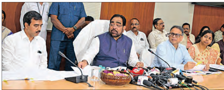
ପୁଞ୍ଜି ବ୍ୟୟ ଅଟକଳ ଦେଶର ପ୍ରମୁଖ ରାଜ୍ୟ ମଧ୍ୟରେ ସର୍ବାଧିକ ଜାତୀୟ ହାରଠାରୁ ରାଜ୍ୟର ଅଭିବୃଦ୍ଧି ହାର ଅଧିକ ଖୋଲା ବଜାରରୁ ଉଠିବ ୧୨,୩୦୦ କୋଟି ରଣ