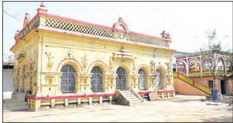
ସୋନପୁରର ପୂର୍ବପରିଚାଳନା ଗୋପାଳଙ୍କ

ସୋନପୁର, ୨୧ (ସମ୍ବାଦ): ଦୀର୍ଘ ୪୦ ବର୍ଷ ପରେ ଜଗନ୍ନାଥ ଅଧ୍ୟାୟାଳୟରେ ପୁନଃପ୍ରାରମ୍ଭ ହୋଇଛି।