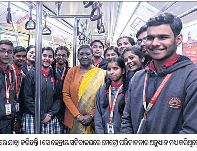
ରାଷ୍ଟ୍ରପତି ଦ୍ରୌପଦୀ ମୁର୍ମୁ ବୁଧବାର ଦିଲ୍ଲୀ ମେଟ୍ରୋରେ ଯାତ୍ରା କରିଛନ୍ତି । ସେ କେନ୍ଦ୍ରୀୟ ସଚିବାଳୟରେ ମେଟ୍ରୋ ପରିଚାଳନାର ଅନୁଧ୍ୟାନ ମଧ୍ୟ କରିଥିଲେ