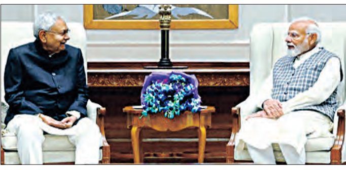
୨୦୨୪ ନିର୍ବାଚନ ପାଖେଇ ଆସୁଥିବା ବେଳେ ଜାତୀୟ ରାଜନୀତି ରୂପରେଖ ବଦଳିବାରେ ଲାଗିଛି । ନିକଟରେ କେନ୍ଦ୍ରୀୟ ସୁପ୍ରିମୋ ଚଥା ବିହାର ମୁଖ୍ୟମନ୍ତ୍ରୀ ଏନଡିଏରେ ସାମିଲ ହେବା ପରେ ବିହାର ରାଜନୀତିରେ ପରିବର୍ତ୍ତନ ସହିତ ଏହାର ପ୍ରଭାବ ଜାତୀୟ ରାଜନୀତି ଉପରେ ମଧ୍ୟ ଅନୁଭୂତ ହୋଇଛି । ବିରୋଧୀ ମେଣ୍ଟ

ନୂଆଦିଲ୍ଲୀରେ ପ୍ରଧାନମନ୍ତ୍ରୀ ନରେନ୍ଦ୍ର ମୋଦୀଙ୍କୁ ଭେଟି ବିଭିନ୍ନ ପ୍ରସଙ୍ଗରେ ଆଲୋଚନା କରିଛନ୍ତି । ଆସନ୍ତା ୧୨ ଟାରିଖରେ ବିଧାନସଭାରେ