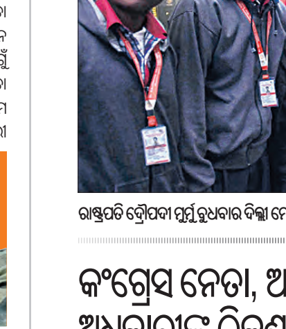
ନେତା ବାମପଟା-ଦକ୍ଷିଣପଟା ନୁହଁନ୍ତି; ବର୍ଷା ସୁବିଧାବାଦୀ ଏଭଳି ଲୋକ କେବଳ କ୍ଷମତାସୀନ ଦଳ ସହ ମିଶିବାକୁ ଚାହାନ୍ତି

ଗଡ଼କରୀଙ୍କ ସୂଚନା ଅନୁଯାୟୀ ନେତା ଆସନ୍ତା ଆର ଯାଆନ୍ତି । କିନ୍ତୁ ନିଜ ନିର୍ବାଚନ କ୍ଷେତ୍ରରେ ଲୋକଙ୍କ ପାଇଁ କରିଥିବା କାମ ଯୋଗୁଁ ତାଙ୍କୁ ସମ୍ମାନ ମିଳିଥାଏ । ପ୍ରଚାର ଏବଂ ଜନପ୍ରିୟତା ଜରୁରୀ, କିନ୍ତୁ ନିଜ କ୍ଷେତ୍ରରେ କରିଥିବା କାମ ସଫଳରେ ଦେଇଥିବା ମନ୍ତ୍ରୀଙ୍କୁ ଧିକାର କରୁଛନ୍ତି ।