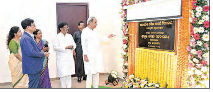
ତାରିଖ ଗୁରୁଦିନ ସ୍ୱରୂପ ଅବସରରେ ମୁଖ୍ୟମନ୍ତ୍ରୀ ଏହାର ଭିତ୍ତି ସ୍ଥାପନ କରିଥିଲେ। ଉଦ୍‌ଘାଟିତ ହୋଇଥିବା ୨୫ ଏକର ପରିମିତ ନୂତନ କ୍ୟାମ୍ପସରେ ସି-ଏସ୍‌ସି ଦଶମ ଶ୍ରେଣୀ ବୋର୍ଡ଼ ପରୀକ୍ଷାରେ ଉତ୍କର୍ଷ ହାସଲ କରିଥିବା ପ୍ରଦାନ ପାଇଁ ରାଜ୍ୟ ପ୍ରତ୍ୟେକ ସ୍କୁଲରେ

ଡ଼ିପ୍‌ଟୋରୀ ଏବଂ ପାର୍କିଂ ଓ ବରିବା ଇତ୍ୟାଦିର ବ୍ୟବସ୍ଥା କରାଯାଇଛି। ଏହାର ନିର୍ମାଣ ପାଇଁ ୧୦୦ କୋଟିରୁ ଊର୍ଦ୍ଧ୍ୱ ଟଙ୍କା ଖର୍ଚ୍ଚ ହୋଇଛି। ଗ୍ରାମାଞ୍ଚଳର ମେଧାବୀ ଛାତ୍ରଛାତ୍ରୀମାନଙ୍କୁ ବୋର୍ଡ଼ ପରୀକ୍ଷାରେ ଉତ୍କର୍ଷ ହାସଲ କରିଥିବା ପ୍ରଦାନ ପାଇଁ ରାଜ୍ୟ ପ୍ରତ୍ୟେକ ସ୍କୁଲରେ