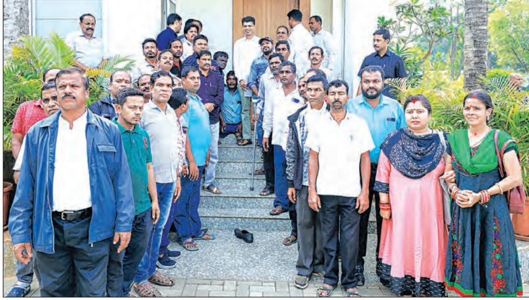
ନବୀନ ନିବାସରେ ବିଭିନ୍ନ ସଂଗଠନର କର୍ମକର୍ମୀମାନେ '୫-ଟି' ଓ 'ନବୀନ ଓଡ଼ିଶା' ଅଧ୍ୟକ୍ଷ କାର୍ଯ୍ୟକ୍ରମ ପାଇଁ ଆନୁଷ୍ଠାନିକ ଭାବେ ଶୁଭେଚ୍ଛା ଜଣାଇଛନ୍ତି