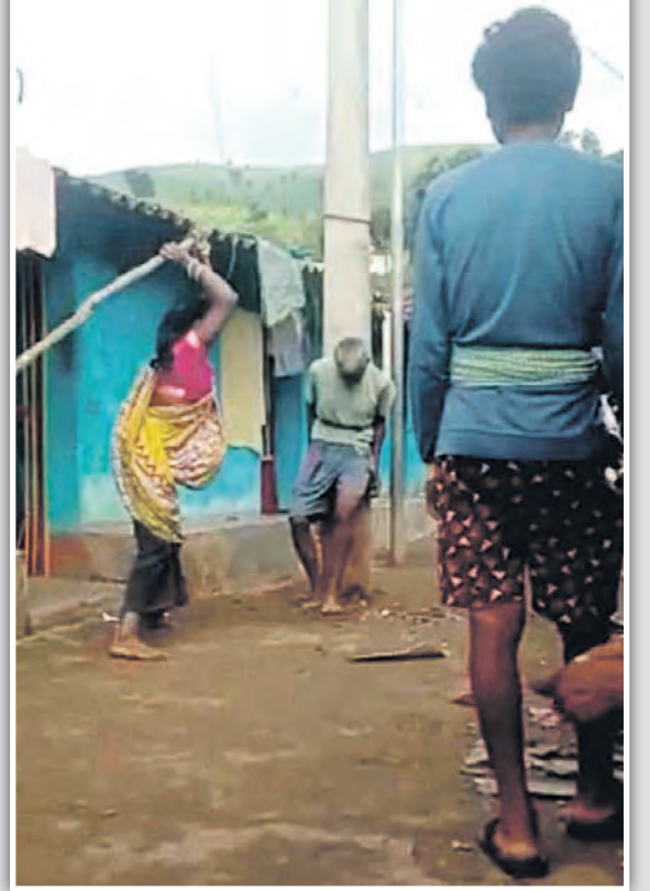
ବୋହୂକୁ ଗାଳି କରିବାରୁ ବୋହୂ ଫାଗା ସମ୍ପର୍କୀୟ ଦିଅର ଓ ଦାଦା ଶୁଣୁର ସହ ମିଶି ଖୁଣ୍ଟରେ ବନ୍ଧା ହୋଇଥିବା ଶୁଣୁର କୃଷକୁ ସର୍ବସମ୍ପୂର୍ଣ୍ଣରେ ଠେଙ୍ଗାରେ ପିଟିପିଟି ରକ୍ତାକ୍ତ କରିଦେଇଥିଲେ । କିଛି ସମୟ ପରେ କୃଷର ମୃତ୍ୟୁ ହୋଇ ଯିବାରୁ ପରିବାର ଲୋକେ ଘଟଣା ସମ୍ପର୍କରେ ପୁଲିସ୍‌କୁ ନ ଜଣାଇ ମୃତଦେହ ପୋଡ଼ି ଦେଇଥିଲେ ।

କ୍ରେଧ ମଣିଷକୁ ଅମଣିଷ କରିଦିଏ । ନିରନ୍ତର ହରାଇ କ୍ରୋଧରେ ମଣିଷ କ'ଣ କରିବି ସେ ନିଜେ ବୁଝି ପାରେନି । ବୁଝିବା ବେଳକୁ ଆଉ କିଛି ବାକି ନ ଥାଏ । ଏଭଳି କି କ୍ରୋଧାନ୍ୱିତ ଅବସ୍ଥାରେ ଜଣେ ନିର୍ମମ ହତ୍ୟା ମଧ୍ୟ କରିପାରେ । ଏଭଳି ଏକ ଘଟଣା ଦେଖିବାକୁ ମିଳିଛି କୋରାପୁଟ ଜିଲ୍ଲା ଲକ୍ଷ୍ମୀପୁର ବ୍ଲକ ଉପର କୁଟିଙ୍ଗା ଗ୍ରାମରେ । ନିଶାସକ୍ତ ଅବସ୍ଥାରେ ଶୁଣୁର ବୋହୂକୁ ଅଶାଳୀନ ଭାଷାରେ ଗାଳି ଦେବାରୁ ବୋହୂ ଉତ୍ତ୍ୟକ୍ତ ହୋଇ ପରିବାରର ଅନ୍ୟ ସଦସ୍ୟମାନଙ୍କ ସହ ମିଶି ଶୁଣୁରକୁ ନିର୍ମମ ଭାବେ ପିଟିପିଟି ମାରିଦେଇଥିଲା । ଉପର କୁଟିଙ୍ଗା ଗ୍ରାମରେ ଏକ ଛୋଟ ଘଟଣାକୁ ନେଇ ସ୍ତ୍ରୀ ଓ ଅନ୍ୟମାନଙ୍କ ସହ ମିଶି ବୋହୂ ନିଜ ଶୁଣୁରକୁ ଗାଁ ଦାଣ୍ଡରେ ଏକ ବିଦ୍ୟୁତ୍ ଖୁଣ୍ଟରେ ବାନ୍ଧି ପିଟିପିଟି ମାରି ଦେବା ଘଟଣା ଚର୍ଚ୍ଚାର କେନ୍ଦ୍ରବିନ୍ଦୁ ସାଜିଥିଲା । ପୁଲିସ୍ ସୂଚନା ଅନୁଯାୟୀ ୨୦୨୨ ଅଗଷ୍ଟ ୬ ତାରିଖର ଘଟଣା । କୋରାପୁଟ ଜିଲ୍ଲା ଉପର କୁଟିଙ୍ଗା ଗ୍ରାମର କୃଷ ମଣିୟୋକା(୬୫) ମଦପିଇ ପାଟିପୁଣ୍ଡ କାନ୍ଦୁ ଏକ ଠେଙ୍ଗାରେ ପିଟି ଘରର ଆଜବେଷ୍ଟସ ଭାଙ୍ଗି ଦେଇଥିଲେ । ବୋହୂ ଫାଗା ପ୍ରତିବାଦ କରିବାରୁ ବୋହୂକୁ ଅଶାଳୀନ ଭାଷାରେ ଗାଳିଗୁଳଜ ମଧ୍ୟ କରିଥିଲେ । ଘଟଣାରେ ପୁଅ କ'ଣାରା ମିଶିଏକା କ୍ରୋଧାନ୍ୱିତ ହୋଇ ବାପାକୁ ଘର ସମ୍ମୁଖରେ ଥିବା ବିଦ୍ୟୁତ୍ ଖୁଣ୍ଟରେ ବାନ୍ଧି ନିକଟସ୍ଥ ଜଙ୍ଗଲକୁ ଗାଈ ଚରାଇବାକୁ ଚାଲି ଯାଇଥିଲେ । ପୁଅ ଚାଲିଯିବା ପରେ କୃଷ ସୁଣି