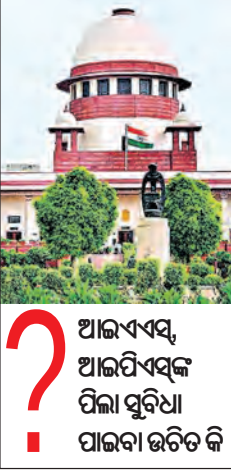
ଆଇନ ଏବଂ ଆଇନ ଏବଂ ପିଲା ସୁବିଧା ପାଇବା ଉଚିତ କି

ଚାକିରିରେ ଫରଷଣର ସୁବିଧା ଦେବାକୁ ଅନୁସୂଚିତ ଜାତି ଓ ଅନୁସୂଚିତ ଜନଜାତିଙ୍କୁ ଉପବର୍ଗୀକରଣ କରିବାର ଅଧିକାର ରାଜ୍ୟ ସରକାରଙ୍କ ଅଧିକାର ରହିଛି କି ନା ତାକୁ ନେଇ ପ୍ରଶ୍ନ ଉଠାଇଛନ୍ତି। ପଞ୍ଚମୀବର୍ଷ ଫରଷଣ ସୁବିଧା ପାଇଁ ଯେଉଁମାନେ ଆଇନ ଏବଂ, ଆଇନ ଏବଂ କିମ୍ବା ଆଇନ ଏବଂ ସହୋଇଛି, ସେମାନଙ୍କ ପିଲାମାନେ କ'ଣ ଫରଷଣ ସୁବିଧା ପାଇବା ଉଚିତ କି ବୋଲି ସୁପ୍ରିମକୋର୍ଟ ପ୍ରଶ୍ନ କରିଛନ୍ତି। ଉଲ୍ଲେଖଯୋଗ୍ୟ ଯେ, ପ୍ରଧାନବିଚାରପତି ଜଷ୍ଟିସ୍ ଡିଓର ଚନ୍ଦ୍ରଚୂଡ଼ଙ୍କ ଅଧିକାରରେ ଗଠିତ ପାଠରେ ଜଷ୍ଟିସ୍ ବିଆର ଗବାଇ, ବିକ୍ରମ ନାଥ, ବେଲା ଏମ ତ୍ରିବେଦୀ, ପଙ୍କଜ ମିଥଲ, ମନୋଜ ମିଶ୍ର ଓ ସତୀଶ ଚନ୍ଦ୍ର ଶର୍ମା ଏ ସମ୍ପର୍କରେ ମାମଲାର ୨୩ଟି ଆଦେଶ ଦିଅନ୍ତେ ଶୁଣାଣି କରୁଛନ୍ତି। ଯେଉଁଥିରେ ପଞ୍ଚମୀ ଓ ହରିୟାଣା ଉଚ୍ଚ ନ୍ୟାୟାଳୟର ୨୦୧୦ ରାୟକୁ ଚାଲେଞ୍ଜି କରାଯାଇଛି।