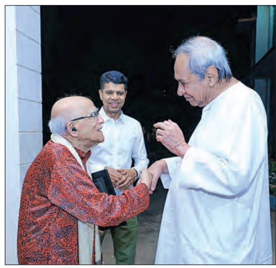
ପଦ୍ମଶ୍ରୀ ଦେବା ପ୍ରସନ୍ନ ପଟ୍ଟନାୟକ ରୂପବାର ନବୀନ ନିବାସରେ ପୂର୍ଣ୍ଣାଙ୍ଗୀ ନବୀନ ପଟ୍ଟନାୟକଙ୍କୁ ଭେଟିଛନ୍ତି