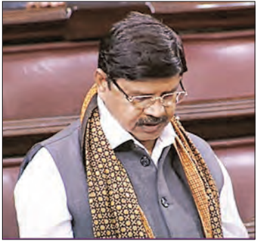
୨୦୨୦-୨୧ରେ ୧୦୨୫୯୮.୪୬ ଲକ୍ଷ ଟଙ୍କାର ପାଣି ମଞ୍ଜୁର କରାଯାଇଛି। ସେହିପରି ୨୦୨୨-୨୩ରେ ୮୭୫୦୬.୯୯ ଲକ୍ଷ ଟଙ୍କା କେନ୍ଦ୍ର ପକ୍ଷରୁ ପ୍ରଦାନ କରାଯାଇଛି। ୨୦୨୩-୨୪ କାନ୍ଥାଆରା ପର୍ଯ୍ୟନ୍ତ ୫୯୦୫୪.୮୮ ଲକ୍ଷ