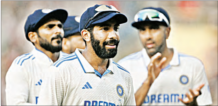
ବୁମ୍ରା, ୨୧ (ଏକେଡି)

ଯଶପ୍ରାପ୍ତ ବୁମ୍ରା ପ୍ରଥମ ଭାରତୀୟ ଦ୍ରୁତ ବୋଲର ଭାବେ ଅନ୍ତର୍ଜାତୀୟ କ୍ରିକେଟ୍ କାର୍ଯ୍ୟକ୍ରମ (ଆଇସିସି) ଟେଷ୍ଟ ରାମ୍ୟିଙ୍ଗର ବୋଲି ମାନ୍ୟତା ଶୀର୍ଷ ସ୍ଥାନ ଅଧିକାର କରିଛନ୍ତି। ବୁମ୍ରାଙ୍କ ପ୍ରକାଶିତ ତାଲିକାରେ ଗାନ୍ଧି ପାହାଚ ଉପରକୁ ଉଠି ବୁମ୍ରା ୮୮୧ ରେଟି