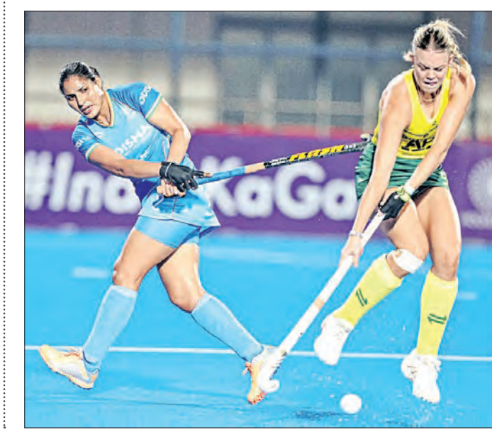
ଭୁବନେଶ୍ୱର, ୨୧ (ସମିପ)