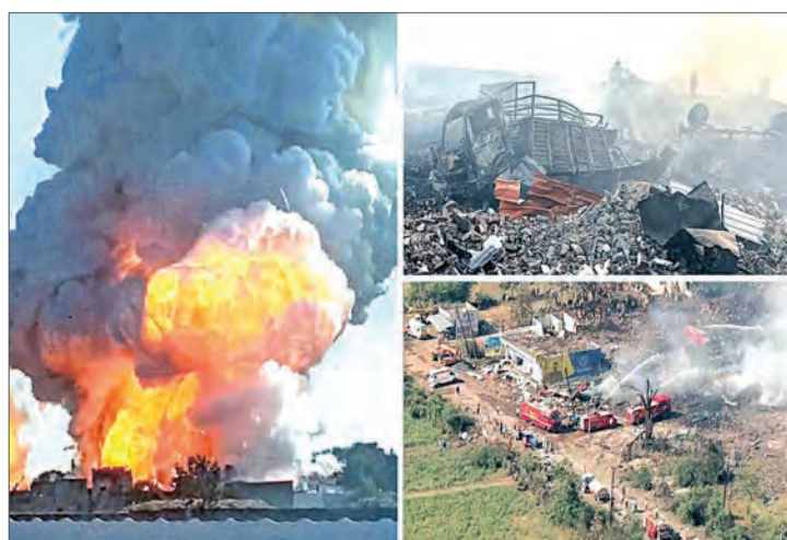
ଘଟଣାରେ ଗଭୀର ଦୁଃଖ ପ୍ରକାଶ କରି ରିଲିଫ ପାଣ୍ଠିକୁ ନୂତନମାନଙ୍କୁ ପରିବାରକୁ ୨ ପ୍ରଧାନମନ୍ତ୍ରୀ ନରେନ୍ଦ୍ର ମୋଦୀ ମୃତକ ଏବଂ ଆହତମାନଙ୍କ ଶୋକ ସନ୍ତପ ପରିବାରକୁ ସମ୍ମାନ ଦେବାକୁ କଣ୍ଠାପଲ୍ଲୀ ଦେବାକୁ ପ୍ରଧାନମନ୍ତ୍ରୀ ମୋଦୀ ଘୋଷଣା କରିଛନ୍ତି ।