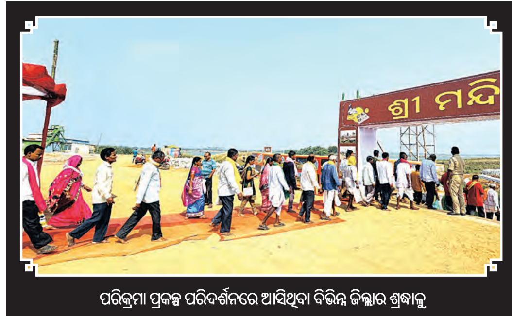
ପରିକ୍ରମା ପ୍ରକଳ୍ପ ପରିଦର୍ଶନରେ ଆସିଥିବା ବିଭିନ୍ନ ଜିଲ୍ଲାର ଶ୍ରୀକ୍ଷେତ୍ର

କରିଥିଲେ। ପରେ ଜିଲ୍ଲାପାଳ ଓ ଅନ୍ୟାନ୍ୟ ଅତିଥିମାନେ ପଢ଼ିଆ ମଧ୍ୟରେ କ୍ରୀଡ଼ାବିତଙ୍କ ସହ ପରିଚିତ ହୋଇ ଶୁଭେଚ୍ଛା ଜଣାଇଥିଲେ। ଏହି ପ୍ରତିଯୋଗିତାରେ ରାଜ୍ୟର ୩୦ଟି ଯାଜ ଜିଲ୍ଲା ୩୦ଟି ଲେଖାଏ ପୁରୁଷ ଓ ମହିଳା ଦଳ ଅଂଶଗ୍ରହଣ କରିଛନ୍ତି। ପୁରୁଷ ଦଳର କ୍ରିକେଟ ପ୍ରତିଯୋଗିତା ଜଗନ୍ନାଥ ଶ୍ରୀକ୍ଷେତ୍ରରେ ଓ ମହିଳା ଦଳର ପ୍ରତିଯୋଗିତା ଜିଲ୍ଲା ସ୍କୁଲ ପଢ଼ିଆରେ ୧୩ ତାରିଖ ପର୍ଯ୍ୟନ୍ତ ଅନୁଷ୍ଠିତ ହେବ ବୋଲି କ୍ରୀଡ଼ା ଅଧିକାରୀ ଶ୍ରୀ ସାହୁ ସୂଚନା ଦେଇଛନ୍ତି।