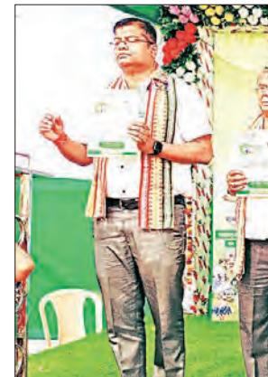
ରାମଚନ୍ଦ୍ରପୁର, ୨୧ (ସମିପ)

ଘସିପୁରା ବ୍ଲକ୍ ଅନ୍ତର୍ଗତ ମନ୍ଦପୁର ପଞ୍ଚାୟତରେ ‘ଆମ ଓଡ଼ିଶା, ନବୀନ ଓଡ଼ିଶା’ କାର୍ଯ୍ୟକ୍ରମରେ ଏକ ପଞ୍ଚାୟତସ୍ତରୀୟ କନ ସଚେତନତା କାର୍ଯ୍ୟକ୍ରମ ଅନୁଷ୍ଠିତ ହୋଇଯାଇଛି।