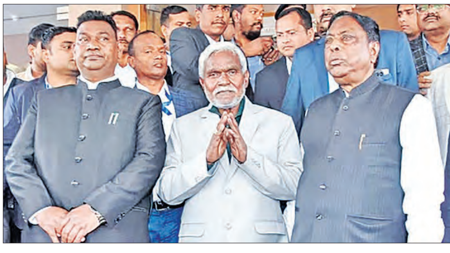
ଭାର୍ତ୍ତୀ, ୫୨ (ଏକେଡ୍):

ଝାଡ଼ଖଣ୍ଡର ନୂଆ ମୁଖ୍ୟମନ୍ତ୍ରୀ ଚମ୍ପାଇ ଯୋଗେନ ଆସ୍ଥା ଭୋଟରେ ବିଜୟ ହୋଇଛନ୍ତି। ଯୋଗଦାନ ବିଧାନସଭାରେ ଶକ୍ତି ପରୀକ୍ଷା ହୋଇଥିଲା ବେଳେ ଚମ୍ପାଇ ଯୋଗେନ ନେତୃତ୍ୱାଧୀନ ମେଣ୍ଟ ସରକାର ସପକ୍ଷରେ ୪୭ ଏବଂ ବିପକ୍ଷରେ ୨୯ଟି ଭୋଟ ମିଳିଛି। ଝାଡ଼ଖଣ୍ଡର ୮୧ ସଦସ୍ୟ ବିଶିଷ୍ଟ ବିଧାନସଭାରେ କୌଣସି ଦଳ ସରକାର ଗଢ଼ିବା ପାଇଁ ସହମତ ହାସଲ କରିବା ସ୍ୱରୂପ ୪୨ ବିଧାୟକଙ୍କ ସମର୍ଥନର ଆବଶ୍ୟକତା ରହିଛି। କିନ୍ତୁ ଏହି ସଂଖ୍ୟା ତୁଳନାରେ ଚମ୍ପାଇଙ୍କୁ ଅଧିକ ସମର୍ଥନ ମିଳିଥିବାରୁ ତାଙ୍କ ସରକାର ଅକ୍ଷେପରେ ଆସ୍ଥା ଭୋଟରେ ବିଜୟ ହୋଇଛି। ଚମ୍ପାଇଙ୍କ ଆସ୍ଥା ଭୋଟ ପାଇଁ ରାଜ୍ୟପାଳ ସିପି ରାଧାକୃଷ୍ଣନ ସ୍ୱତନ୍ତ୍ର ଭାବେ ବିଧାନସଭାରେ ଦୁଇ ଦିନିଆ ଅଧିବେଶନ ଡାକିଥିଲେ। ଏହି କାର୍ଯ୍ୟକ୍ରମରେ ଆସ୍ଥା ପରେ ବିଧାନସଭା ପୁନଃ ସମାବେଶ ହେବ। ଚମ୍ପାଇ ସରକାରର ବିଜୟ ପରେ କଂଗ୍ରେସ ଏବଂ ଅନ୍ୟ ମେଣ୍ଟ ସଦସ୍ୟ