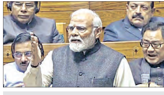
ନିର୍ବାଚନ ପରେ ନ ଥିବେ ବିରୋଧୀ; ଗ୍ୟାଲେରିରେ ବସିବେ ଦର୍ଶକ ବିରୋଧୀଙ୍କ ଆଜିର ସ୍ଥିତି ପାଇଁ କଂଗ୍ରେସ ଦାୟୀ

ନୂଆଦିଲ୍ଲୀ, ୫୨ (ଏକେଡ୍): ପ୍ରଧାନମନ୍ତ୍ରୀ ନରେନ୍ଦ୍ର ମୋଦୀ ଯୋଗଦାନ ଲୋକସଭାରେ ରାଷ୍ଟ୍ରପତି ଦ୍ରୌପଦୀ ମୁର୍ମୁଙ୍କ ଅଭିବାଦନା ଉପରେ ଧନ୍ୟବାଦ ଦେଇଛନ୍ତି। ମୋଦୀ ଶହେ ମିନିଟର ଅଭିବାଦନାରେ କଂଗ୍ରେସ, ପରିବାରବାଦ, ଦୁର୍ନୀତି, ନିୟନ୍ତ୍ରଣ, ଦରଦାମ ବୃଦ୍ଧି, ରାମ ମନ୍ଦିର, ପର୍ଯ୍ୟଟନ, ମହିଳା, କୃଷକ, ଯୁବ ବର୍ଗ, ବିରୋଧୀ ମେଣ୍ଟ ଏବଂ ୧୦ ବର୍ଷର ଯୁସିଏ ବନାମ ଏକତ୍ରୀଏ ସରକାର କାମ ଉପରେ ଆଲୋଚନା କରିଛନ୍ତି। ଏହି ସମୟରେ ପ୍ରଧାନମନ୍ତ୍ରୀ ୮୫ ଥର ଦେଶ, ୪୩ ଥର କଂଗ୍ରେସ, ୩୧ ଥର ଭାରତ, ୧୯ ଥର ବିରୋଧୀ, ୧୪ ଥର ଗୁପ୍ତାସିଦ୍ଧାନ୍ତ, ୯ ଥର ପରିବାରବାଦ, ୮ ଥର କୃଷକ-ଯୁବ ବର୍ଗ, ୬ ଥର ଦୁର୍ନୀତି, ନେହେରୁ, ୫ ଥର