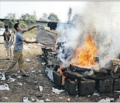
ପୂର୍ଣ୍ଣନା ଭଳି ରାକ୍ଷାପୁର ଡେଇଁ ଥାନା ନିଶାଦ୍ରବ୍ୟ ଯୋଡ଼ି ନଷ୍ଟ କରାଯାଇଛି । ଦୁଇବର୍ଷ ଧରି ଜୁମାତ ଡାକ୍ତର ନିଶାଦ୍ରବ୍ୟ ନଷ୍ଟ କରିବାରେ ଭଲ

ଜବତ ନିଶାଦ୍ରବ୍ୟ ବହୁଦିନ ମାଲଖାନାରେ ରହିବାରୁ ବିବାଦ ଲାଗି ରହିଥିଲା । କେତେବେଳେ ମୂଷା ଓ ଅଧରପା ଖାଇ ନଷ୍ଟ କରି ଦେଉଥିବାର ଅଭିଯୋଗ ତ ଆଉ କେବେ ସମ୍ପୃକ୍ତ ଥାନା ଅଧିକାରୀ ଓ କର୍ମଚାରୀ ମିଶି ବିଚ୍ଛିନ୍ନ କରୁଥିଲେ । ଜବତ ନିଶାଦ୍ରବ୍ୟକୁ ନେଇ ଅଭିଯୋଗର ଫଳ ଲାଭିବା ପରେ ଓଡ଼ିଶା ପୁଲିସ ପକ୍ଷରୁ ଅଭିଯାନ ଆରମ୍ଭ ହୋଇଥିଲା । ପ୍ରାୟ ଏକ ଦଶନ୍ଧି ଧରି ଜବତ ନିଶାଦ୍ରବ୍ୟ ନଷ୍ଟ କରିବା ଲାଗି କିଛି ଗାଈଡ଼ୋଇ ନିର୍ଦ୍ଦେଶ ଦିଆଯାଇଥିଲା । କୋର୍ଟ ବି