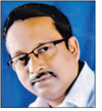
ପ୍ରଫେସର କୃଷ୍ଣଚନ୍ଦ୍ର ପ୍ରଧାନ

ଭାଷାତତ୍ତ୍ଵବିଦ୍ଵଙ୍କ ମତରେ ତାହାହିଁ ହେଉଛି ବର୍ତ୍ତମାନର ଓଡ଼ିଆ ଭାଷାର ମୂଳରୂପ। ଅଶୋକଙ୍କ ଧଉଳି ଓ କରଗଡ଼ ଅନୁଶାସନରେ ଏହାର ପ୍ରାଚୀନ ରୂପ ପରିଲକ୍ଷିତ ହୋଇଥାଏ। ଖାରବେଳଙ୍କ ଖଣ୍ଡଗିରି ହାତୀଗୁମ୍ଫା ଶିଳାଲେଖର ଭାଷା ହେଉଛି ଅର୍ଦ୍ଧମାଗଧୀ ପ୍ରାକୃତ ଭାଷା। ଅର୍ଦ୍ଧ-ମାଗଧୀ ପ୍ରାକୃତ ହେଉଛି ଓଡ଼ିଆ ଭାଷାର ମୂଳ। ଖ୍ରୀ:ପୂ. ଶତାବ୍ଦୀରୁ ଚତୁର୍ଦ୍ଦଶ / ପଞ୍ଚଦଶ ଶତାବ୍ଦୀ ମଧ୍ୟରେ କଣ୍ଠୋପ, କୋଶଳ, ଉଡ୍ର, କଳିଙ୍ଗ, ଉତ୍କଳ ଆଦି ପରିଶେଷରେ ଯେଉଁ ନୂଆ ନାମ ପାଇଛି, ତାହା ହେଲା 'ଓଡ଼ିଶା'। ଏହି ଦେଶର ଭାଷା ହେଉଛି 'ଉଡ୍ର ବିଭାଷା' ବୋଲି ନାଟ୍ୟଶାସ୍ତ୍ରରେ ଉଲ୍ଲେଖ ରହିଛି। ପ୍ରାୟ ସପ୍ତମ ଶତାବ୍ଦୀ ବେଳକୁ ଓଡ଼ିଆ ଭାଷାର ସ୍ଵରୂପ ପରିଲକ୍ଷିତ ହୋଇଥାଏ ଶୈଳଭଦ୍ର ବଂଶର ମହାରାଣୀ କଲ୍ୟାଣୀ ମହାଦେବୀଙ୍କ ଦ୍ଵାରା ପ୍ରଦତ୍ତ 'ନିବିନା' ତାମ୍ରଶାସନରେ। ଜୈନମାନ ଯାହାକୁ ଅର୍ଦ୍ଧମାଗଧୀ ବୋଲି କହିଥାନ୍ତି ଓ ଯେଉଁ ଭାଷାରେ ସେମାନେ ତାଙ୍କର ଧର୍ମ ପ୍ରଚାର କାର୍ଯ୍ୟ କରିଛନ୍ତି, ତାହା ବର୍ତ୍ତମାନର ଓଡ଼ିଆ ଭାଷା ବୋଲି କେହି କେହି ଅନୁମାନ କରିଥାନ୍ତି। ୧୦୫୧ ଖ୍ରୀ: ମେ ଉତ୍କଳୀୟ ଶିଳାଲେଖରେ ଓଡ଼ିଆ ନିପିର ସ୍ଵରୂପ ସଙ୍କେତ ରହିଛି। ଗ୍ରାନ୍ଥରସନ୍ ଓଡ଼ିଆ ଭାଷାକୁ