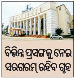
ବିଭିନ୍ନ ପ୍ରସଙ୍ଗକୁ ନେଇ ସରଗରମ ରହିବ ଗୃହ