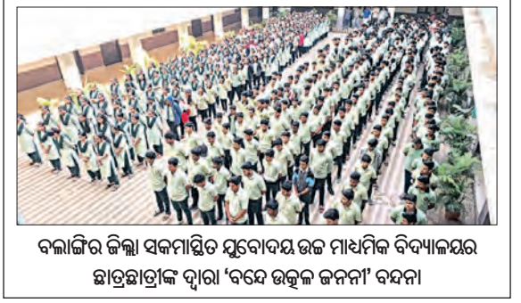
ବଲାଙ୍ଗୀର ଜିଲ୍ଲା ସମାଜସ୍ୱର ପ୍ରସାରଦଳ ଉଚ୍ଚ ମାଧ୍ୟମିକ ବିଦ୍ୟାଳୟର ଛାତ୍ରଛାତ୍ରୀଙ୍କ ଦ୍ୱାରା 'ବଦେ ଉତ୍କଳ ଜନନୀ' ବନ୍ଦନା

କଲମପୁର, ୪୨ (ସମ୍ବିଧ): କଳାହାଣ୍ଡି ଜିଲ୍ଲା କଲମପୁର ଥାନା ଅଧିନସ୍ଥ ଦେପୁର ଗ୍ରାମ ଗୁଲୁଣା ନିକଟରେ ରବିବାର ସଞ୍ଚାର ଏକ ଦୁର୍ଘଟଣା ଘଟି ଉଠିଥିଲା। ଘଟଣାରେ ଓକ୍ ବାଳକ ଗୁରୁତର ହୋଇଛନ୍ତି। ଘଟଣାରେ ଓକ୍ ବାଳକ ଗୁରୁତର ହୋଇଛନ୍ତି। ଘଟଣାରେ ଓକ୍ ବାଳକ ଗୁରୁତର ହୋଇଛନ୍ତି। ଘଟଣାରେ ଓକ୍ ବାଳକ ଗୁରୁତର ହୋଇଛନ୍ତି।