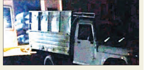
ଗାଡ଼ିକୁ ଧାନ ଅନଲୋଡିଂ କରିବାକୁ ନେଇ ସ୍ଥାନୀୟ ରାଷ୍ଟ୍ରାୟତକରେ ଉତ୍ତେଜନା ପ୍ରକାଶ ପାଇଛି। ସ୍ଥାନୀୟ କିଛି ରାଷ୍ଟ୍ରାୟତକ ଆସି ଧାନ କେଉଁଠୁ ଆସିଲ ବୋଲି ପ୍ରଶ୍ନ କରିବା ସହ ରବିବାର ରାତିରେ ପାଠ୍ କାହିଁକି ଖୋଲାଯାଇଛି ବୋଲି ପ୍ରଶ୍ନ କରିଥିଲେ।

ଦେଓଗାଁ, ୪୨ (ସମ୍ବିଧ): ବଲାଙ୍ଗୀର ଜିଲ୍ଲା ଦେଓଗାଁ ବ୍ଲକ୍ ରାମଚନ୍ଦ୍ରପୁର ପ୍ରାଥମିକ କୃଷିସେବା ସମବାୟ ସମିତିରେ ରବିବାର ରାତି ପ୍ରାୟ ୭ଟା ସମୟରେ ୩ଟି ମେଟ୍ରିକ୍‌ପତ୍ର