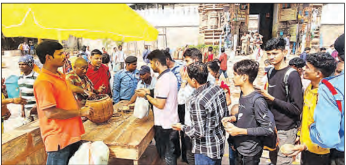
ଭକ୍ତ ମହାପ୍ରଭୁଙ୍କ ଉଦ୍ଦେଶ୍ୟରେ ଅନୁଗ୍ରହ ପରିଷଦ, ଗୁଆ ଓ ନଡ଼ିଆ ଅର୍ପଣ କରିଥିଲେ। ସବୁ ଜିଲ୍ଲାରୁ ଫେବୃଆରୀ ୧୫ ତାରିଖରେ ଭକ୍ତଙ୍କୁ ଖେତେଡ଼ି ବଣ୍ଟନ କରାଯାଇଥିଲା।

ବନ୍ଧନ କରାଯାଇଛି। ଖଳିପତ୍ର ବନାରେ ଭକ୍ତମାନଙ୍କୁ ଖେତେଡ଼ି ଦିଆଯାଇଥିଲା। ଏହାକୁ ପାଇ ଆମତୁଡ଼ି ଲାଭ କରିଥିବା ଅନେକ ଭକ୍ତ ମତ ଦେଇଛନ୍ତି।