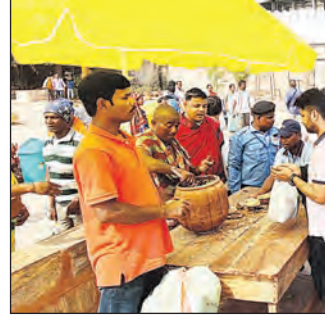
ଭକ୍ତ ମହାସୁଆର ଉଦ୍ଦେଶ୍ୟରେ ଅରୁଆ ଚାଉଳ, ନଡ଼ିଆ, ଗୁଆ ଆଦି ଅର୍ପଣ କରିଥିଲେ। ସବୁ ଜିଲ୍ଲାରୁ ଫେବୃଆରୀ ୧୫ ତାରିଖରେ ଶ୍ରୀମନ୍ଦିର ରୋଷଣାକାରେ ଭକ୍ତ ସମ୍ପର୍କରେ କରାଯିବା ଅନ୍ତର (ଅରୁଆ ଚାଉଳ), ନଡ଼ିଆ ଆଦିରେ ପ୍ରସ୍ତୁତ ହୋଇଛି ସୁସ୍ୱାଦୁ ଖେତେଡ଼ି। ଏହି ଖେତେଡ଼ିକୁ ଶ୍ରଦ୍ଧାଳୁଙ୍କ ମଧ୍ୟରେ ବାଣ୍ଟି ଦିଆଯାଇଛି। ଏହାକୁ ପାଇ କୃତାର୍ଥ ହୋଇଛନ୍ତି ଭକ୍ତ। ଆଗକୁ ଏହିପରି ଭାବେ ଭକ୍ତଙ୍କୁ ଖେତେଡ଼ି ବଣ୍ଟନ କରାଯିବ ବୋଲି ସୁଆର ମହାସୁଆର ନିର୍ଦ୍ଦେଶ ପଛରୁ ସୂଚନା ଦିଆଯାଇଛି।

ବଣ୍ଟନ କରାଯାଇଛି। ଖଳିପତ୍ର ବନରେ ଭକ୍ତମାନଙ୍କୁ ଖେତେଡ଼ି ଦିଆଯାଇଥିଲା। ଏହାକୁ ପାଇ ଆମତୁଡ଼ି ଲାଭ କରିଥିବା ଅନେକ ଭକ୍ତ ମତ ଦେଇଛନ୍ତି। ଭକ୍ତ ଯେଉଁଭଳି ଭକ୍ତି ଭାବରେ ଏହାକୁ ଅର୍ପଣ କରିଥିଲେ, ସେହିଭଳି ଭକ୍ତି ଓ ନିଷ୍ଠାର ସହ ଶ୍ରୀମନ୍ଦିର ପ୍ରଶାସନ ମଧ୍ୟ ଗ୍ରହଣ କରିଛି। ରବିବାର ସକାଳ ଧୂପରେ ଭକ୍ତଙ୍କୁ ଏହା ବଣ୍ଟନ କରାଯିବ। ପରେ ପର୍ଯ୍ୟାୟକ୍ରମେ ପ୍ରଥମ ଭୋଗ ମଣ୍ଡପ, ଦ୍ୱିତୀୟ ଧୂପ ଓ ସନ୍ଧ୍ୟା ଧୂପ ପର୍ଯ୍ୟନ୍ତ ବଣ୍ଟାଯାଇଛି। ତେବେ କମିଟି ଚାଉଳ ଯାଞ୍ଚ ପରେ ୨୪୦ ପ୍ୟାକେଟ୍ ଚାଉଳ ସୁଆର ମହାସୁଆର ନିର୍ଦ୍ଦେଶକୁ ଯୋଗାଇ ଦିଆଯାଇଥିଲା। ସେଥିରୁ ପ୍ରଥମ ଦିନରେ ୧୦୦ ହାଣ୍ଡି ମହାସୁଆର ଭକ୍ତଙ୍କୁ ବଣ୍ଟନ କରାଯାଇଛି। ଅନ୍ତତଃ ଶ୍ରଦ୍ଧାଳୁ ସହ ସମସ୍ତ ଭକ୍ତ ମହାସୁଆର ପାଇଥିବା ବେଳେ ପରବର୍ତ୍ତୀ ନିଷ୍ପତ୍ତି ନିର୍ଦ୍ଦେଶ ଦ୍ୱାରା ପର୍ଯ୍ୟନ୍ତ ଆଗକୁ ଏହି ପ୍ରକ୍ରିୟା ଜାରି ରହିବ ବୋଲି କହିଛନ୍ତି ସୁଆର ମହାସୁଆର (ଭକ୍ତ, ଦକ୍ଷିଣ ଓ ପଶ୍ଚିମ)ରେ ଭକ୍ତଙ୍କୁ