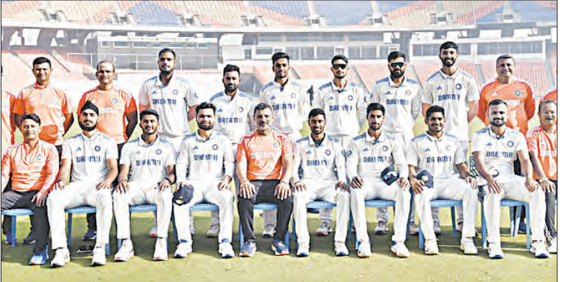
ଅହମ୍ମଦାବାଦ, ୪୮୨ (ଏକେଡ଼ି)

ସ୍ଥାନୀୟ ନରେନ୍ଦ୍ର ମୋଦି କ୍ରିଡ଼ାଳୟରେ ଅନୁଷ୍ଠିତ ତୃତୀୟ ଅନ୍ତର୍ଦ୍ଧିଆଲ ଟେଷ୍ଟରେ ଇଂଲଣ୍ଡ ଲାୟଭୁ ବିପକ୍ଷ ତୃତୀୟ ଅନ୍ତର୍ଦ୍ଧିଆଲ ଟେଷ୍ଟରେ ଘରୋଇ ଭାରତ-ଏ ଦଳ ବୃହତ୍ ୧୩୪ ରନ୍ରେ ବିଜୟ ହାସଲ କରିଛି । ପ୍ରଥମ ପାଳିରେ ୭ ରନ୍ ପଛରେ ପଡ଼ିବା ପରେ ଭାରତ ପ୍ରତ୍ୟାବର୍ତ୍ତନ କରି ଦ୍ୱିତୀୟ ପାଳିରେ ୧୦୭.୧ ଓକେଟ୍ରେ ୪୦୯ ରନ୍ରେ ବଡ଼ ଷ୍ଟ୍ରାଇକ୍ ହାସଲ କରି ଅଲଆଉଟ ହୋଇଥିଲା । ପଛରେ ଇଂଲଣ୍ଡ ସମ୍ପୂର୍ଣ୍ଣାନ୍ତରେ ୪୦୩ ରନ୍ରେ ବିଜୟ ଲକ୍ଷ୍ୟ ଧାର୍ଯ୍ୟ ହୋଇଥିଲା । ଜବାବରେ ଇଂଲଣ୍ଡ ଦ୍ୱିତୀୟ ପାଳି ଆରମ୍ଭ କରି ଭାରତୀୟ ଷ୍ଟ୍ରାଇକ୍ ସମ୍ପୂର୍ଣ୍ଣାନ୍ତ ହୋଇ ନପାରି ରହିବାର ଚତୁର୍ଥ ତଥା ଅନ୍ତିମ ଦିବସରେ ୬୨୪ ଓକେଟ୍ରେ ୨୬୮ ରନ୍ କରି