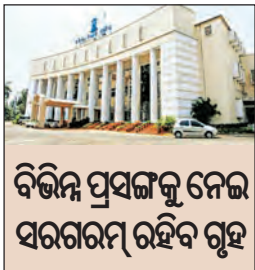
ବିଭିନ୍ନ ପ୍ରସଙ୍ଗକୁ ନେଇ ସରଗରମ ରହିବ ଗୃହ