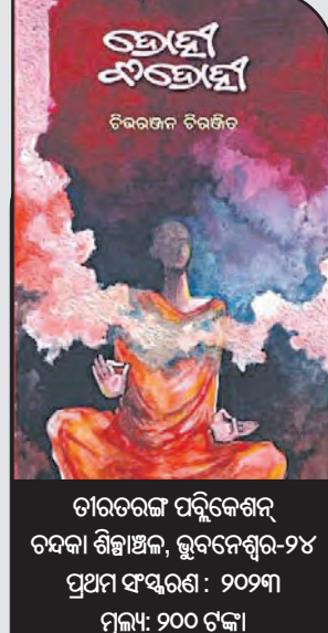
ଚାରତରଞ୍ଜନ ପରିକେଶ୍ଵର ବଦନା ଶିଳ୍ପାଞ୍ଜଳ, ଭୁବନେଶ୍ଵର-୨୪ ପ୍ରଥମ ଫ୍ୟୁରଣ: ୨୦୨୩ ମୂଲ୍ୟ: ୨୦୦ ଟଙ୍କା

ସତେଯେମିତି, ମଣିଷ ତାରା ପାଲଟିବା ଏକ ଅନିବାର୍ଯ୍ୟ । ସେହିପରି ‘ବିଦ୍ରୋହା’ରେ ଗୋଟିଏ ଗାଁରେ ଭଗବାନ ବୁଦ୍ଧଙ୍କ ମୂର୍ତ୍ତି ପ୍ରତିଷ୍ଠା କନିତ ଅବେଗ ଏବଂ ତାହାକୁ ନେଇ ଗଡ଼ି ଉଠୁଥିବା ଆତ୍ମ-ଫଲ୍ଲଣର ଚିତ୍ର ରହିଛି । ଏମିତି ବି ଘଟିଥାଏ, ବୁଦ୍ଧଙ୍କ ଧୂମାବଶେଷ ଆସିସ୍ଵତ ହେଉଥିବା ଏବଂ ବୁଦ୍ଧଙ୍କ ପ୍ରତିମୂର୍ତ୍ତି ଥିବା ଗାଁ ଏହାର ସ୍ଵରୂପ ଓ ଦର୍ଶନଠାରୁ ସମ୍ପୂର୍ଣ୍ଣ ଭାବରେ ପୃଥକ୍ ହୋଇଗଈଥାଏ । ହେଲେ, ଏହି ଉପନ୍ୟାସରେ ବର୍ଣ୍ଣିତ ଗାଁ ଏହାର ସମ୍ପୂର୍ଣ୍ଣ ବ୍ୟତିକ୍ରମ । ଏହି ଉପନ୍ୟାସରେ ଏକ ସକାରାତ୍ମକ ରୂପକଳ ରହିଛି । ‘ବିଦ୍ରୋହା’ ପାଇଁ ବେଳେବେଳେ କୌଣସି ଶବ୍ଦର ଆବଶ୍ୟକତା ପଡ଼ିନଥାଏ, ବଡ଼ ନିଃଶବ୍ଦ ଭାବେ ଜଣେ ବିଦ୍ରୋହୀର ସଭା ଭିତରେ ନିଜକୁ ଆବଦ୍ଧ କରିପାରେ । ଏହି ଉପନ୍ୟାସରେ ‘ବିଦ୍ରୋହୀ’ର ଚରିତ୍ର ଠିକ୍ ଏହିଭଳି । ଏହି ଦୁଇଟି ଉପନ୍ୟାସ ବେଶ୍ ସୁଖପାଠ୍ୟ ହୋଇଛି । ଉପନ୍ୟାସର କାହାଣୀ ପାଠକଙ୍କୁ ବାଣି ରଖିବାର ସମ୍ପନ ହେବ ବୋଲି ଆଶା କରାଯାଏ । ■