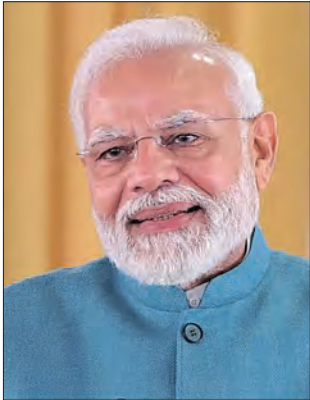
ଆଇଆଇଏମ୍ ସହ ଏକାଧିକ ପ୍ରକଳ୍ପର ହେବ ଲୋକାର୍ପଣ ଯୋଗଦେବେ ମୁଖ୍ୟମନ୍ତ୍ରୀ

■ ସମ୍ବଲପୁର/ଭୁବନେଶ୍ୱର, ୨୧ (ସମ୍ପାଦକ): ସମ୍ବଲପୁର ଆଇଆଇଏମ୍ ଶ୍ରୀ ଶ୍ରୀ କ୍ୟାମ୍ପସ୍‌ରେ ଆସନ୍ତାକାଲି ପ୍ରଧାନମନ୍ତ୍ରୀ ନରେନ୍ଦ୍ର ମୋଦୀ ଆନୁଷ୍ଠାନିକ ଭାବେ ଲୋକାର୍ପଣ କରିବେ। ଏହି କାର୍ଯ୍ୟକ୍ରମରେ ରାଜ୍ୟପାଳ ରଘୁବର ଦାସ ଏବଂ ମୁଖ୍ୟମନ୍ତ୍ରୀ ନବୀନ ପଟ୍ଟନାୟକ ଯୋଗଦେବେ। ଶନିବାର ପୂର୍ବାହ୍ନରେ ଜନତା ମଇଦାନରେ ପ୍ରଥମ ବିଶ୍ୱ ଓଡ଼ିଆ ଭାଷା ସମ୍ମିଳନୀକୁ ଉଦ୍ଘାଟନ କରିବା ପରେ ମୁଖ୍ୟମନ୍ତ୍ରୀ ହେଲିକପ୍ଟର ଯୋଗେ ସମ୍ବଲପୁର ଅଭିମୁଖେ ଯାତ୍ରା କରିବେ। ଅପରାହ୍ନ ୧.୪୦ରେ ମୁଖ୍ୟମନ୍ତ୍ରୀ ସମ୍ବଲପୁରରେ ପ୍ରଧାନମନ୍ତ୍ରୀଙ୍କୁ ସ୍ୱାଗତ କରିବା ସହ ଆଇଆଇଏମ୍ ଉଦ୍ଘାଟନ ଏବଂ ଅନ୍ୟାନ୍ୟ କାର୍ଯ୍ୟକ୍ରମରେ ଯୋଗଦେବେ।