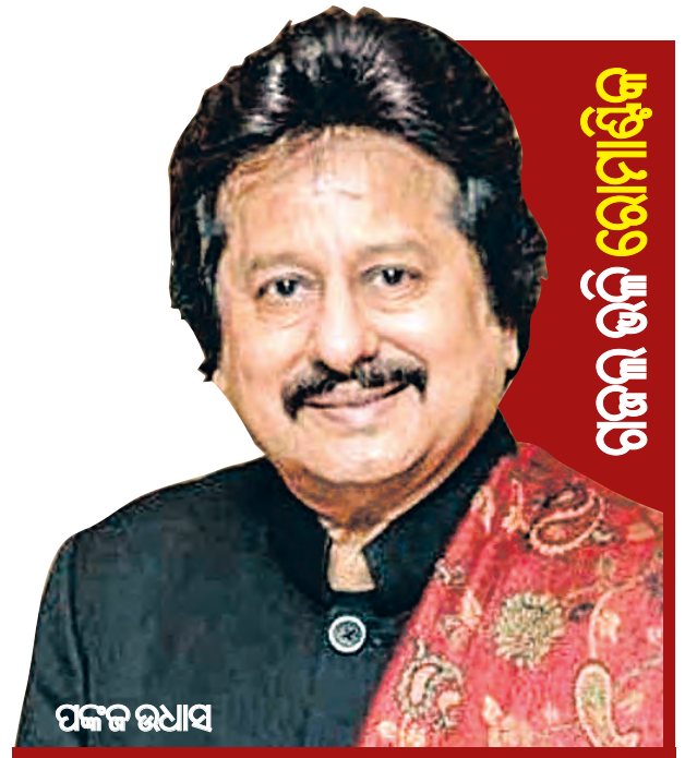
ଗଜଲ ଭଲ ରୋମାଞ୍ଚିକ