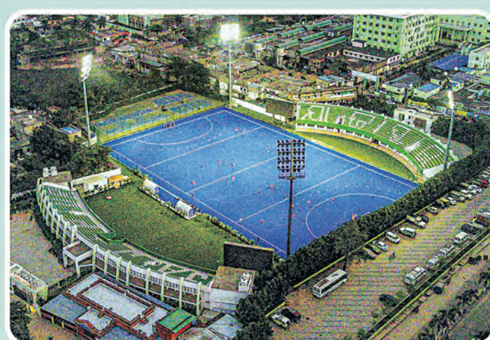
ହକି ପ୍ରଶିକ୍ଷଣ କେନ୍ଦ୍ର ଯାଜପୁର