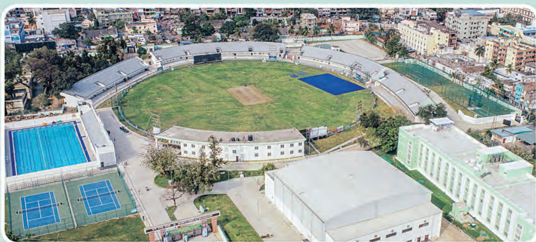
ବ୍ରହ୍ମପୁର ସ୍ପୋର୍ଟସ୍ କମ୍ପ୍ଲେକ୍ସ, ବ୍ରହ୍ମପୁର