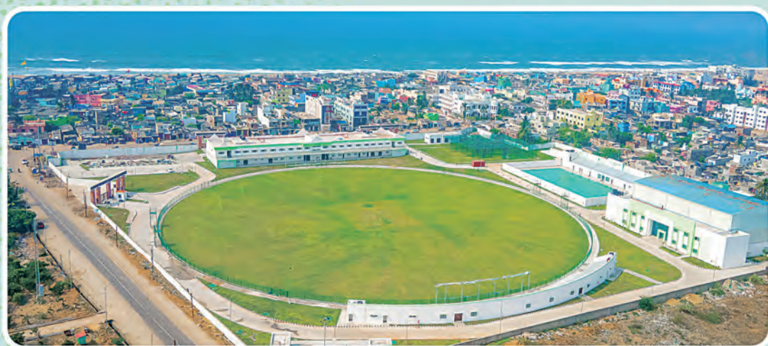
ଶ୍ରୀଜଗନ୍ନାଥ କ୍ରିକେଟ୍ ଷ୍ଟାଡ଼ିୟମ, ପୁରୀ