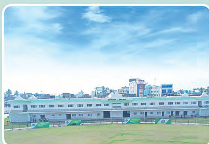
ମହିଳା କ୍ରିକେଟ୍ ଏକାଡେମୀ ପୁରୀ