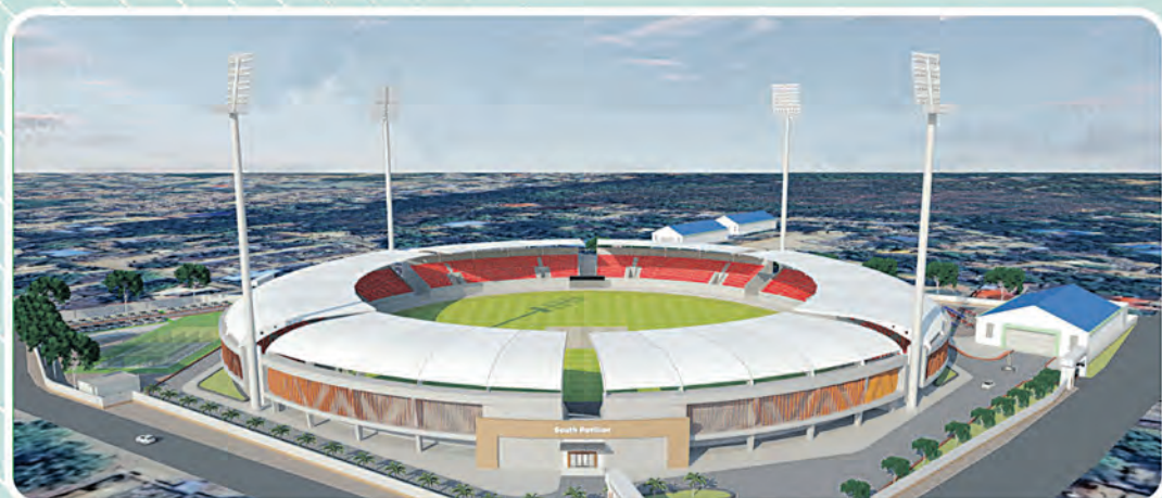
ଝିଏସ୍ଏସ୍ କ୍ରିକେଟ୍ ଷ୍ଟାଡ଼ିୟମ, ସମ୍ବଲପୁରର ପୁନଃବିକାଶ