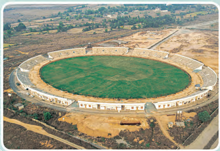
କ୍ରିକେଟ୍ ଗ୍ରାଉଣ୍ଡ ଝାରସୁଗୁଡ଼ା