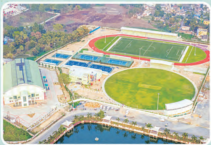
କ୍ୱୀଡ଼ା କମ୍ପ୍ଲେକ୍ସ ଯାଜପୁର