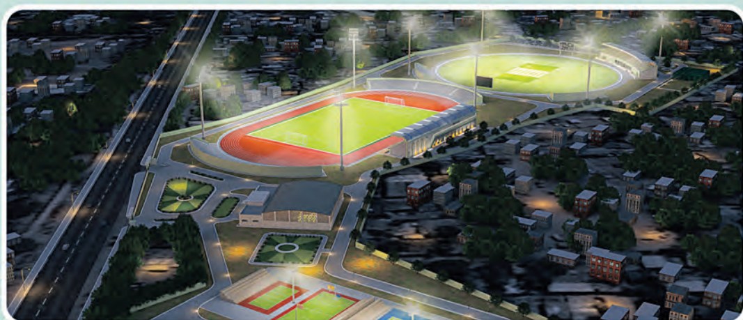
ସ୍ପୋର୍ଟସ୍ କମ୍ପ୍ଲେକ୍ସ, ବରଗଡ଼