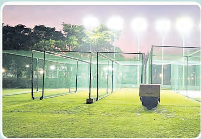
ଓସିଏ ର ୪୨ଟି କ୍ରିକେଟ୍ ଏକାଡେମୀ