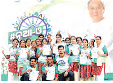
ବାଧାବିହୀନ ସମ୍ପୂର୍ଣ୍ଣ ନ ହେବ, ତାହା ଉପରେ ମୁଖ୍ୟମନ୍ତ୍ରୀ ଗୁରୁତ୍ୱାରୋପ କରୁଛନ୍ତି। ଏହିକ୍ରମରେ ମୁଖ୍ୟମନ୍ତ୍ରୀ କଲେଜ ପଢ଼ୁଆ ଛାତ୍ରଛାତ୍ରୀଙ୍କ ପାଇଁ 'ନୂଆ-ଓ' ଛାତ୍ରବୃତ୍ତି ଆରମ୍ଭ କରିଥିବା ବେଳେ ଆଜିଠାରୁ ଛାତ୍ରବୃତ୍ତି ପ୍ରଦାନ ପ୍ରକ୍ରିୟା ବିଧିବଦ୍ଧ ଆରମ୍ଭ ହୋଇଛି। ଯାହାକୁ ନେଇ ରାଜ୍ୟବ୍ୟାପୀ କଲେଜ

ଭୁବନେଶ୍ୱର, ୨୬/୨ (ସମ୍ପାଦକ): ଛାତ୍ରଛାତ୍ରୀ ହେଉଛନ୍ତି 'ନୂଆ ଓଡ଼ିଶା, ନବୀନ ଓଡ଼ିଶା'ର ବାର୍ତ୍ତାବହ। ଏକ ସଶକ୍ତ, ପାରଙ୍ଗମ ଏବଂ ଦକ୍ଷ ଯୁବ ସମାଜ ହିଁ ଏକ ସମୃଦ୍ଧ ରାଷ୍ଟ୍ର ଗଠନ କରିବାର ଦକ୍ଷତା ରଖିଥାନ୍ତି। ସେଥିପାଇଁ ମୁଖ୍ୟମନ୍ତ୍ରୀ ନବୀନ ପଟ୍ଟନାୟକ ନିରନ୍ତର ଛାତ୍ରଛାତ୍ରୀଙ୍କ ପାଇଁ ବ୍ୟାପକ ଯୋଜନା ଏବଂ କାର୍ଯ୍ୟକ୍ରମ ପ୍ରସ୍ତୁତ କରି ଆସିଛନ୍ତି। ଅତି ଗରିବରୁ ଗରିବ ପିଲାଟିଏ ଯେପରି ନିଜର ସ୍ୱପ୍ନ ହାସଲ କରିପାରେ ତେପରି ପଢ଼ୁଆ ଛାତ୍ରଛାତ୍ରୀମାନଙ୍କ ମଧ୍ୟରେ ଦେଖାଦେଇଛି ଅପୂର୍ବ ଉତ୍ସାହ। ପାଠ ପଢ଼ା ପାଇଁ ଆର୍ଥିକ ସମସ୍ୟା ଉଭୟ ଛାତ୍ରଛାତ୍ରୀ ଏବଂ ଅଭିଭାବକଙ୍କ ପାଇଁ ଏକ ପ୍ରମୁଖ ସମସ୍ୟା ପାଲଟୁଥିବା ବେଳେ ନବୀନଙ୍କ ଏହି ଯୁବାବଲମ୍ବୀ ନିଷ୍ପତ୍ତି ଏକ ସଶକ୍ତ ଯୁବ ସମାଜ ଗଠନ କରିବାରେ ବଡ଼ ଭୂମିକା ଗ୍ରହଣ କରିବ ବୋଲି କୁହାଯାଉଛି। ଓଡ଼ିଶାର ପ୍ରତିଟି ପିଲା ପାଠ ପଢ଼ିବେ, ନିଜ ପରିବାର ପାଇଁ, ସମାଜ ପାଇଁ, ରାଜ୍ୟ ପାଇଁ ସୁନାମ ଆଣିବେ। ଏକ ନୂଆ, ସଶକ୍ତ ଏବଂ ନବୀନ ଓଡ଼ିଶା ଗଠନର ପ୍ରମୁଖ ସାଧନା ସାଧିବେ। ପିଲାଙ୍କୁ କଲେଜରେ ପାଠ ପଢ଼ାଇବାକୁ କୌଣସି ଅଭିଭାବକଙ୍କୁ ଆଉ ଜମି ବନ୍ଧା ପକାଇବାକୁ ପଡ଼ିବ ନାହିଁ। ଏପରି ପରିକଳ୍ପନାକୁ ସାକାର କରିବା ପାଇଁ ମୁଖ୍ୟମନ୍ତ୍ରୀ ନବୀନ ପଟ୍ଟନାୟକ ନୂଆ-ଓ ଛାତ୍ରବୃତ୍ତି ଆରମ୍ଭ କରିଥିବା ବେଳେ ଏହା ରାଜ୍ୟର କଲେଜ ପଢ଼ୁଆ ଛାତ୍ରଛାତ୍ରୀଙ୍କ ଶିକ୍ଷା ଗ୍ରହଣ ବ୍ୟବସ୍ଥାକୁ ଏକ ନୂଆ ଉଚ୍ଚତା ଦେବ ବୋଲି ସାଧାରଣରେ ମତପ୍ରକାଶ ପାଇଛି। ମଧ୍ୟବିତ୍ତ ପରିବାର ପାଇଁ ଏପରି ବୃଦ୍ଧି ଖୁବ୍ ଆଶ୍ୱାସନା ଆଣିଦେଇଥିବା ବେଳେ ଉପକୃତ ଛାତ୍ରଛାତ୍ରୀ ଏବଂ ଅଭିଭାବକ ମୁଖ୍ୟମନ୍ତ୍ରୀଙ୍କୁ କୃତଜ୍ଞତା ଜଣାଇଛନ୍ତି। ଏହି ନୂଆ-ଓ ଛାତ୍ରବୃତ୍ତି ଯୋଜନାରେ ରାଜ୍ୟର ସ୍ୱାତନ୍ତ୍ର ଶ୍ରେଣୀର ୪-୫ ଲକ୍ଷ ଛାତ୍ରଛାତ୍ରୀ ଓ ସ୍ୱାତନ୍ତ୍ର ଶ୍ରେଣୀର ୩୨ ହଜାର ଛାତ୍ରଛାତ୍ରୀ ଉପକୃତ ହେବାକୁ ଯାଉଛନ୍ତି। ମୁଖ୍ୟମନ୍ତ୍ରୀଙ୍କ ନୂଆ ଓଡ଼ିଶାର ସ୍ୱପ୍ନକୁ ବାସ୍ତବ ରୂପାୟନ ଓ ଯୁବ ସଶକ୍ତିକରଣ ଶ୍ରେଣୀରେ ଏହା ଏକ ନୂଆ ଆଧାର ସୃଷ୍ଟି କରିବ ବୋଲି ବୃଦ୍ଧିକାମି ମହଲରେ ମତପ୍ରକାଶ କରିଛନ୍ତି।