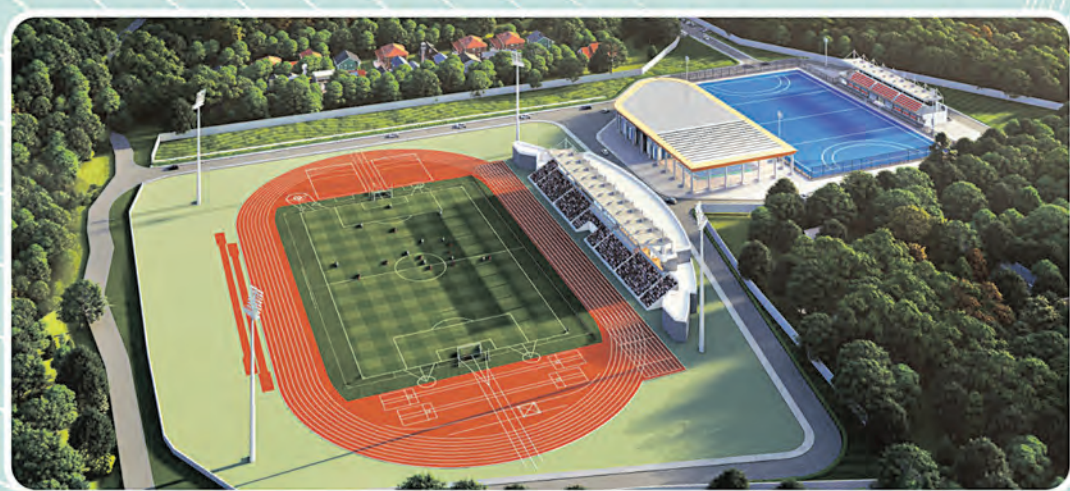
ସ୍ପୋର୍ଟସ୍ କମ୍ପ୍ଲେକ୍ସ, ଢେଙ୍କାନାଳ