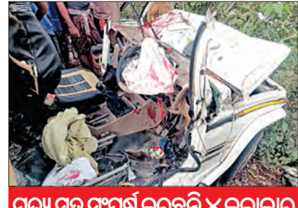
ମୃତ୍ୟୁ ସହ ସଂଘର୍ଷ କରୁଛନ୍ତି ୪ କଳାକାର

■ କେନ୍ଦ୍ରାପଡ଼ା, ୨୬/୨ (ସମ୍ବାଦ): ନାଟ୍ୟ ମଞ୍ଚକୁ ଉଠିବା ପୂର୍ବରୁ ଜୀବନ ମଞ୍ଚକୁ ଖସି ପଡ଼ିଲେ। କେନ୍ଦ୍ରାପଡ଼ା ସଦର ଥାନା ଅନ୍ତର୍ଗତ ଓଡ଼ିଆ ପଞ୍ଚାୟତର ହଳଦାଡ଼ିହ ଛକ ନିକଟରେ ଆଜି ଏକ ମର୍ତ୍ତ୍ୟୁଦ ଦୁର୍ଘଟଣା ଘଟିଲା।