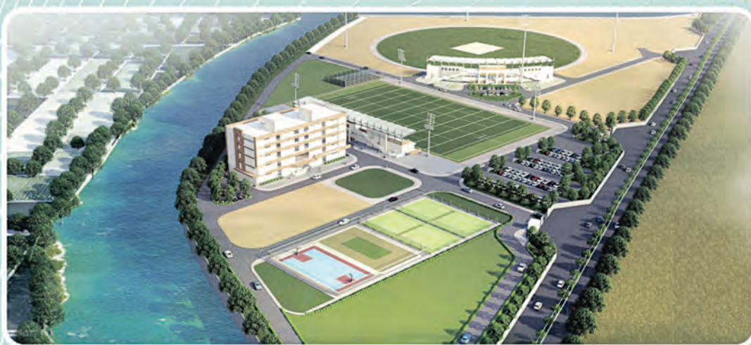
ସ୍ପୋର୍ଟସ୍ ଏକାଡେମୀ, ଯାଜପୁର