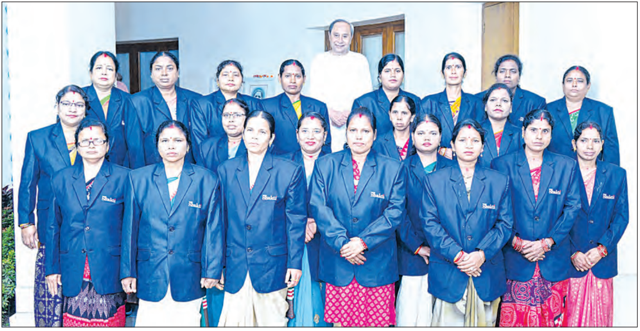
ଦୁବାଇ ଗସ୍ତ ପୂର୍ବରୁ ରବିବାର ନବୀନ ନିବାସରେ ମୁଖ୍ୟମନ୍ତ୍ରୀ ନବୀନ ପଟ୍ଟନାୟକଙ୍କୁ ଭେଟୁଛନ୍ତି ମିଶନ ଶକ୍ତି ପ୍ରତିନିଧି ମଣ୍ଡଳୀ

• ଭାରତୀୟ ରେଳ ସ୍ଵେଚ୍ଛା ପରିବର୍ତ୍ତନ ପ୍ରତ୍ୟେକ ଭାରତୀୟଙ୍କୁ ଗର୍ବିତ କରିବାକୁ ଯାଉଛି ଏବଂ ପ୍ରତ୍ୟେକ ପର୍ଯ୍ୟଟକ ଗତିରେ ପରିବର୍ତ୍ତନକୁ ନେଇ ଆଶ୍ଚର୍ଯ୍ୟ ହୋଇଯିବେ ।