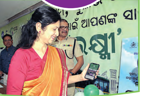
ଯାତ୍ରୀଙ୍କ ନିରାପତ୍ତା ବୃଦ୍ଧି କରିବା ପାଇଁ କୋଡ୍ ସ୍କାନ କରି ଟଙ୍କା ଦେଇ ଯାତ୍ରା ସରକାର ଆଶା ରଖିଛନ୍ତି ।

'ଲକ୍ଷ୍ମୀ' ବସ୍ରେ ଯାତାୟତ ବେଳେ କ୍ୟାସଲେସ୍ ଫେମେସ୍‌କୁ ପ୍ରେସ୍‌ବାହନ ଦିଆଯାଇଛି । ଯାତ୍ରୀମାନେ ନଗଦ ଟଙ୍କା ନ ବେଳ ଯୁବିଆଇ ମାଧ୍ୟମରେ କ୍ୟୁଆର କୋଡ୍ ବ୍ୟବହାର କରି ଜଣ୍ଡା ଅର୍ଥ ଦେଇ ଏହି ବସ୍ରେ ଯାତ୍ରା କରିବାର ସୁବିଧା ପାଇଛନ୍ତି । ପ୍ରଥମେ 'ମୋ ବସ୍'ରେ ଏହି ସୁବିଧା ଆରମ୍ଭ ହୋଇଥିବା ବେଳେ ଗତ ଡିସେମ୍ବର ମାସଠାରୁ ଲକ୍ଷ୍ମୀ ବସ୍ରେ ମଧ୍ୟ ଯାତ୍ରୀଙ୍କୁ ଉନ୍ନତ ସେବା ଯୋଗାଇଦେବା ଉଦ୍ଦେଶ୍ୟରେ ବାଣିଜ୍ୟ ଓ ପରିବହନ ବିଭାଗ ଏବଂ ଓଡ଼ିଶା ରାଜ୍ୟ ସଡ଼କ ପରିବହନ ନିଗମ ପକ୍ଷରୁ 'ଯୁବିଆଇ କ୍ୟୁଆର କୋଡ୍' ବ୍ୟବସ୍ଥା କରାଯାଇଛି । ଏହାଦ୍ୱାରା ଯାତ୍ରୀମାନେ ସୁବିଧାରେ କ୍ୟୁଆର କୋଡ୍ ସ୍କାନ କରି ଟଙ୍କା ଦେଇ ଯାତ୍ରା କରୁଛନ୍ତି । ଜନସାଧାରଣଙ୍କୁ ସହଜ ଯାତ୍ରା ଅନୁଭୂତି ପାଇଁ ଡିଜିଟାଲ୍ ସମାଧାନ ପଛର ଗ୍ରହଣ ସହ ଏହା ଓଡ଼ିଶା ସରକାରଙ୍କ '୫-ଟି' ରୂପାନ୍ତରଣ ଉପକ୍ରମ ସହିତ ସମ୍ପୂର୍ଣ୍ଣ ଭାବେ ଯୋଡ଼ି ହୋଇଛି । ଲକ୍ଷ୍ମୀ କ୍ୟୁଆର କୋଡ୍ ସାହାଯ୍ୟରେ ଲୋକମାନଙ୍କ ପାଇଁ ଫେମେସ୍ ପ୍ରକ୍ରିୟାକୁ ସହଜ କରାଯାଇଛି ଏବଂ ଏହାଦ୍ୱାରା ଯାତାୟତ ଆହୁରି ସରଳ ହେବ ବୋଲି ବିଭାଗ ଲକ୍ଷ୍ୟ ରଖିଛି । ପ୍ରକାଶ ଆଉଟ୍ ରିଲିଜ୍ ବ୍ୟବହାର ଯୋଗ୍ୟ (ୟୁଜିଏଲ୍) 'ଲକ୍ଷ୍ମୀ' କ୍ୟୁଆର କୋଡ୍ ଉପଯୋଗୀମାନଙ୍କ ପାଇଁ ଏକ ସୁରକ୍ଷିତ ଏବଂ ଦକ୍ଷ ଦେଉଥିବା ବୋଲି କହିଛନ୍ତି ।