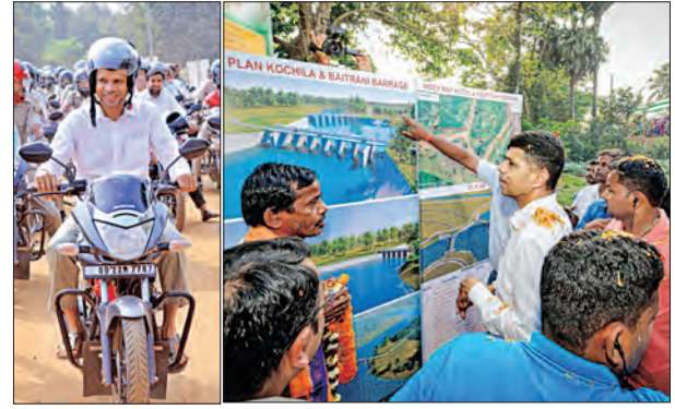
ଅରସରରେ ସେ ଆଖୁଆପଦା ଏବଂ ଆଇଜିଏମ୍ କଲେଜ ପଡ଼ିଆରେ ଅନୁଷ୍ଠିତ ସାଧାରଣ ସଭାରେ ଯୋଗ ଦେଇ ଲୋକକଠାରୁ ବିଭିନ୍ନ ଦାବି

■ ଭଦ୍ରକ/ଲୁଚନେଶ୍ୱର, ୨୪/୧ (ସମ୍ପାଦକ): ରାଜ୍ୟବ୍ୟାପୀ ରୂପାନ୍ତରଣ ପର୍ବ ଜାରି ରହିଥିବା ବେଳେ ମୁଖ୍ୟମନ୍ତ୍ରୀ ନବୀନ ପଟ୍ଟନାୟକ ସମବିକାଶକୁ ଗୁରୁତ୍ୱ ଦେଉଛନ୍ତି। '୫-ଟି' ଉପକ୍ରମ ଆଧାରରେ ବିକାଶମୁକ୍ତ କାର୍ଯ୍ୟକ୍ରମ ଯେପରି ସଠିକ୍ ଭଙ୍ଗରେ କାର୍ଯ୍ୟାନୁଷ୍ଠାନ ହୋଇପାରିବ ସେନେଇ ମୁଖ୍ୟମନ୍ତ୍ରୀଙ୍କ ନିର୍ଦ୍ଦେଶକ୍ରମେ '୫-ଟି' ଅଧ୍ୟକ୍ଷ କାର୍ତ୍ତିକ ପାଣ୍ଡିଆନ୍ ଲଗାତାର ଜିଲ୍ଲା ଗସ୍ତ କରି ଏହାର ସମୀକ୍ଷା କରୁଛନ୍ତି। ଏହିକ୍ରମରେ ମୁଖ୍ୟମନ୍ତ୍ରୀଙ୍କ ନିର୍ଦ୍ଦେଶକ୍ରମେ ଶ୍ରୀ ପାଣ୍ଡିଆନ୍ ଶନିବାର ଭଦ୍ରକ ଗସ୍ତରେ ବିଭିନ୍ନ ବିକାଶମୁକ୍ତ କାର୍ଯ୍ୟର ସମୀକ୍ଷା କରିଛନ୍ତି। ଏହି