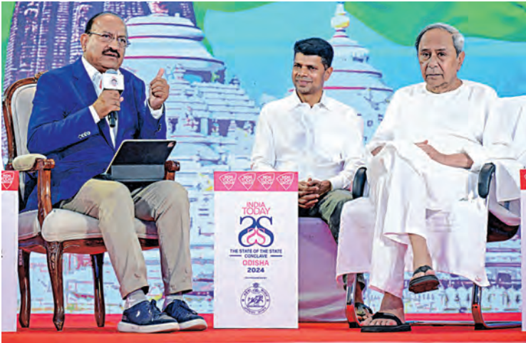
'୫-ଟି' ଆଧାରିତ ଲୋକାଭିମୁଖୀ ଶାସନ ଆମ ସଫଳତାର ମନ୍ତ୍ର ଭୋକର ଭୁଗୋଳରୁ ଖାଦ୍ୟ ବଳକା ରାଜ୍ୟ ହୋଇଛି ଓଡ଼ିଶା ଶୂନ୍ୟ ପୁଞ୍ଜିନିବେଶ ରାଜ୍ୟରୁ ହୋଇପାରିଛି ନିବେଶକଙ୍କ ପ୍ରଥମ ପସନ୍ଦ ଦକ୍ଷିଣ ଏସିଆର ଆଲୁମିନିୟମ କ୍ୟାପିଟାଲ ଓ ଦେଶର ଷ୍ଟିଲ୍ ହବ୍ ଓଡ଼ିଶା

■ ଲୁଚନେଶ୍ୱର, ୨୪/୧ (ସମ୍ପାଦକ): ରାଜ୍ୟର ଉଲ୍ଲେଖନୀୟ ରୂପାନ୍ତରଣ ଓଡ଼ିଶାକୁ ଉତ୍ତରରେ ପହଞ୍ଚାଇଛି। ଅତୀତର ଦୁଃଖକଷ୍ଟ ଓ ହତାଶାକୁ ପଛରେ ପକାଇ ରାଜ୍ୟ ଏବେ ସଫଳତାର ଉତ୍ସବ ପାଳନ କରୁଛି। ସେଥିପାଇଁ ମୁଁ ବେଶ୍ ଆନନ୍ଦିତ। ସମୟାନୁସାରେ ପ୍ରସ୍ତୁତି ଓ ପଦକ୍ଷେପ ଯୋଗୁଁ ଅନେକ ପ୍ରାକୃତିକ ବିପର୍ଯ୍ୟୟକୁ ଦୃଢ଼ତାର ସହିତ ମୁକାବିଲା କରି ପ୍ରତ୍ୟେକ