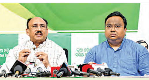
୬ ବର୍ଷରେ ୮୮୦୦୦ ଟଙ୍କା, ୨ ପିଠି ଇନ୍‌ସିଡିଏସ୍ ଘାତନ ବର୍ଷକୁ ବାହାରକୁ ୨୫୦୦ ଟଙ୍କା, ୪ ବର୍ଷରେ ୪୦୦୦ ଟଙ୍କା ନିଯୁକ୍ତି

■ ଭୁବନେଶ୍ୱର, ୨୩।୨ (ସମ୍ବିଧା): ସାତେ ଚାରି କୋଟି ଓଡ଼ିଶାବାସୀଙ୍କୁ ନିଜ ପରିବାର ସଦସ୍ୟ ଭାବେ ଗ୍ରହଣ କରିଥିବା ମୁଖ୍ୟମନ୍ତ୍ରୀ ନବୀନ ପଟ୍ଟନାୟକ ଦେଶର ପ୍ରଥମ ମୁଖ୍ୟମନ୍ତ୍ରୀ ଭାବେ ପ୍ରତ୍ୟେକ ଗରିବ ଲୋକଙ୍କ ସ୍ୱାସ୍ଥ୍ୟ ରକ୍ଷା ସୁନିଶ୍ଚିତ କରିବା ପାଇଁ କାମ କରୁଛନ୍ତି । କୋଭିଡ୍ ପରିଚାଳନା ହେଉ ଅବା ବି-ଏସ୍‌କେଏଲ, ମମତା ସହାୟତା ଯୋଜନା ହେଉ ଅବା ଅପପୁଷ୍ଟି ଦୂର ପାଇଁ ପିଲାମାନଙ୍କ ପାଇଁ ମଧ୍ୟାହ୍ନ ଭୋଜନ, ସମସ୍ତଙ୍କ ଉତ୍ତମ ସ୍ୱାସ୍ଥ୍ୟ ମୁଖ୍ୟମନ୍ତ୍ରୀଙ୍କର ଉଦ୍ଦେଶ୍ୟ । ଏକ