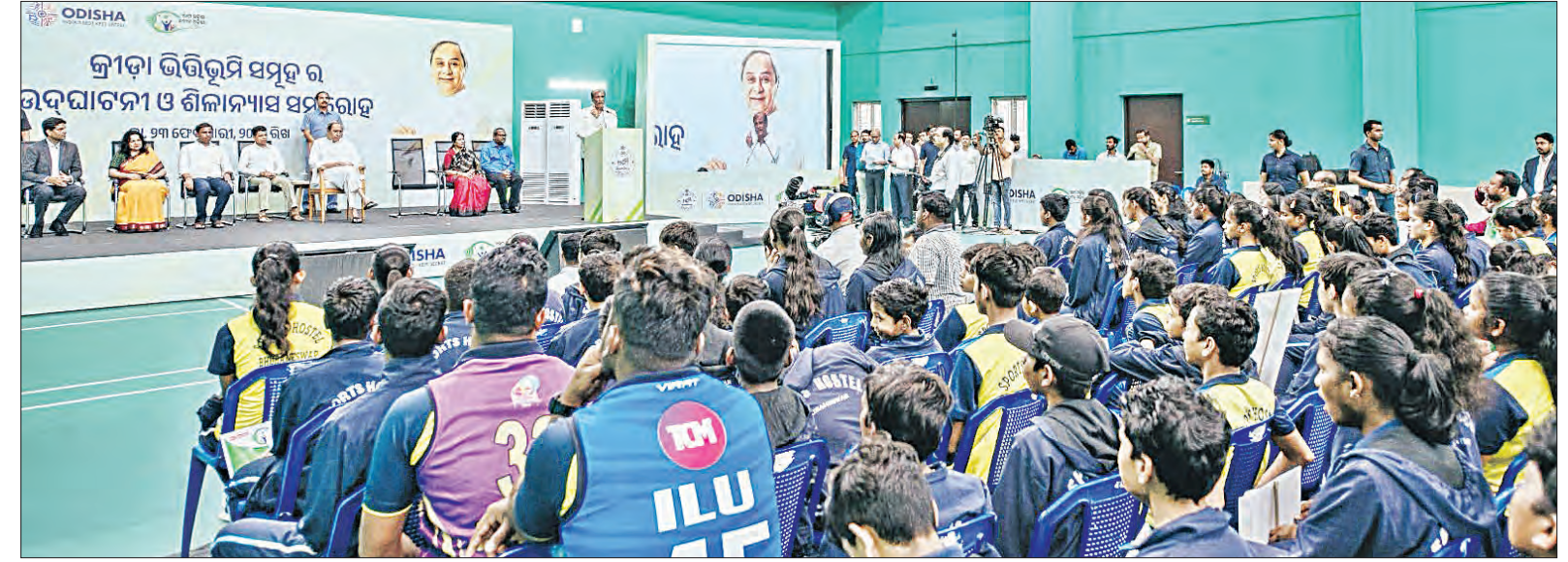
ଶୁଭବାର ଭୁବନେଶ୍ୱରରେ ଅନୁଷ୍ଠିତ କ୍ରୀଡ଼ା ଭିତ୍ତିଭୂମି ସମ୍ବନ୍ଧରେ ଉଦ୍‌ଘାଟନ ଓ ଶିଳାନାମା ସମାବେଶ ।