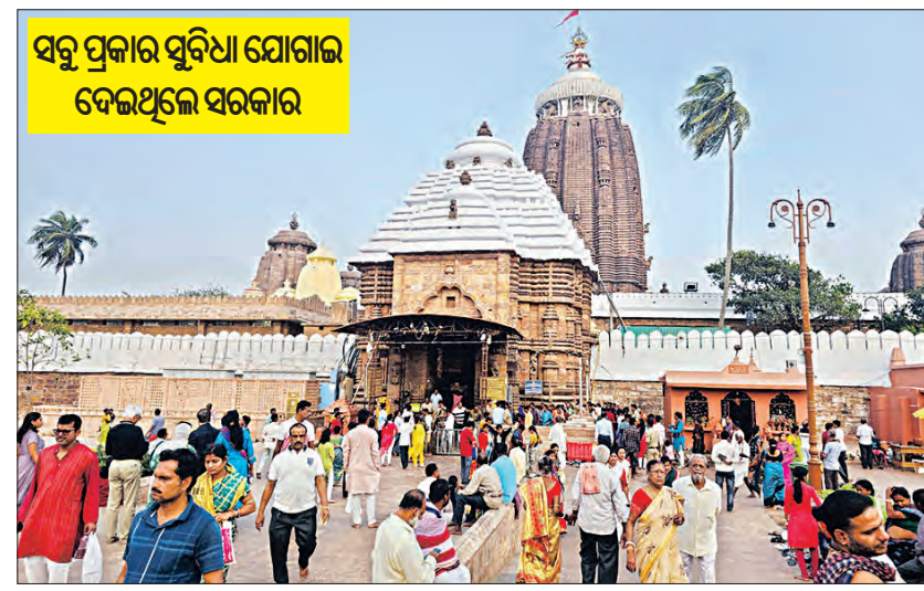
ସବୁ ପ୍ରକାର ସୁବିଧା ଯୋଗାଇ ଦେଇଥିଲେ ସରକାର

■ ପୁରୀ, ୨୩୧୨ (ସମ୍ପାଦକ): କିପରି ହୋଇଛି ଶ୍ରୀମନ୍ଦିର ଚୈତ୍ୟଦ୍ୱାର ବିକାଶ, ପୂର୍ବେ ବହୁଦେଉଳକୁ ଆସିଲେ କିପରି ଥିଲା ଅନୁକୃତି ଆଉ ଏବେ କେଉଁଭଳି ଅନୁଭବ ମିଳୁଛି? ଉପାନ୍ତରୁ ଉପକୂଳ, ଦୁର୍ଗମ ଅଞ୍ଚଳରୁ ସହରାଞ୍ଚଳର ବ୍ୟକ୍ତି କିପରି ଶ୍ରୀକ୍ଷେତ୍ର ଆସି ପରିକ୍ରମା ପ୍ରକଳ୍ପର ଦିବ୍ୟ ଅନୁକୃତି ସାଧିବେ, ସେଥିପ୍ରତି ଆବଶ୍ୟକ ସମସ୍ତ ପ୍ରକାର ସୁବିଧା କରିଥିଲେ ରାଜ୍ୟ ସରକାର। ବିଭିନ୍ନ ଜିଲ୍ଲାରୁ ଭକ୍ତଙ୍କୁ ଆଣି ମହାପ୍ରଭୁଙ୍କ ଦର୍ଶନ ସହ ପରିକ୍ରମା ମାର୍ଗ ବୁଲାଇ ପୁଣି ନେଇ ଘରେ ଛାଡ଼ୁଥିଲେ। ଗତ ମାସ ୨୯ ତାରିଖରୁ ଆରମ୍ଭ ହୋଇଥିବା ଏହି ଅଭିନବ ପଦକ୍ଷେପ ଶୁକ୍ରବାର ଶେଷ ହୋଇଛି। ଅନ୍ତିମ ଦିବସରେ କରଗଡ଼ ଜିଲ୍ଲାରୁ ୩,୦୦୦ ଶ୍ରୀକାଳୁ ଚତୁର୍ଥ ଗ୍ରହଙ୍କୁ ଦର୍ଶନ ସହ ପରିକ୍ରମା ମାର୍ଗ ବୁଲିଛନ୍ତି। ଏହି ଶ୍ରୀକାଳୁମାନେ ବସ୍ରେ ଆସି ସମଗ୍ର ପାକିରେ ପହଞ୍ଚିଥିଲେ। ସେଠାରୁ ଫିଡ଼ର ବସ୍ରେ ଭକ୍ତମାନେ ଜଗନ୍ନାଥ ବନ୍ଦନ ପିଲାଦିନ ସେଖର (କେବିପିସି)ରେ ପହଞ୍ଚିଥିଲେ। ପରେ ଶ୍ରୀତୀର୍ଥ ଦେଇ ଶ୍ରୀମନ୍ଦିର ନିକଟରେ ପହଞ୍ଚି ମହାପ୍ରଭୁଙ୍କୁ ଦର୍ଶନ କରିଥିଲେ। ଏହାପରେ ପରିକ୍ରମା ମାର୍ଗ ପ୍ରଦକ୍ଷିଣା କରି ଦିବ୍ୟ ଅନୁକୃତି ସାଧିଥିଲେ। ଏହାପରେ ଶ୍ରୀକାଳୁ ସମଗ୍ର ପାକିରେ ପହଞ୍ଚି ସେଠାରେ ଭୋଜନ