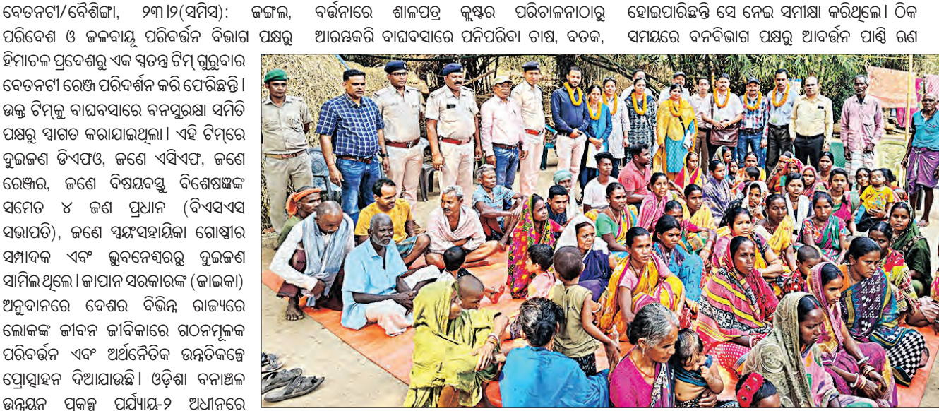
ବେତନଟୀ/ବୈଶିଙ୍ଗା, ୨୩।୨(ସମ୍ବିଧ): ଉଚ୍ଚମ, ବର୍ତ୍ତମାନରେ ଶାଳପତ୍ର କୁଷ୍ଠର ପରିଚାଳନାଠାରୁ ହୋଇପାରିଛନ୍ତି ସେ ନେଇ ସମାକ୍ଷା କରିଥିଲେ। ଠିକ୍ ସମୟରେ ବନବିଭାଗ ପକ୍ଷରୁ ଆବର୍ତ୍ତନ ପାଣ୍ଠି ରଖି ଦିଆଯାଇ ପାରେ।