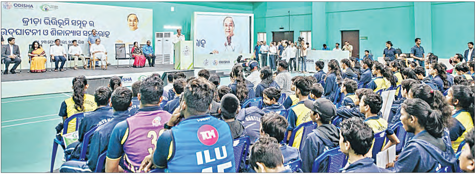
ଶୁକ୍ରବାର ଭୁବନେଶ୍ୱରରେ କ୍ରୀଡ଼ା ଭିତ୍ତିକୃମି ସମୂହର ଉଦଘାଟନ ଓ ଶିଳାମ୍ୟାସ ସମାବେଶ ।