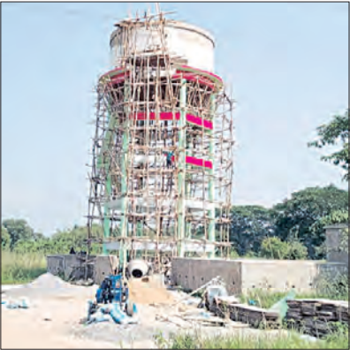
ଜଳଯୋଗାଣ ବିଭାଗ ପକ୍ଷରୁ ପ୍ରତ୍ୟକ୍ ପଞ୍ଚାୟତରେ ଜଳ ପ୍ରକଳ୍ପ ମାନ ନିର୍ମାଣ ହୋଇଥିଲେ ସୁଦ୍ଧା ତାହା କେବଳ ଠିକାଦାର ଯୋଗ୍ୟ ପାଇଁ ପ୍ରସ୍ତୁତ ହୋଇଛି। ପ୍ରତ୍ୟକ୍ ବର୍ଷ ବୃହତ୍ ପାଣି ଟାଙ୍କି ନିର୍ମାଣ ଓ ପାଇପ ବିଛାଇବାରେ ସତେ ସେମିତି ପାନୀୟ ଜଳ ଯୋଗାଣ

ପାନୀୟ ଜଳ ଯୋଗାଣ ପାଇଁ ପଞ୍ଚାୟତରୁ ଲକ୍ଷ ଲକ୍ଷ ଟଙ୍କା ବାର୍ଷିକ ବିଦ୍ୟୁତ ବିଲ ପୈଠ ହେଉଛି। ମେଗା ପାନୀୟ ଜଳ ପ୍ରକଳ୍ପ, ବୃହତ୍ ପାଣି ଟାଙ୍କି ନିର୍ମାଣ, ପାଇପ ବିଛା ଓ ଟ୍ୟାପ ନିର୍ମାଣ ହୋଇଥିଲେ ସୁଦ୍ଧା ବର୍ଷ ବର୍ଷ ଧରି ଲୋକେ ପାନୀୟ ଜଳ ପାଇବାରୁ ବଞ୍ଚିତ ହୋଇଛନ୍ତି। ଏମିତି ପାନୀୟ ଜଳର ଉତ୍ପାଦନ ସମୟାନ୍ତରାଳୀ ମିଳିଛି ଉତ୍ପାଦନା ଯୋଗ୍ୟ ବୃଦ୍ଧି ପ୍ରକଳ୍ପରେ ପଞ୍ଚାୟତ ଅଞ୍ଚଳରେ। ସୂଚନା ଅନୁଯାୟୀ ବୃଦ୍ଧି ବାସୀଙ୍କୁ ଶୁଦ୍ଧ ପାନୀୟ ଜଳ ଯୋଗାଣ ପାଇଁ ସରକାର ୨୦୧୬ ମସିହାରେ ଆଖୁଆପଦା ବିଚାରଣା ନଦୀରେ ମେଗା ପାନୀୟ ଜଳ ପ୍ରକଳ୍ପ ନିର୍ମାଣ କରିଥିଲେ। ନଦୀକୂଳରେ ଜଳ ପ୍ରକଳ୍ପ ଗୃହ ନିର୍ମାଣ ସହିତ କେତେକ ଅଞ୍ଚଳକୁ ପାଇପ ବିଛା କରିଥିଲେ ସୁଦ୍ଧା ଲୋକ ମାନେ କିନ୍ତୁ ଏପର୍ଯ୍ୟନ୍ତ ଶୁଦ୍ଧ ପାନୀୟ ଜଳ ପାଇପାରିନାହାନ୍ତି। ଏହାଛଡା ଭଦ୍ରକ ଗ୍ରାମ୍ୟ