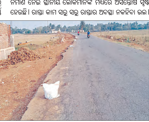
ନିର୍ମାଣ ବେଳେ ସ୍ଥାନୀୟ ଲୋକମାନଙ୍କ ମଧ୍ୟରେ ଅସହ୍ୟ ସୃଷ୍ଟି ହେଉଛି। ରାସ୍ତା କାମ ସରୁ ସରୁ ରାସ୍ତାର ଅବସ୍ଥା ନକହିବା ଭଳି ୫କୋଟି ଟଙ୍କାର ଅନୁଦାନ ରାଶି ନିର୍ମାଣ ହୋଇଥିବା ରାସ୍ତାଟି ୫ ମାସ ମଧ୍ୟ ଗଲା ନାହିଁ। ତେଣୁ ଖୁବ୍ ଶୀଘ୍ର ଉଚ୍ଚିକାନ୍ତ ତଦନ୍ତ କରି କାର୍ଯ୍ୟାନ୍ୱୟାନ ଗ୍ରହଣ କରିବାକୁ ଜନସାଧାରଣ ଦାବି କରିଛନ୍ତି।

ଅସୁରାଳି, ୨୩୧୨ (ସମିତ): ଧାମନଗର ବ୍ଲକ ଝାଟିଆସାହି ଠାରୁ ମଙ୍ଗଳପୁର ପର୍ଯ୍ୟନ୍ତ ରାସ୍ତାଟି ବ୍ଲକର ଏକ ବ୍ୟସ୍ତବହୁଳ ଗୁରୁତ୍ୱପୂର୍ଣ୍ଣ ରାସ୍ତା। ଦୀର୍ଘ ଦିନ ଧରି ରାସ୍ତା ଅତି ବିପଦଫଳକୁ ଅବସ୍ଥାରେ ଥିଲା। ଏ ସମ୍ପର୍କରେ ବିଭିନ୍ନ ଗଣମାଧ୍ୟମରେ ପ୍ରକାଶ ପାଇବା ପରେ ପ୍ରଶାସନିକ ଦୃଷ୍ଟି ପଡ଼ିଲା। ୭.୧୦କି.ମି. ରାସ୍ତା ନିର୍ମାଣ କାର୍ଯ୍ୟ ସମାପନ ହୋଇଛି। କୋଟି କୋଟି ଟଙ୍କା ଅନୁଦାନ ବ୍ୟୟରେ ନିର୍ମାଣ ହେଉଥିବା ଏହି ରାସ୍ତା କାର୍ଯ୍ୟର ତଦାରଖ କରିବାକୁ କେହି ନ ଥିବା ଭଳି ମନେ ହେଉଛି। ଏ ସମ୍ପର୍କରେ ପ୍ରଶାସନିକସ୍ତରରେ ଅଭିଯୋଗ ହୋଇଥିଲେ ବି ବିଭାଗୀୟ ଅଧିକାରୀଙ୍କ ନିରବତା ସହେତୁ ଦୂରାନ୍ତ କରୁଛି। ଅତି ମନ୍ଦର ଗତିରେ ରାସ୍ତା ନିର୍ମାଣ କରାଯାଇଛି। ୫କୋଟିରୁ ଅଧିକ ଟଙ୍କା ଅନୁଦାନ ଏହି ରାସ୍ତା ପାଇଁ ଯୋଗାଇ ଦିଆ ଯାଇଥିବାବେଳେ ବିଳମ୍ବିତ କାର୍ଯ୍ୟ ସମାପନ ପାଇଁ ଲୋକେ ହତସ୍ତ ହୋଇଛନ୍ତି। ନିମ୍ନୋକ୍ତ ଟିଏସ୍. ମେଟାଲ ଓ ପରିମାଣରେ ସମ୍ପୂର୍ଣ୍ଣ ତଞ୍ଜକତା ହୋଇଛି। ରାସ୍ତା