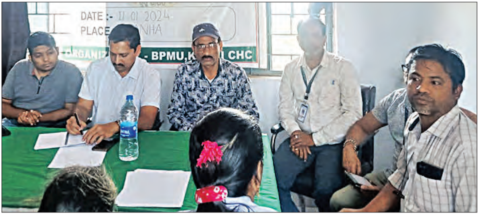
ସମ୍ମାନ କ୍ରମେ ମଧ୍ୟ ୨ ଜଣଙ୍କ ଅବସ୍ଥା ଗୁରୁତର ହେବାରୁ ବିଭିନ୍ନ ଭୋଜି ଭାତ ଚାଲୁଥିବାରୁ ଏକଜି ଝାଡ଼ାବାନ୍ଧି ଓ କଟକ ବଡ଼ ମେଡିକାଲ ସ୍ଥାନାନ୍ତରିତ କରାଯାଇଥିବା ସୂଚନା ପେଟଯନ୍ତ୍ରଣା ହୋଇଥିଲେପାଇଁ ବୋଲି ସମେତ କରାଯାଇଛି।