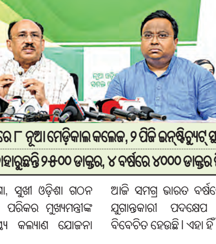
୬ ବର୍ଷରୁ ୮୮ ମୂଆଁମେଡ଼ିକାଲ କଲେଜ, ୨ ପିଲି ଇନ୍‌ଷ୍ଟିଚ୍ୟୁଟ୍ ଘାତନ ବର୍ଷକୁ ବାହାରକୁ ୨୫୦୦ ଡାକ୍ତର, ୪ ବର୍ଷରେ ୪୦୦୦ ଡାକ୍ତର ନିଯୁକ୍ତି

■ ଭୁବନେଶ୍ୱର, ୨୩।୨ (ଏମିସି): ସାତେ ଚାରି କୋଟି ଓଡ଼ିଶାବାସୀଙ୍କୁ ନିଜ ପରିବାର ସଦସ୍ୟ ଭାବେ ଗ୍ରହଣ କରିଥିବା ମୁଖ୍ୟମନ୍ତ୍ରୀ ନବାନ ପଟ୍ଟନାୟକ ଦେଶର ପ୍ରଥମ ମୁଖ୍ୟମନ୍ତ୍ରୀ ଭାବେ ପ୍ରତ୍ୟେକ ଗରିବ ଲୋକଙ୍କ ସ୍ୱାସ୍ଥ୍ୟ ରକ୍ଷା ସୁନିଶ୍ଚିତ କରିବା ପାଇଁ କାମ କରୁଛନ୍ତି । କୋଭିଡ୍ ପରିଚାଳନା ହେଉ ଅବା ବିଏସକେଏଲ, ମମତା ସହାୟତା ଯୋଜନା ହେଉ ଅବା ଅପପୁଷ୍ଟି ଦୂର ପାଇଁ ପିଲାମାନଙ୍କ ପାଇଁ ମଧ୍ୟାହ୍ନ ଭୋଜନ, ସମସ୍ତଙ୍କ ଉତ୍ତମ ସ୍ୱାସ୍ଥ୍ୟ ମୁଖ୍ୟମନ୍ତ୍ରୀଙ୍କର ଉଦ୍ଦେଶ୍ୟ । ଏକ