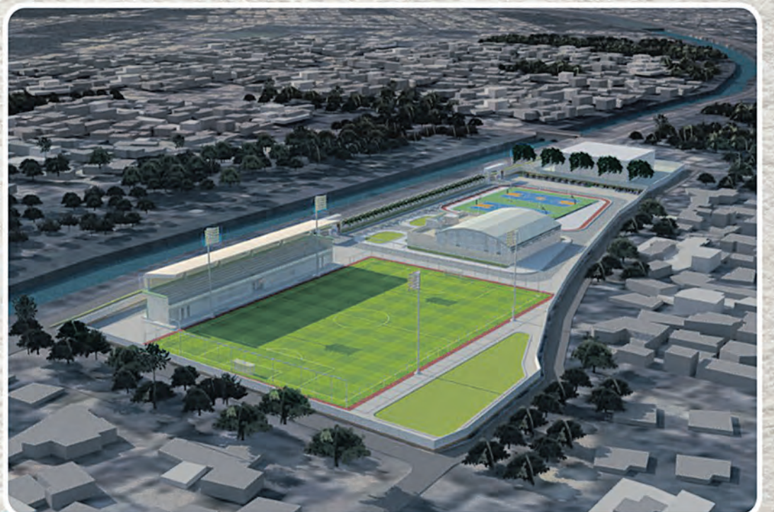
ପୁଟବଲ ପ୍ରଶିକ୍ଷଣ କେନ୍ଦ୍ର, କଟକ