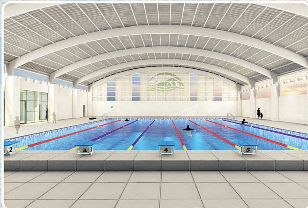
ଇନ୍ଡୋର ସୁଇମିଂ ପୁଲ, ଭଦ୍ରକ