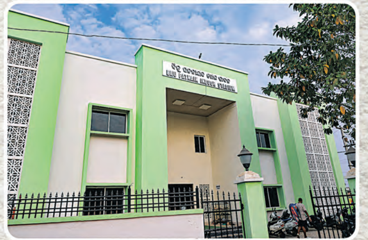
ବହୁମୁଖୀ ଇନ୍ଡୋର ହଲ, ଭବାନୀପାଟଣା