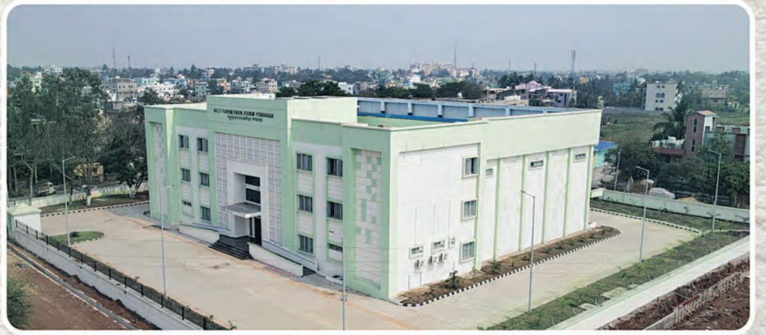
୪୮ଟି ବହୁମୁଖୀ ଇନ୍ଡୋର ଷ୍ଟାଡ଼ିୟମ