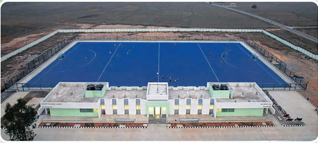
୧୨ଟି ହକି ପ୍ରଶିକ୍ଷଣ କେନ୍ଦ୍ର