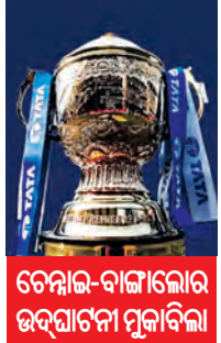
ଚେନ୍ନାଇ-ବାଙ୍ଗାଲୋର ଉଦ୍‌ଘାଟନା ମୁକାବିଲା

ମୁମ୍ବାଇ, ୨୦/୧ (ଏକ୍ସପ୍ରେସ୍): ବିଶ୍ୱର ସବୁଠାରୁ ବ୍ୟୟ ବହୁଳ ପ୍ରାଥମିକତାଗତ ଟି-୨୦ ପ୍ରତିଯୋଗିତା ଇଣ୍ଡିଆନ ପ୍ରିମିୟର ଲିଗ୍ (ଆଇପିଏଲ୍)ର ଆଗାମୀ ୧୭ତମ ସଂସ୍କରଣ ପାଇଁ କାର୍ଯ୍ୟସୂଚୀ ଜାରି କରାଯାଇଛି । ଦେଶରେ ସାଧାରଣ ନିର୍ବାଚନ ଆୟୋଜନ ହେବାର କାର୍ଯ୍ୟକ୍ରମ ଥିବାରୁ ଲିଗ୍‌ରେ ସମ୍ପୂର୍ଣ୍ଣ କାର୍ଯ୍ୟସୂଚୀ ଜାରି କରାଯାଇନାହିଁ । ଗୁରୁବାର ଲିଗ୍‌ରେ ପ୍ରଥମ ୨୧ଟି ମ୍ୟାଚ୍‌ର କାର୍ଯ୍ୟସୂଚୀ ଘୋଷଣା ହୋଇଛି । ଲୋକସଭା ନିର୍ବାଚନର ତାରିଖ ଘୋଷଣା ହେବା ପରେ ଲିଗ୍‌ର ଦ୍ୱିତୀୟ ଯର୍ଯ୍ୟାଦ କାର୍ଯ୍ୟସୂଚୀ ଘୋଷଣା କରାଯିବ । ଏଥର ଏହି ହାଇପ୍ରୋଟାଇଲ ଲିଗ୍ ମାର୍ଚ୍ଚ ୨୨ରୁ ଆରମ୍ଭ ହେବ । ଉଦ୍‌ଘାଟନା ମୁକାବିଲାରେ ଗଡ଼ଅରର ଚାମ୍ପିଅନ ଚେନ୍ନାଇ ସୁପର କିଙ୍ଗ୍‌ସ୍ ଓ ରୟାଲ ଚ୍ୟାଲେଞ୍ଜର୍ସ ବାଙ୍ଗାଲୋର ମୁହାଁମୁହିଁ ହେବେ ।