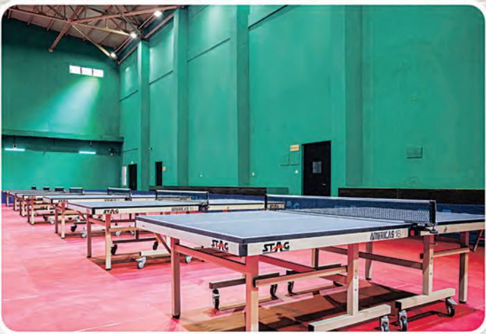
ଟେବୁଲ ଟେନିସ୍ ଏକାଡେମୀ, କଟକ