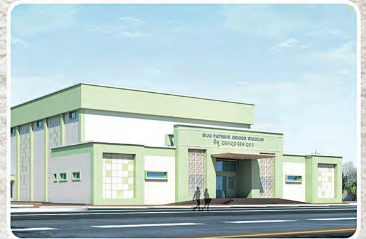
ବହୁମୁଖୀ ଇନ୍ଡୋର ଷ୍ଟାଡ଼ିୟମ ରେମୁଣା, ବାଲିଗୁଡ଼ା, କରଞ୍ଜିଆ ଓ ଚିଟିଲାଗଡ଼