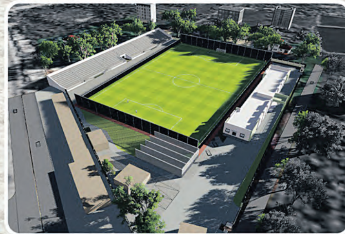
ମହିଳା ପୁଟବଲ ପ୍ରଶିକ୍ଷଣ କେନ୍ଦ୍ର, ଆଳି, କେନ୍ଦ୍ରାପଡ଼ା