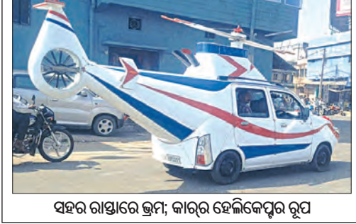
ସହର ରାସ୍ତାରେ ଭ୍ରମ: କାରର ହେଲିକପ୍ଟର ରୂପ