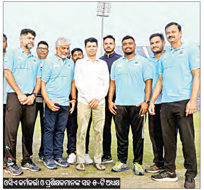
ଓସିଏ କର୍ମଚାରୀ ଓ ପ୍ରଶିକ୍ଷକମାନଙ୍କ ସହ ୫-ଟି ଅଧ୍ୟକ୍ଷ