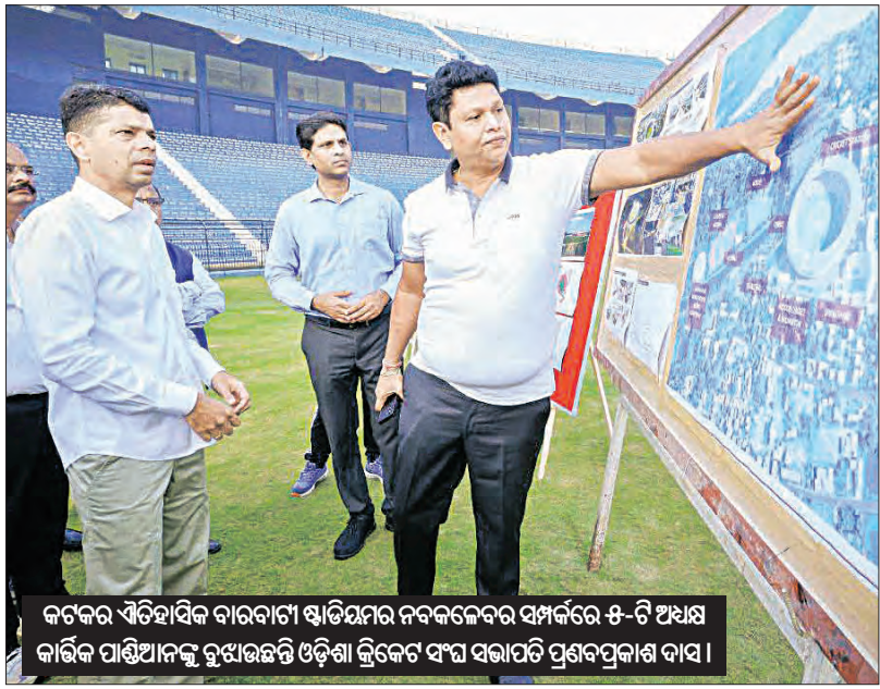
କଟକର ଐତିହାସିକ ବାରବାଟୀ ଷ୍ଟାଡ଼ିୟମର ନବକଳେବର ସମ୍ପର୍କରେ ୫-ଟି ଅଧ୍ୟକ୍ଷ କାର୍ଯ୍ୟକ୍ରମ ପାଇଁ ଆଜି ଉଦ୍ଘାଟନୀୟ ଉଦ୍ଘାଟନୀୟ କ୍ରିକେଟ୍ ସଂଘ ସଭାପତି ପ୍ରଶାନ୍ତକୃଷ୍ଣ ଦାସ ।