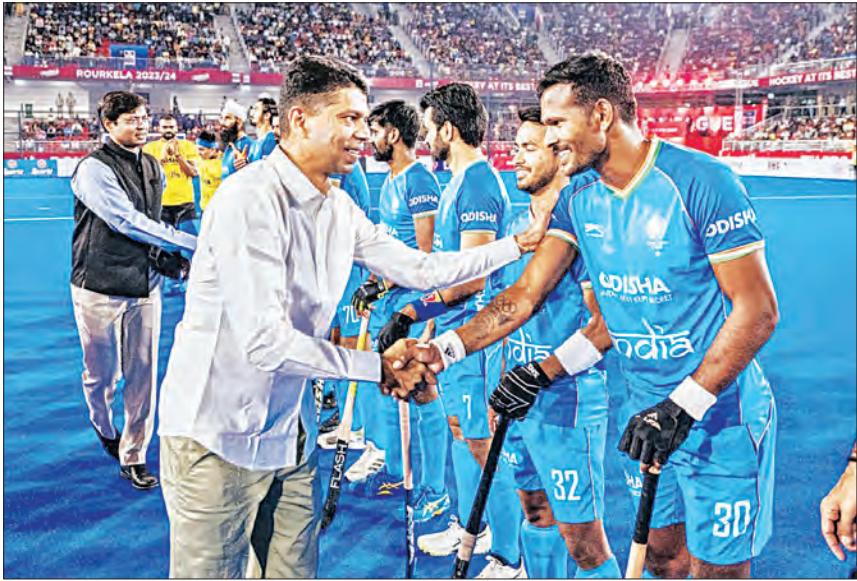
ରାଉଜକୋଲ୍/ଭୁବନେଶ୍ୱର, ୨୧/୨ (ସମ୍ବାଦ)

ରାଉଜକୋଲ୍‌ରେ ବିର୍ଯ୍ୟା ମୁଣ୍ଡା ହଳି ଷ୍ଟାଡ଼ିୟମରେ ରୁଧିବାର ଖେଳାଯାଇଥିବା ଏସଆଇଏର୍ ପୁରୁଷ ପ୍ରୋ ଲିଗ୍‌ର ଏକ କଡ଼ା ଫାଇନାଲ୍‌ରେ ନେଦରଲାଣ୍ଡସ୍ ସୁର୍ ଆଉଟ୍ରେ ୪-୨ (୧-୧) ଗୋଲରେ ଘରୋଇ ଭାରତୀୟ ଦଳକୁ ପରାସ୍ତ କରିଛି। ଏହି ମ୍ୟାଚରେ ନିର୍ଦ୍ଧାରିତ ସମୟାବଳୀ ସୁଦ୍ଧା ଉଭୟ ଦଳ ଗୋଟିଏ ଲେଖାଏ ଗୋଲ ଦେଇଥିଲେ। ଶେଷରେ ପଳାପଳ ପାଇଁ ସୁର୍ ଆଉଟ୍ରେ ସହାୟତା ନିଆଯାଇଥିଲା। ଏଥିରେ ନେଦରଲାଣ୍ଡସ୍ ୪ଟି ଗୋଲ ଦେଇଥିବାବେଳେ ଭାରତ ମାତ୍ର ୨ଥର ବଲକୁ ନେତୃ ମଧ୍ୟକୁ ପଠାଇପାରିଥିଲା। ଏହି ବିଜୟ