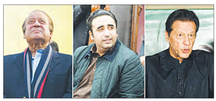
(ପିଏମଏଲ୍-ଏନ) ଏବଂ ଆସିପ ଅଲି ମଧ୍ୟରେ ମେଣ୍ଟ ଆଖଙ୍କା ରୂପିବରେ ଲାଗିଛି। ଜରଦାରୀଙ୍କ ପାକିସ୍ତାନ ପିପୁଲ୍ ପାର୍ଟି (ପିପିପି) ଉଭୟ ଦଳ ମଧ୍ୟରେ ୫ ଥର ଆଲୋଚନା

ପାକିସ୍ତାନ ସାଧାରଣ ନିର୍ବାଚନର ପକାପକ ୧୧ ଦିନ ହେଲା ବାହାରିଲାଣି। ଏହା ସତ୍ତ୍ୱେ ଏ ପର୍ଯ୍ୟନ୍ତ ସରକାର ଗଠନ ହୋଇପାରି ନାହିଁ। କୌଣସି ଦଳକୁ ସ୍ପଷ୍ଟ ବହୁତମ ମିଳିପାରି ନ ଥିବାରୁ ସରକାର ଗଠନ ପାଇଁ ଅଳକଷ୍ୟ ଜାରି ରହିଛି। ଇମ୍ରାନଙ୍କ ଦଳ ପିଟିଆଇକୁ ପାକିସ୍ତାନ ସେନା ସରକାର ଗଠନ କରିବାକୁ ଦେଖନାହିଁ। ଏହି ଦଳ ପୁଣି ଶେମତାକୁ ଆସୁ ବୋଲି ସେନା ଚାହୁଁନାହିଁ। ମାତ୍ର ସେନା ସମର୍ଥନ ନଖାକ ସରିପକ ପାକିସ୍ତାନ ମୁସଲିମ ଲିଗ-ନଖାକ