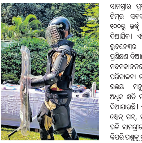
୧୮ ଟିମ୍ରେ ରହିବେ ବନ ବିଭାଗର ୪୦ ବର୍ଷରୁ କମ ବୟସର ଯୁବ କର୍ମଚାରୀ

■ ଭୁବନେଶ୍ୱର, ୨୦୧୯ (ସମ୍ପାଦକ): ରାଜ୍ୟରେ ବନ୍ୟପ୍ରାଣୀ-ମନୁଷ୍ୟ ସଂଘର୍ଷକୁ ରୋକିବା ସହ ଧନକାରକ କ୍ଷୟରୁ ରକ୍ଷା କରିବା ପାଇଁ ବନ ବିଭାଗ ଏକ ସ୍ୱତନ୍ତ୍ର ପଦକ୍ଷେପ ସ୍ୱରୂପ ୧୮ ଟି ରାପିଡ୍ ରେସ୍ପନ୍ସ ଟିମ୍ (ଆରଆରଟି) ଗଠନ କରିବାକୁ ନିଷ୍ପତ୍ତି ନେଇଛି।