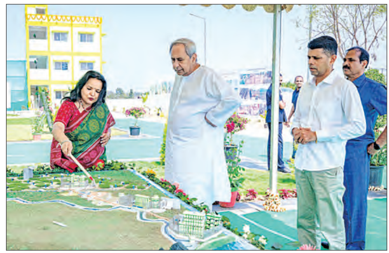
ବରଗଡ଼ ଜିଲ୍ଲାରେ ୨୧୪୯ କୋଟି ଟଙ୍କାର ୨୨ଟି ବିଭିନ୍ନ ପ୍ରକଳ୍ପ ଉଦ୍ଘାଟିତ ଜଳସେଚିତ ହେବ ୪ ବୁଲ୍ଲର ୬୦ ହଜାର ଏକର ଜମି ୨୨.୭୮ କୋଟି ଟଙ୍କା ବ୍ୟୟରେ ଦୁହିଁହନାଥ ପାଠର ରୂପାନ୍ତରଣ ୨୨୩ କୋଟି ଟଙ୍କା ବ୍ୟୟରେ ୨୧ଟି ନୂତନ ପ୍ରକଳ୍ପର ଉଦ୍ଘାଟନ ସ୍ଥାପନ

■ ଭୁବନେଶ୍ୱର/ବରଗଡ଼, ୨୦୧୯ (ସମ୍ପାଦକ): କଳା ଓ ସଂସ୍କୃତିର ଛୁମ୍ବିତ ବରଗଡ଼ରେ ଆରମ୍ଭ ହୋଇଛି ବିକାଶର 'ନବୀନ' ପର୍ବ। ମୁଖ୍ୟମନ୍ତ୍ରୀ ନବୀନ ପଟ୍ଟନାୟକ ମଙ୍ଗଳବାର ଐତିହାସିକ ଗଙ୍ଗାଧର ମେହେର ଜଳସେଚନ ପ୍ରକଳ୍ପର ଲୋକାର୍ପଣ କରିଛନ୍ତି।