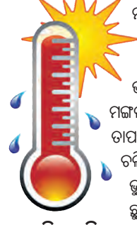
ଆହୁରି ଦୁଇଦିନ ହଜିବ ବର୍ଷର ଚାଟି ୨୨ରୁ ପଶିମା ଝଡ଼ ପ୍ରଭାବରେ ବର୍ଷା

■ ଭୁବନେଶ୍ୱର, ୨୦୧୯ (ସମ୍ପାଦକ): ମାଘ ସମ୍ପର୍କରେ ରାଜ୍ୟରେ ଏବେଠୁ ଗ୍ରୀଷ୍ମ ପ୍ରବାହ ଆରମ୍ଭ ହୋଇଗଲାଣି।