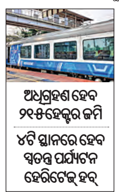
ଅଧିଗ୍ରହଣ ହେବ ୨୧୫ କୋଟିର ଜମି ୪ଟି ସ୍ଥାନରେ ହେବ ସ୍ୱତନ୍ତ୍ର ପର୍ଯ୍ୟଟନ ହେରିଟେଜ୍ ହବ୍

■ ଭୁବନେଶ୍ୱର, ୨୦୧୯ (ସମ୍ପାଦକ): ଶ୍ରୀକ୍ଷେତ୍ରରୁ ଅର୍କ୍ଷେତ୍ର ଗଢ଼ିବ ଟ୍ରେନ୍ ନିର୍ମାଣ କାମ ଆରମ୍ଭ ହେବ। କେନ୍ଦ୍ର ରେଳ ଅର୍କ୍ଷେତ୍ର କୋଣାର୍କକୁ ଗଢ଼ିବ ଟ୍ରେନ୍ ନିର୍ମାଣ କାମ ଆରମ୍ଭ ହେବ।