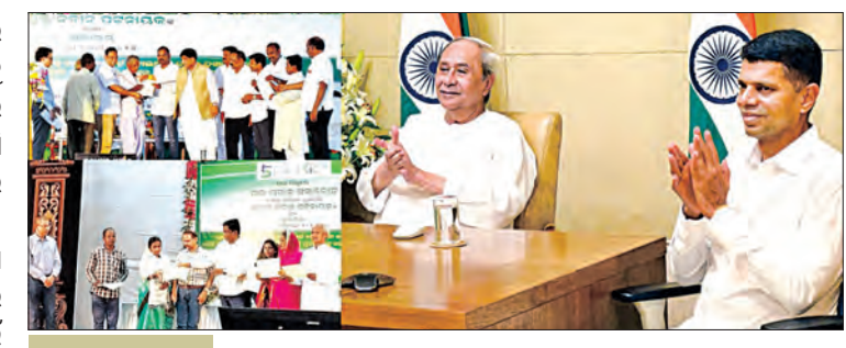
୨୭ ଜିଲ୍ଲାର ୧୦ ହଜାର ଚାଷୀଙ୍କୁ ଜମି ପଢ଼ା ଦେଇ ମୁଖ୍ୟମନ୍ତ୍ରୀ ଜମି ପଢ଼ା ପାଇବେ ୨୭ ଜିଲ୍ଲାର ୨ଲକ୍ଷ ୫୦ ହଜାର ଚାଷୀ '୫-ଟି' ଅଧ୍ୟକ୍ଷ ଜିଲ୍ଲା ଗସ୍ତ ବିଧିରେ ସମସ୍ୟାର ସମାଧାନ ଆଇନର ସଂଶୋଧନ କରାଯାଇ ଦୂରହୋଇଛି ଗଞ୍ଜାମର ୧୦୦ ବର୍ଷର ଗ୍ରାମିଣଙ୍କୁ ଜମି ସମସ୍ୟା ଲୋକଙ୍କ ସେବା, ଲୋକଙ୍କୁ ସଶକ୍ତ କରିବା ପାଇଁ, ଲୋକଙ୍କ ହିତ ସକାଶେ ଆଇନର ସଂଶୋଧନ କରାଯିବ। ଜରୁରୀ: '୫-ଟି' ଅଧ୍ୟକ୍ଷ

■ ଭୁବନେଶ୍ୱର, ୨୦୧୯ (ସମ୍ପାଦକ): ସିକିମ୍ ରୟତମାନଙ୍କ ଜମି ଉପରେ ସ୍ୱତ୍ୱାଧିକାରକୁ ସ୍ୱୀକୃତି ଭାବେ ମଙ୍ଗଳବାର ରାଜ୍ୟ ସରକାର ସେମାନଙ୍କୁ ଜମି ପଢ଼ା ବଣ୍ଟନ କରିଛନ୍ତି।