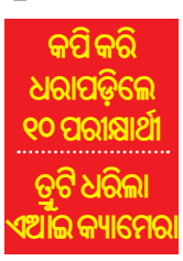
କପି କରି ଧରାପଡ଼ିଲେ ୧୦ ପରୀକ୍ଷାର୍ଥୀ ତୁଟି ଧରିଲା ଏଆଇ କ୍ୟାମେରା

■ କଟକ, ୨୦୧୯ (ସମ୍ପାଦକ): ମାଧ୍ୟମିକ ଶିକ୍ଷା ପରିଷଦ (ବୋର୍ଡ) ଦ୍ୱାରା ପରିଚାଳିତ ମାଟ୍ରିକ୍ ପରୀକ୍ଷା ମଙ୍ଗଳବାରଠାରୁ ଆରମ୍ଭ ହୋଇଛି।