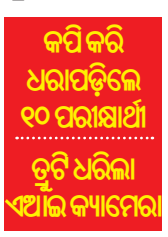
କମ୍ କରି ଧରାପଡ଼ିଲେ ୧୦ ପରୀକ୍ଷାର୍ଥୀ ତୁଟି ଧରିଲା ଏଥାଇ କ୍ୟାମେରା