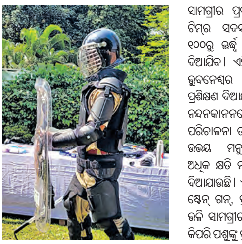
ଟିମ୍‌ରେ ରହିବେ ବନ ବିଭାଗର ୪୦ ବର୍ଷରୁ କମ୍ ବୟସର ଯୁବ କର୍ମଚାରୀ ମାର୍ଚ୍ଚ ସୁଦ୍ଧା ତାଲିମ ଶେଷ, ଏପ୍ରିଲରୁ କାର୍ଯ୍ୟକ୍ରମ ଉଠାଇ ଆରମ୍ଭ । ଏ ସମ୍ପର୍କରେ ମଙ୍ଗଳବାର ନବନିର୍ଦ୍ଧାରିତ ପ୍ରାଣୀ ଉଦ୍ଧାରକମାନେ ଏହି ଟିମ୍‌ରେ ସହଯୋଗୀ ଭାବେ ସେମାନେ ବ୍ୟବହାର କରିବାକୁ ଥିବା ଅତ୍ୟାଧୁନିକ ଯନ୍ତ୍ରପାତି ବ୍ୟବହାର କରିବେ । ଏହାଛଡ଼ା ବିଭିନ୍ନ ସମୟରେ ଜଙ୍ଗଲ ମଧ୍ୟରେ ବିପଦରେ ପଡ଼ି ରହିଥିବା ବନ୍ୟଜନ୍ତୁଙ୍କ ଉଦ୍ଧାର କାର୍ଯ୍ୟରେ ନିୟୋଜିତ ହେବେ ବୋଲି ବିଭାଗ ପକ୍ଷରୁ କୁହାଯାଇଛି ।

ଭୁବନେଶ୍ୱର, ୨୦୧୯ (ସମ୍ପାଦକ): ରାଜ୍ୟରେ ବନ୍ୟପ୍ରାଣୀ-ମନୁଷ୍ୟ ସଂଘର୍ଷକୁ ରୋକିବା ସହ ଧନକାରକ କ୍ଷୟରୁ ରକ୍ଷା କରିବା ପାଇଁ ବନ ବିଭାଗ ଏକ ସ୍ୱତନ୍ତ୍ର ପଦକ୍ଷେପ ସ୍ୱରୂପ ୧୮ ଟି ରାପିଡ୍ ରେସ୍‌ପନ୍ସ ଟିମ୍ (ଆରଆରଟି) ଗଠନ କରିବାକୁ ନିଷ୍ପତ୍ତି ନେଇଛି । ୪୦ ବର୍ଷରୁ କମ୍ ଯୁବ କର୍ମଚାରୀଙ୍କୁ ଏହି ଟିମ୍‌ରେ ସାମିଲ କରାଯାଇ ସେମାନଙ୍କୁ ତାଲିମ ଦିଆଯାଇଛି । ପ୍ରତି ଟିମ୍‌ରେ ୬ ଜଣ ଯୁବ କର୍ମଚାରୀଙ୍କ ସମେତ ଜଣେ ଡେପୁଟି ରେଜିଷ୍ଟ୍ରାର ସହାୟକ ଅଧିକାରୀ ରହିବେ । ମୁଖ୍ୟମନ୍ତ୍ରୀ ନବୀନ ପଟ୍ଟନାୟକଙ୍କ ନିର୍ଦ୍ଦେଶାବଳୀରେ ପ୍ରାଣୀ ଉଦ୍ଧାରକମାନେ ଏହି ଟିମ୍‌ରେ ସହଯୋଗୀ ଭାବେ ସେମାନେ ବ୍ୟବହାର କରିବାକୁ ଥିବା ଅତ୍ୟାଧୁନିକ ଯନ୍ତ୍ରପାତି ବ୍ୟବହାର କରିବେ । ଏହାଛଡ଼ା ବିଭିନ୍ନ ସମୟରେ ଜଙ୍ଗଲ ମଧ୍ୟରେ ବିପଦରେ ପଡ଼ି ରହିଥିବା ବନ୍ୟଜନ୍ତୁଙ୍କ ଉଦ୍ଧାର କାର୍ଯ୍ୟରେ ନିୟୋଜିତ ହେବେ ବୋଲି ବିଭାଗ ପକ୍ଷରୁ କୁହାଯାଇଛି ।