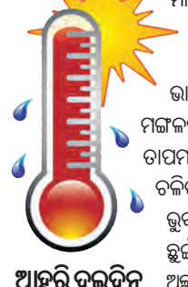
ଆହୁରି ଦୁଇଦିନ ହସ୍ତସ୍ପର୍ଶ କରିବ ତାପ ୨୨ରୁ ପଶ୍ଚିମା ଝଡ଼ ପ୍ରଭାବରେ ବର୍ଷା ସୃଷ୍ଟି ହୋଇଛି । ବର୍ତ୍ତମାନ ରାଜ୍ୟ ଉପରେ କୌଣସି ପାଣିପାଗ ନିୟମକ ରହୁ ନଥିବାରୁ ପୃଷ୍ଠାକୁ ସିଧା ସୂର୍ଯ୍ୟକିରଣ ପଡ଼ୁଛି । ଫଳରେ ମଙ୍ଗଳବାର ଦିନତମାମ ଟାଣଖରା ପୁଷ୍ଟାଏ

ଭୁବନେଶ୍ୱର, ୨୦୧୯ (ସମ୍ପାଦକ): ମାଘ ସରିନି, ରାଜ୍ୟରେ ଏବେଠୁ ଗ୍ରୀଷ୍ମ ପ୍ରବାହ ଆରମ୍ଭ ହୋଇଗଲାଣି । ଫେବୃଆରୀ ମଧ୍ୟଭାଗରୁ କୁମ୍ଭୀର ଭାବେ ଚାପମାତ୍ରା ବଢ଼ି ଚାଲିଛି । ମଙ୍ଗଳବାର ହଠାତ୍ ଅଧା ଓଡ଼ିଶାରେ ଚାପମାତ୍ରା ୩୫ ଡିଗ୍ରୀ ଛୁଇଁଥିବା ବେଳେ ଚଳିତ ବର୍ଷ ପ୍ରଥମଥର ପାଇଁ ରାଜଧାନୀ ଭୁବନେଶ୍ୱରରେ ତାପ ୩୭ ଡିଗ୍ରୀ ଛୁଇଁଛି । ଗତ ଦୁଇ ତିନି ଦିନ ହେବ ଅଳ୍ପ କିଛି ଜିଲ୍ଲାରେ ଚାପମାତ୍ରା ୩୫ ଡିଗ୍ରୀ ଛୁଇଁଥିବା ବେଳେ ମଙ୍ଗଳବାର ଏକାଥରେ ୧୫ଟି ଜିଲ୍ଲାର ପାରବ ୩୫ ଡିଗ୍ରୀ ଛୁଇଁଛି । ମାର୍ଚ୍ଚ ପୂର୍ବରୁ ଏଭଳି ଖରା ଅନୁଭୂତ ହୋଇଥିବାବେଳେ ଚଳିତବର୍ଷ ଗ୍ରୀଷ୍ମ ପ୍ରବାହ ଲୋକଙ୍କୁ କଳବଳ କରିବା ନେଇ ଏବେଠାରୁ ଆଶଙ୍କା ରହିଛି । ବର୍ତ୍ତମାନ ରାଜ୍ୟ ଉପରେ କୌଣସି ପାଣିପାଗ ନିୟମକ ରହୁ ନଥିବାରୁ ପୃଷ୍ଠାକୁ ସିଧା ସୂର୍ଯ୍ୟକିରଣ ପଡ଼ୁଛି । ଫଳରେ ମଙ୍ଗଳବାର ଦିନତମାମ ଟାଣଖରା ପୁଷ୍ଟାଏ