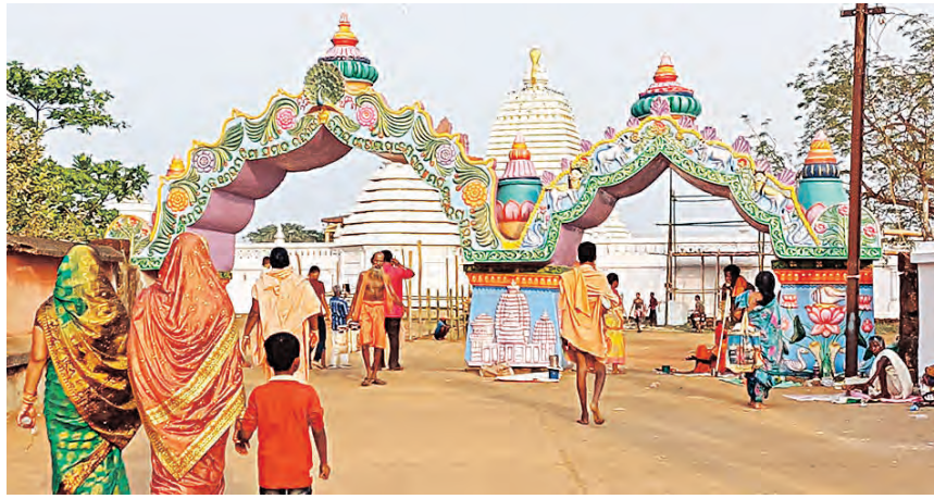
କୈାସା ଜଗତ କଲ୍ୟାଣ ଉଦ୍ଦେଶ୍ୟରେ ଯୁତାହୁଡ଼ି ଦେବା ପାଇଁ ଅପେକ୍ଷା କରିଆଛି। ମହିମା ଗାଦୀରେ ଥିବା ମାଘ ଶୁକ୍ଳ ଚତୁର୍ଦ୍ଦଶୀ ଓ ପୂର୍ଣ୍ଣିମା ତିଥିରେ ବୃହତ ବୃହତ ଝାଡ଼ ଦୀପୋତ୍ସାହୁଡ଼ି କରାଯାଏ। ଏକ ପବିତ୍ର ତିଥିରେ

କୈାସା, ୨୦୧୨ (ସମ୍ବିଧ): ଡେକ୍‌ନାଲ ଜିଲ୍ଲାର କୈାସା ବ୍ଲକ ଅନ୍ତର୍ଗତ ବିଶ୍ୱପ୍ରସିଦ୍ଧ ଯୋରନ୍ଦା ମହିମା ଗାଦୀରେ ଗୁରୁବାରଠାରୁ ପ୍ରସିଦ୍ଧ ଯୋରନ୍ଦା ମେଳା ଅନୁଷ୍ଠିତ ହେଉଛି। ଏହି ମେଳାରେ ୫ଲକ୍ଷ ଭକ୍ତଙ୍କ ସମାଗମ ହେବ ବୋଲି ଆଶା କରାଯାଇଛି। ବିଶ୍ୱପ୍ରସିଦ୍ଧ ଯୋରନ୍ଦା ମେଳା ଆଉ ଗୋଟିଏ ଦିନ ବାକି ଅଛି। ମହିମା ଧର୍ମର ସାଧୁ, ଭକ୍ତ, ସ୍ଥାନୀୟ ବାସିନ୍ଦା ଓ ଉଠା ବୋକାମାନଙ୍କ ସମାଗମରେ ମହିମାଗାଦୀ ଚଳଚ୍ଚିତ୍ର ହୋଇଉଠିଛି। ଚଳିତବର୍ଷ ଭଲ ଫସଲ ହୋଇଥିବାରୁ ଓ ସମାଜସୁଖରେ ମଧ୍ୟରେ ସୌଖିନ୍ୟତା ବାଟାବରଣ ଥିବାରୁ ମେଳା ଶାନ୍ତିଶୃଙ୍ଖଳାରେ ସହ ହେବ ବୋଲି ଆଶା କରାଯାଇଛି। ପ୍ରାୟ ୫ଲକ୍ଷ ଭକ୍ତ ଓ ଯାତ୍ରୀଙ୍କ ସମାଗମ ହେବ ବୋଲି ମହିମା ମନ୍ତ୍ରୀ କରାଯାଇଛି। ଓଡ଼ିଶାର ନିଜସ୍ୱ ଧର୍ମ ଆଦିପାଠା ମହିମାଗାଦୀ ଯୋରନ୍ଦା ମହିମା ସମାଜ ନିକଟ ଲାକାଖେଳା ସମ୍ପର୍କରେ କହି ଏହି ପାଠକୁ ସମଗ୍ର ବିଶ୍ୱ କରବାବରେ ପରିଚିତ କରି ପାରିବୁ। ୧୮-୧୯ ମସିହାରେ ମହିମାସାମାଜ ମହାପ୍ରୟାଣ ପରଠାରୁ ପ୍ରତିବର୍ଷ ମାସ ଶୁକ୍ଳ ଚତୁର୍ଦ୍ଦଶୀ ତିଥିରେ ଯୋରନ୍ଦା