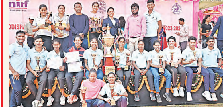
ରାଜ୍ୟସ୍ତରୀୟ ଆନ୍ଧ୍ର ବିଶ୍ୱବିଦ୍ୟାଳୟ ଦୌଡ଼କୁ ଦଳ ଚାମ୍ପିଅନ