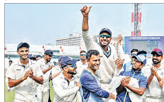
ସମସ୍ତପ୍ରକାର କ୍ରିକେଟ୍‌ରୁ ଅବସର ନେବାପରେ ମନୋଜ ତିୱାରୀଙ୍କୁ ସାଥୀ ବେଙ୍ଗଲ ଖେଳାଳିମାନେ କାନ୍ଧରେ ବସାଇ ପଢ଼ିଆ ଚାରିକଣ୍ଠେ ବୁଲାଇଛନ୍ତି।