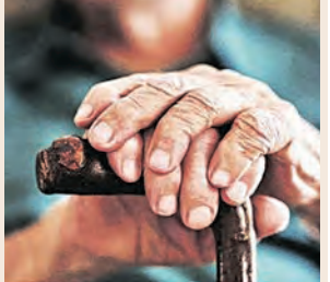
ବୃଦ୍ଧାଗ୍ରମଣ୍ଡଳରେ ମାନସିକ ସ୍ୱସ୍ଥତାକୁ ଦିଆଯିବ ଗୁରୁତ୍ୱ

■ ଭୁବନେଶ୍ୱର, ୧୯ (ସମ୍ବିଧ): ବରିଷ୍ଠ ନାଗରିକଙ୍କ ପାଇଁ ଖୁବ୍‌ଶୀଘ୍ର ଏକ ସ୍ୱତନ୍ତ୍ର ରାଜ୍ୟସ୍ତରୀୟ ସେଲ୍ ଗଠନ କରାଯିବ । ଏଥିରେ ରାଜ୍ୟ ସରକାରଙ୍କ ବିଭିନ୍ନ ସଂସ୍ଥାର ତୋମେନ ଏକ୍ସପର୍ଟ (ବିଶେଷଜ୍ଞ) ସହଯ୍ୟ ରହିବାକୁ ଥିବା ବେଳେ ସେମାନେ ରାଜ୍ୟରେ କାର୍ଯ୍ୟକ୍ରମ ଥିବା ବୃଦ୍ଧାଗ୍ରମଣ୍ଡଳର ନିରୀକ୍ଷଣ କରିବେ । ବରିଷ୍ଠ ନାଗରିକଙ୍କ ହିତରେ ଏହି ସ୍ୱତନ୍ତ୍ର ସେଲ୍ କାମ କରିବାକୁ ଥିବା ବେଳେ ଏହାର ଗଠନରେ ବିଭିନ୍ନ ଅନ୍ତର୍ଜାତୀୟ ଏବଂ ଜାତୀୟ ସଂସ୍ଥାମାନେ ସହଯୋଗ ଯୋଗାଇଦେବେ । ନିକଟରେ ରାଜ୍ୟ ସରକାରଙ୍କ ଏକାଧିକ ବିଭାଗକୁ ନେଇ ଅନୁଷ୍ଠିତ ଏକ ଉଚ୍ଚସ୍ତରୀୟ ବୈଠକରେ ଉପରୋକ୍ତ ନିଷ୍ପତ୍ତି ଗ୍ରହଣ କରାଯାଇଛି ।