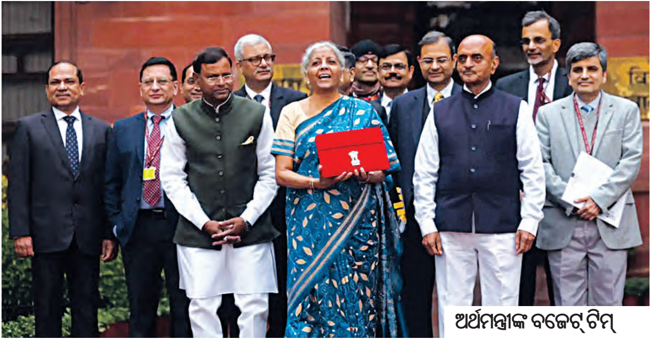
ଅର୍ଥମନ୍ତ୍ରୀଙ୍କ ବଜେଟ୍ ଟିମ୍