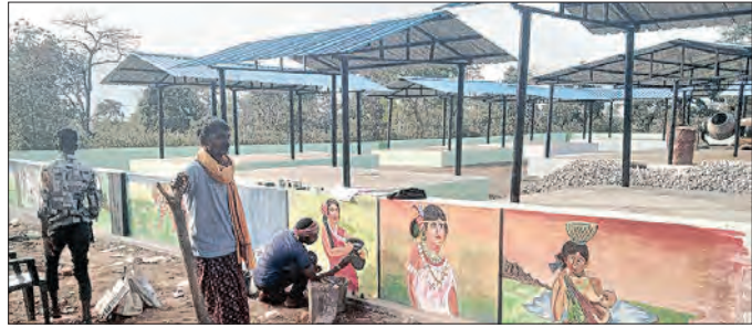
ନୂଆପଡ଼ା/ବୋଡେନ, ୧୫ (ସମ୍ପାଦକ)

ନୂଆପଡ଼ା ଜିଲ୍ଲାର ଉପାନ୍ତ ତଥା ମାଓବାଦୀ ପ୍ରବଣ ଗାଁ ଗୁଡ଼ିକରେ ସାଧାରଣ ଲୋକଙ୍କ ଜୀବନ ଜୀବିକା ପ୍ରଭାବିତ ହେଉଥିବା ଲକ୍ଷ୍ୟ କରି ସରକାର କିଶାବିକା ବ୍ୟବସ୍ଥାକୁ ପ୍ରମୁଖ କରିବାକୁ ଗାଁ ହାଟ (ସାର୍ଟ ବଜାର) ବ୍ୟବସ୍ଥା ହାତକୁ ନେଇଛନ୍ତି । ଏହି କ୍ରମରେ ନୂଆପଡ଼ା ଜିଲ୍ଲା ସୁନାବେଡ଼ା ଅଞ୍ଚଳରୁ ଉଦ୍ଧୃତ ଥିବା ପାଟପହାଁ ଭଳି ଦୁର୍ଗମ ଅଞ୍ଚଳରେ ସରକାର ଗାଁ ହାଟ ବ୍ୟବସ୍ଥା ହାତକୁ ନେଇଛନ୍ତି । ନୂଆପଡ଼ା ଜିଲ୍ଲାପାଳଙ୍କ ନିର୍ଦ୍ଦେଶକ୍ରମେ ସ୍ଥାନୀୟ ବିଭିନ୍ନ ଉଦ୍ୟମ କ୍ରମେ ହାଟ ତିଆରି କାମ ଶେଷ ହେବା ଉପରେ । ଏହାକୁ ନେଇ ଗ୍ରାମବାସୀ ଖୁସି ପ୍ରକଟ କରୁଛନ୍ତି ।