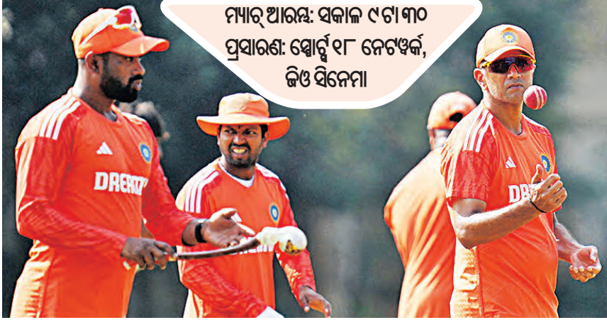
ମ୍ୟାଚ ଆରମ୍ଭ: ସକାଳ ୯ଟା ୩୦ ପ୍ରସାରଣ: ସ୍ୱୋର୍ସ୍ ୧୮ ନେଟୱର୍କ, ଢିଓ ସିନେମା

ବିଶାଖାପଟନମ୍, ୧୨ (ଏକେଡ୍ୱି): ସ୍ଥାନୀୟ ଖାଲିଏସ୍ ରାଜଶେଖରରେ ୧୨ତମ ଦିନର ଷ୍ଟେଡିଂରେ ଶୁକ୍ରବାରଠାରୁ ଭାରତ ଓ ଉପକ୍ରମର ଲକ୍ଷ୍ୟ ମଧ୍ୟରେ ଦ୍ୱିତୀୟ ଟେଷ୍ଟ ମ୍ୟାଚ ଆରମ୍ଭ ହେବ। ହାଲଦବାଦ୍ରେ ପ୍ରଥମ ଟେଷ୍ଟରେ ଅପ୍ରତ୍ୟାଶିତ ଭାବେ ପରାଜୟ ବରଣ କରିବା ପରେ ଭାରତୀୟ ଦଳ ଏବେ ଚାପର ସମ୍ମୁଖୀନ ହୋଇଛି। ୫ ମ୍ୟାଚ ବିଶିଷ୍ଟ ଏହି ହାଲପ୍ରୋପାଲ ଷ୍ଟେଡିଂରେ ୦-୧ରେ ପଛରେ ପଡ଼ିଥିବା ଭାରତ ପ୍ରତ୍ୟାବର୍ତ୍ତନ କରି ବିଜୟ ହେବା ସହ ଦ୍ୱିତୀୟ ଟେଷ୍ଟକୁ ୧-୧ ବରାବର ସ୍ଥିତିକୁ ଆଣିବାକୁ ଚେଷ୍ଟା କରିବ। ପ୍ରଥମ ଦାକରେ ଅଗ୍ରଣୀ ହାସଲ କରିଥିଲେ ମଧ୍ୟ ଦ୍ୱିତୀୟରେ ଭାରତୀୟ ବ୍ୟାଟିଂ ଓ ବୋଲିଂ ବିପକ୍ଷରେ ପଡ଼ିଥିଲା। ପୁଣି ଲୋକେଶ ରାହୁଲ ଓ ବବାହ କାଚେରୀ ଇଲି ଅଭିଷ୍ଟ କ୍ରିକେଟର ଆୟାତ ସମୟା କାରଣରୁ ଦଳରୁ ବାଦପଡ଼ିବା ପରେ ତିନି ମ୍ୟାନେଜମେଣ୍ଟର ତିନି ବଦଳିଗଲା। ପ୍ରଥମ ଟେଷ୍ଟରେ ଲକ୍ଷ୍ୟ ବ୍ୟାଟର ଓଲି ପୋପ ଭାରତଠାରୁ ଏକପ୍ରକାର ମ୍ୟାଚ ଛାଡ଼ାଇ ନେଇଥିଲେ। ଭାରତୀୟ ସ୍କିନରକ ପାଖରେ ତାଙ୍କ ପାଇଁ ଜବାବ ନ ଥିଲା। ପୁଣି ଚାରଣା ବ୍ୟାଟର କୋହଲିଙ୍କ ଅନୁପସ୍ଥିତି ଭାରତ ପାଇଁ ନଜର। ସାବ୍ୟସ୍ତ ହୋଇଛି। ପ୍ରଥମ ଟେଷ୍ଟ ବିଜୟ ପରେ ଲକ୍ଷ୍ୟ ଦଳର ଆତ୍ମବିଶ୍ୱାସ ବୃଦ୍ଧି ହୋଇଛି।