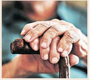
ବୃଦ୍ଧାଗ୍ରମଣିକର ମାନସିକ ସ୍ୱସ୍ଥତାକୁ ଦିଆଯିବ ଗୁରୁତ୍ୱ

■ ଭୁବନେଶ୍ୱର, ୧୯ (ସମ୍ବାଦ): ବରିଷ୍ଠ ନାଗରିକଙ୍କ ପାଇଁ ଖୁବ୍‌ଶୀଘ୍ର ଏକ ସ୍ୱତନ୍ତ୍ର ରାଜ୍ୟସ୍ତରୀୟ ସେଲ୍ ଗଠନ କରାଯିବ । ଏଥିରେ ରାଜ୍ୟ ସରକାରଙ୍କ ବିଭିନ୍ନ ସଂସ୍ଥାର ତୋମେନ ଏକତ୍ର (ବିଶେଷଜ୍ଞ) ସହଯ୍ୟ ରହିବାକୁ ଥିବା ବେଳେ ସେମାନେ ରାଜ୍ୟରେ କାର୍ଯ୍ୟକ୍ରମ ଥିବା ବୃଦ୍ଧାଗ୍ରମଣିକର ନିରୀକ୍ଷଣ କରିବେ । ବରିଷ୍ଠ ନାଗରିକଙ୍କ ହିତରେ ଏହି ସ୍ୱତନ୍ତ୍ର ସେଲ୍ କାମ କରିବାକୁ ଥିବା ବେଳେ ଏହାର ଗଠନରେ ବିଭିନ୍ନ ଅନ୍ତର୍ଜାତୀୟ ଏବଂ ଜାତୀୟ ସଂସ୍ଥାମାନେ ସହଯୋଗ ଯୋଗାଇଦେବେ । ନିକଟରେ ରାଜ୍ୟ ସରକାରଙ୍କ ଏକାଧିକ ବିଭାଗକୁ ନେଇ ଅନୁଷ୍ଠିତ ଏକ ଉଚ୍ଚସ୍ତରୀୟ ବୈଠକରେ ଉପରୋକ୍ତ ନିଷ୍ପତ୍ତି ଗ୍ରହଣ କରାଯାଇଛି ।