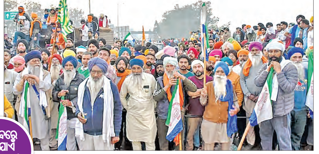
ପଞ୍ଚାବରେ ୨୬ ଯାଏଁ ଇଣ୍ଡିଆନ୍ ନେସନାଲ ଆରମ୍ଭ

ନୂଆଦିଲ୍ଲୀ, ୧୮୧ (ଏକେନ୍ଦ୍ରି): ଏମ୍ଏସ୍ ସିଏଲ୍ ନେତାଙ୍କୁ କେନ୍ଦ୍ରକୁ ଚାଷୀନେତାଙ୍କ ଚେତାବନୀ ପ୍ରଦାନ କରିବାକୁ ନିର୍ଦ୍ଦେଶ ଦିଆଯାଇଛି ।