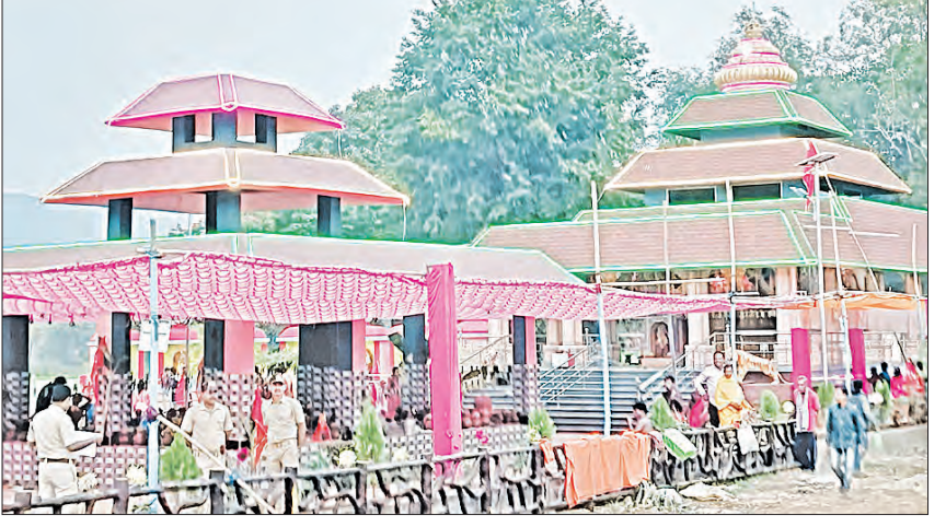
ଆରମ୍ଭ ହୋଇଥିଲା। ହିମାଚଳ ପ୍ରଦେଶର ହିଡ଼ିମ୍ବେଶ୍ୱରୀ ମନ୍ଦିର ଶୈଳୀରେ ଏହା ନିର୍ମାଣ ହୋଇଛି।