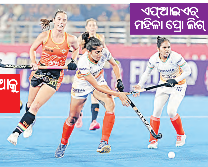
ଏସିଆଲ ଏବଂ ମହିଳା ପ୍ରୋ ଲିଗ୍

ରାଉରକେଲାର ବିର୍ସା ମୁଣ୍ଡା ହକି ଷ୍ଟାଡିୟମରେ ଶନିବାର ରାତିରେ ଖେଳାଯାଇଥିବା ଏସିଆଲ ଏବଂ ମହିଳା ପ୍ରୋ ଲିଗର ଏକ କଡ଼ା ସଂଘର୍ଷପୂର୍ଣ୍ଣ ମ୍ୟାଚରେ ଘରୋଇ ଭାରତ ୧-୦ ଗୋଲରେ ଶକ୍ତିଶାଳୀ ଅଷ୍ଟ୍ରେଲିଆକୁ ହରାଇଦେଇଛି । ଏସିସହ ଭାରତୀୟ ମହିଳା ହକି ଦଳ ଗତ ସପ୍ତାହରେ