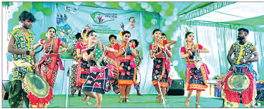
ବେଓଗାଁ, ୧୭୧୨ (ସମ୍ବିଧ)