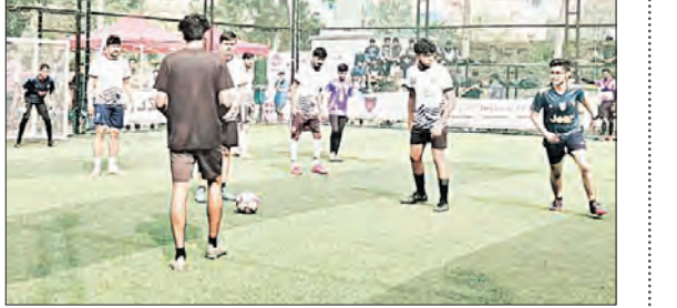
ଭୁବନେଶ୍ୱର, ୧୭୧୨ (ସମ୍ପାଦକ) : ଏକାମ୍ର କର୍ମ ଶ୍ରେଣୀ ପୁଟବଲ୍ ଚାମ୍ପିୟନସିପ୍ ଶନିବାରଠାରୁ ଉତ୍ସାହପୂର୍ଣ୍ଣ ଭାବରେ ଆରମ୍ଭ ହୋଇଛି । ଜଗନ୍ନାଥ ଷ୍ଟାଡ଼ିୟମରେ ଆନୁକୂଲ୍ୟରେ ଆୟୋଜିତ ଏହି କ୍ରୀଡ଼ା ଦିନିଆ ୬-୮ ବର୍ଷର ପୁଟବଲ୍ ପ୍ରତିଯୋଗିତାରେ ମୋଟ ୪୦ ଦଳ ଅଂଶଗ୍ରହଣ କରିଛନ୍ତି । ଯେଉଁଥିରେ ଓଡ଼ିଶାର ୬ ଜିଲ୍ଲାର ୩୮ ଦଳ ଏବଂ ୨ଟି କଲେଜ ଦଳ ରହିଛି । କଲେଜ ଛାତ୍ରଙ୍କ ଦଳରେ ସମସ୍ତ ଖେଳାଳି ବିଦେଶୀ ରହିଛନ୍ତି । ରବିବାର ଉଦ୍ଘାଟିତ ହେବାକୁ ଥିବା ଏହି ପ୍ରତିଯୋଗିତାର ପୁରସ୍କାର ରାଶି ୫୦ ହଜାର ଟଙ୍କା ରହିଛି । ନିର୍ଦ୍ଦେଶକ ଭାବରେ ମ୍ୟାଚ୍ ଖେଳାଯାଇଛି ।