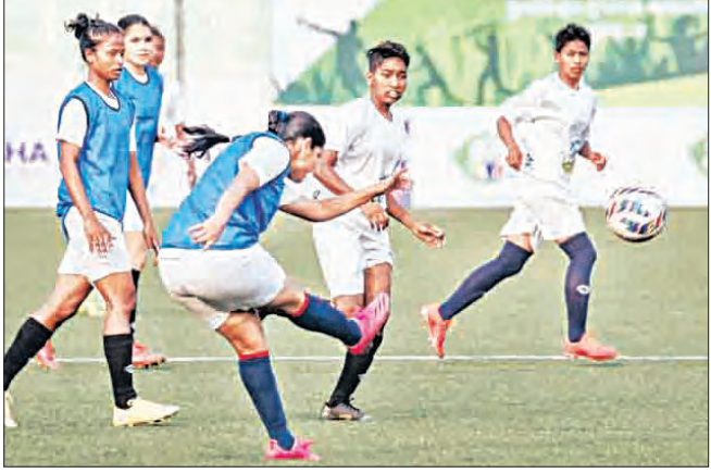
ଭୁବନେଶ୍ୱର, ୧୭୧୨ (ସମ୍ପାଦକ) : ନୂଆ ଓଡ଼ିଶା ଅଭିଯାନର ମୂଳ ପ୍ରାର୍ଥନା ହେଉଛି ଅଂଶଗ୍ରହଣକାରୀଙ୍କୁ ଉତ୍ସାହିତ କରିବା ଏବଂ ସେମାନଙ୍କ ପ୍ରତିଭାକୁ ବିଭିନ୍ନ ସ୍ତରରେ ମାଧ୍ୟମରେ ପ୍ରଦର୍ଶିତ କରିବା ପାଇଁ ଉତ୍ସାହିତ କରିବା ଏବଂ ସେମାନଙ୍କର ସାମଗ୍ରିକ ବିକାଶକୁ ପ୍ରୋତ୍ସାହିତ କରିବା । ଆଜିର ପ୍ରତିଯୋଗିତାମୂଳକ ସୂଚନାରେ ଯୁବପିଢ଼ିଙ୍କ ସାମଗ୍ରିକ ବିକାଶରେ ବାଧ୍ୟ