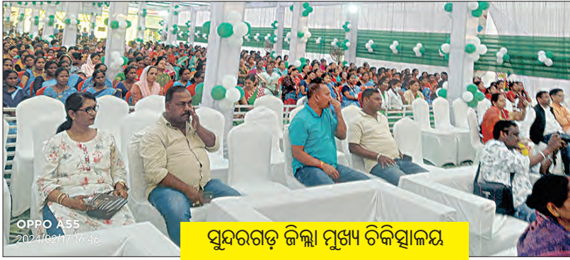
ସୁନ୍ଦରଗଡ଼ ଜିଲ୍ଲା ମୁଖ୍ୟ ଚିକିତ୍ସାଳୟ