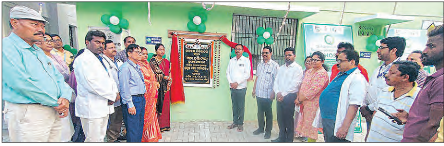
ଛତ୍ରପୁର, ୧୭ ୧୨ (ସମିପ)

'ଆମ ହସ୍ତିଚାଳ' ଯୋଜନାରେ ଗଞ୍ଜାମ ଜିଲ୍ଲାରେ ୧୩ଟି ସରକାରୀ ଡାକ୍ତରଖାନାର '୫-ଟି' ଉପକ୍ରମରେ ରୂପାନ୍ତରଣ ହୋଇଛି।