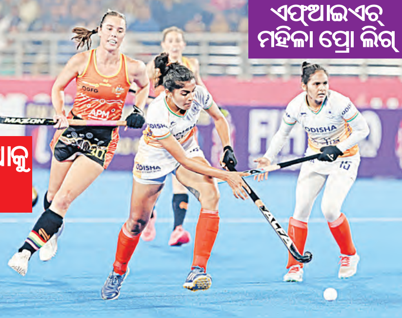
ଏସ୍‌ଆଇଏର୍ ମହିଳା ପ୍ରୋ ଲିଗ୍

ରାଉରକେଲାର ବିର୍ସା ମୁଣ୍ଡା ହକି ଷ୍ଠାଳୟରେ ଶନିବାର ରାତିରେ ଖେଳାଯାଇଥିବା ଏସ୍‌ଆଇଏର୍ ମହିଳା ପ୍ରୋ ଲିଗ୍‌ର ଏକ କଡ଼ା ସଂଘର୍ଷପୂର୍ଣ୍ଣ ମ୍ୟାଚ୍‌ରେ ଘରୋଇ ଭାରତ ୧-୦ ଗୋଲରେ ଶକ୍ତିଶାଳୀ ଅଷ୍ଟ୍ରେଲିଆକୁ ହରାଇଦେଇଛି । ଏସ୍‌ସହ ଭାରତୀୟ ମହିଳା ହକି ଦଳ ଗତ ସପ୍ତାହରେ