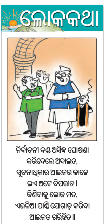
ନିର୍ବାଚନୀ ବସ୍ତୁ ଅଧିକ ଘୋଷଣା କରିଦେଲେ ଅଧୀକାର, ସୂଚନାଧିକାର ଆଇନର କାଳେ ଇଏଏଟି ବିପରୀତ । କିଶିବାକୁ ଲୋକ ମତ, ଏକଲିଆ ପାଣ୍ଡି ଯୋଗାଡ଼ କରିବା ଆଇନଟି ଗଠିତ ।

ଧର୍ମଶାଳା ପାଇଁ କୁଳତା ସମାଜକୁ ମିଳିଲା ଜମି ଭୁବନେଶ୍ୱର, ୧୬/୨ (ସମ୍ବିଧ): କଥା ଦେଇ କଥା ରଖୁଥିବା ମୁଖ୍ୟମନ୍ତ୍ରୀ ନବୀନ ପଟ୍ଟନାୟକ ଆଜି ପୁଣିଥରେ ଏହି ଉଦ୍ଦେଶ୍ୟ ସମ୍ପୂର୍ଣ୍ଣ ସାଧନାରେ ରଖିଛନ୍ତି । ପୂର୍ବ ପ୍ରତିଶ୍ରୁତି ଅନୁଯାୟୀ ମୁଖ୍ୟମନ୍ତ୍ରୀ ଆଜି ପୁଣି ବାଲୁଖଣ୍ଡ ମୌଳିକରେ ଓଡ଼ିଶା କୁଳତା ସମାଜର ଧର୍ମଶାଳା ନିର୍ମାଣ ପାଇଁ ୧୯୫୫ରୁ ଜମି ଦେଇଛନ୍ତି । ବିନା ପ୍ରିମିୟମ୍, ବିନା ଜନସିତେଶ୍ୱାଳା ଦେୟ ଏବଂ ସ୍ୱଳ୍ପ ବାର୍ଷିକ ଭୁରାଜସ୍ୱ ଓ ସେବରେ ଦେବା ପାଇଁ ରାଜ୍ୟ କ୍ୟାବିନେଟ ନିଷ୍ପତ୍ତି ନେଇଛନ୍ତି । ଏଥିପାଇଁ ଓଡ଼ିଶା କୁଳତା ସମାଜକୁ ବାର୍ଷିକ ଭୁ-ରାଜସ୍ୱ ବ୍ୟବସ୍ଥାରେ ୧୦୦ ଟଙ୍କା ଓ ବାର୍ଷିକ ଭୁ-ରାଜସ୍ୱର ୬୫% ହିସାବରେ ୬୫ ଟଙ୍କାକୁ ମିଶାଇ ସର୍ବମୋଟ ୧୬୫ ଟଙ୍କା ଦେବାକୁ ହେବ ।