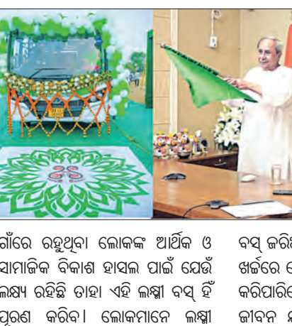
ଗାଁରେ ରହୁଥିବା ଲୋକଙ୍କ ଆର୍ଥିକ ଓ ସାମାଜିକ ବିକାଶ ହାସଲ ପାଇଁ ଯେଉଁ ଲକ୍ଷ୍ୟ ରହିଛି ତାହା ଏହି ଲକ୍ଷ୍ମୀ ବସ୍ ହିଁ ପୂରଣ କରିବ । ଲୋକମାନେ ଲକ୍ଷ୍ମୀ

ଭୁବନେଶ୍ୱର, ୧୬/୨ (ସମ୍ବିଧ): ଆଜିଠାରୁ ରାଜ୍ୟର ଆଉ ୬ ଜିଲ୍ଲାରେ ଗଢ଼ିବାକୁ ପ୍ରତ୍ୟାକ୍ଷ ଲକ୍ଷ୍ମୀ ବସ୍ । ମୁଖ୍ୟମନ୍ତ୍ରୀ ନବୀନ ପଟ୍ଟନାୟକ ଭିତ୍ତି ଓ କର୍ମପରୋକ୍ତି କରିଆସି ଖୋର୍ଦ୍ଧା, ପୁରୀ, କେନ୍ଦ୍ରୀୟତା, ଭଦ୍ରକ, ଯାଜପୁର ଓ ନୟାଗଡ଼ ଜିଲ୍ଲାରେ ଲକ୍ଷ୍ମୀ ବସ୍ ଯୋଜନାର ଶୁଭାରମ୍ଭ କରିଛନ୍ତି । ଫଳରେ ଏହି ୬ ଜିଲ୍ଲାର ୧୩୬୩ଟି ପଞ୍ଚାୟତରେ ୧୯୮୮ଟି ବସ୍ ୬୫ ଲକ୍ଷରୁ ଅଧିକ ଲୋକଙ୍କୁ ଆରାମଦାୟକ, ସରକ୍ଷିତ ଓ ସମଯୋଗିତ କରିବ । ଏହି ଯୋଜନାରେ ପ୍ରାୟ ୧୫ ଲକ୍ଷରୁ ଅଧିକ ଲୋକଙ୍କୁ ଆରାମଦାୟକ, ସରକ୍ଷିତ ଓ ସମଯୋଗିତ କରିବ । ଏହି ଅବସରରେ ମୁଖ୍ୟମନ୍ତ୍ରୀ କହିଛନ୍ତି ଯେ