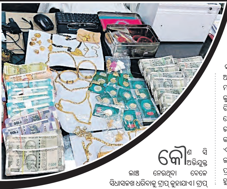
କୌଣସି ଅଭିଯୁକ୍ତ ଲାଞ୍ଚ ନେଉଥିବା ବେଳେ ସିଧାସଳଖ ଧରିବାକୁ ଗ୍ରାପ୍ କୁହାଯାଏ । ଗ୍ରାପ୍