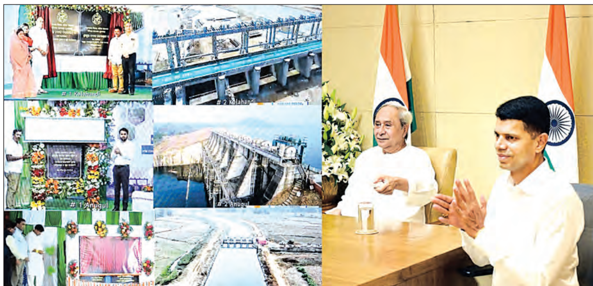
କଳାହାଣ୍ଡି, କଟକ, ଡେକାନାଲ ଓ ଅନୁଗୋଳ ଜିଲ୍ଲାର ଚାଷ ଜମିକୁ ଜଳସେଚନ ସୁବିଧା ଉପଲବ୍ଧ। ଏଟିଏମ୍ ଉଦ୍‌ଘାଟନରେ ସାହୁଲ ବ୍ୟାରେଜ କାମ ଧର୍ଯ୍ୟାୟକୁପେ ମାଧ୍ୟମରେ ଫାସ ପୂର୍ବରୁ ଶେଷ ହେଲା।

ରେଙ୍ଗାଳି ତ୍ୟାମ ଓ ସମଲ ବ୍ୟାରେଜ କେନାଲ ପ୍ରଣାଳୀ କାମ ଧର୍ଯ୍ୟାୟକୁପେ କାର୍ଯ୍ୟକାରୀ କରାଯାଇଛି। ଏହାଦ୍ୱାରା କଟକ ଜିଲ୍ଲାର ଆଠଗଡ଼ ଓ ଡିଭିଜନାଲ ବ୍ଲକ୍ ଏବଂ ଡେକାନାଲ ବ୍ଲକ୍ ଏବଂ ହଜାର ହେକ୍ଟର ଜମି ଜଳସେଚନ ହୋଇପାରିବ।