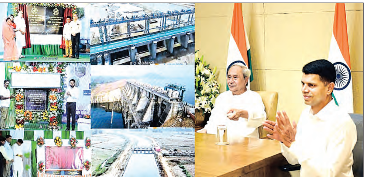
କଳାହାଣ୍ଡି, କଟକ, ଢେଙ୍କାନାଳ ଓ ଅନୁଗୋଳ ଜିଲ୍ଲାର ଚାଷ ଜମିକୁ ଜଳସେଚନ ସୁବିଧା ଉପଲବ୍ଧ କରିବା ପାଇଁ ମୁଖ୍ୟମନ୍ତ୍ରୀଙ୍କ ପଦକ୍ଷେପ।

ରେଙ୍ଗାଳି ତ୍ୟାମ ଓ ସମଲ ବ୍ୟାରେଜ କେନାଲ ପ୍ରକଳ୍ପ କାର୍ଯ୍ୟକ୍ରମରେ ସାହୁଲ, ମନଯୋର ପ୍ରକଳ୍ପ ଏବଂ ରେଙ୍ଗାଳି ତ୍ୟାମ ଓ ସମଲ ବ୍ୟାରେଜ କେନାଲ ସିଷ୍ଟମ କାର୍ଯ୍ୟକ୍ରମ ଲୋକାର୍ପିତ କରିଛନ୍ତି।