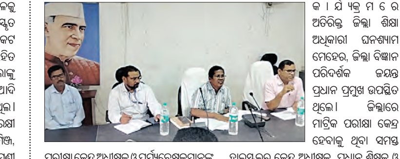
ବୌଦ୍ଧ, ୧୩/୧୨(ସମ୍ବିଧ): ବୌଦ୍ଧ ସର୍ବ ଶିକ୍ଷା ଅଧିକାରୀ କାର୍ଯ୍ୟକ୍ରମ ପ୍ରଶିକ୍ଷଣ କେନ୍ଦ୍ରରେ ଜିଲ୍ଲା ମାଟ୍ରିକ ପରୀକ୍ଷା କେନ୍ଦ୍ର ଅଧ୍ୟକ୍ଷ, ପର୍ଯ୍ୟବେକ୍ଷକ ପ୍ରଶିକ୍ଷଣ ଶିବିର ଆରମ୍ଭ କରାଯାଇଥିଲା।