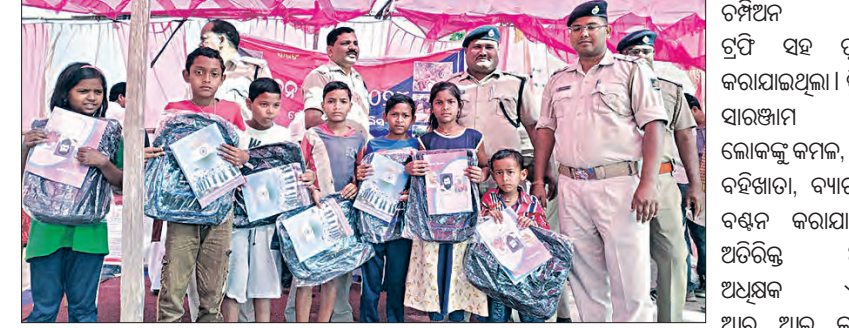
ହରଭଙ୍ଗା, ୧୩/୧୨(ସମ୍ବିଧ): ହରଭଙ୍ଗା ବୁଦ୍ଧ ଉପାଧ୍ୟକ୍ଷଙ୍କୁ ପୁଲିସର ଜନମୈତ୍ରୀ ଶିବିର ଅନୁଷ୍ଠିତ ହୋଇଥିଲା।

ଚାରିକିଳ, ୧୩/୧୨(ସମ୍ବିଧ): ହରଭଙ୍ଗା ବୁଦ୍ଧ ଉପାଧ୍ୟକ୍ଷଙ୍କୁ ପୁଲିସର ଜନମୈତ୍ରୀ ଶିବିର ଅନୁଷ୍ଠିତ ହୋଇଥିଲା।