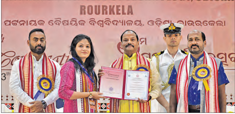
ରାଉରକେଲା, ୧୩ 19 (ସମିପ)

ବିଜୁ ପଟ୍ଟନାୟକ ବିଶ୍ୱବିଦ୍ୟାଳୟ (ବିପିୟୁଟି) ର ୧୦ମ ସମାବର୍ତ୍ତନ ଉତ୍ସବ ମଙ୍ଗଳବାର ଅନୁଷ୍ଠାନର ନେତାଜୀ ସ୍ମାରଣ ଅଭିଯୋଗୀମାନଙ୍କୁ ଅନୁଷ୍ଠାନରେ ହୋଇଛି ।