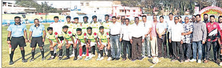
ସୋନପୁର, ୧୩/୧୨(ସମ୍ବିଧ): ୧୫ତମ ଆଲ ଭିଏସ୍ ରାମଧୁନ୍ କପ୍ ଫୁଟବଲ ଟୁର୍ଣ୍ଣାମେଣ୍ଟରେ ମଙ୍ଗଳବାର ଭୁବନେଶ୍ୱର ଜଗା ଯୁନାଇଟେଡ୍ ଏବଂ କଲିକତା ବେଲୁରୀଆ ଆଥଲେଟିକ କ୍ଲବ୍ ମଧ୍ୟରେ ଫାଇନାଲ୍ ମ୍ୟାଚ୍ ଖେଳି ଅନ୍ତର୍ଦ୍ଧେଇ ହୋଇଥିଲା।