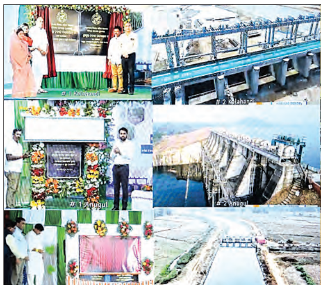
କଳାହାଣ୍ଡି, କଟକ, ଢେଙ୍କାନାଳ ଓ ଅନୁଗୋଳ ଜିଲ୍ଲାର ଚାଷ ଜମିକୁ ଜଳସେଚନ ସୁବିଧା ଉପଲବ୍ଧ ହେବ। ଏହାଛଡା କଟକ ଜିଲ୍ଲାର ଆଠଗଡ଼ ଓ ଡିଭିଜନାଲ ଭୁବନେଶ୍ୱର ୧୫ ହଜାର ହେକ୍ଟର ଜମି ଜଳସେଚନ ହୋଇପାରିବ।

ରେଙ୍ଗାଳି ତ୍ୟାମ ଓ ସମଲ ବ୍ୟାରେଜ କେନାଲ ପ୍ରକଳ୍ପ କାର୍ଯ୍ୟକ୍ରମରେ ମୁଖ୍ୟମନ୍ତ୍ରୀ କଳାହାଣ୍ଡି, କଟକ, ଢେଙ୍କାନାଳ ଓ ଅନୁଗୋଳ ଜିଲ୍ଲାର ୩୨ ହଜାର ହେକ୍ଟର ଚାଷ ଜମିକୁ ଜଳସେଚନ ସୁବିଧା ଉପଲବ୍ଧ ହେବ। ଏହାଛଡା କଟକ ଜିଲ୍ଲାର ଆଠଗଡ଼ ଓ ଡିଭିଜନାଲ ଭୁବନେଶ୍ୱର ୧୫ ହଜାର ହେକ୍ଟର ଜମି ଜଳସେଚନ ହୋଇପାରିବ।